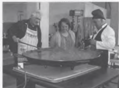
ARROSSADA POPULAR AL POLIVALENT.

Hem fet una excursió al Berguedà, visitant Castellar de N'Hug, el Museu del Cement i les Mines de Figols. Aquí vam fer un dinar que a mig fer tothom estava ben tip.