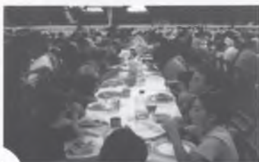
UN SOPAR DE FI DE CURS PER A 300 PERSONES.