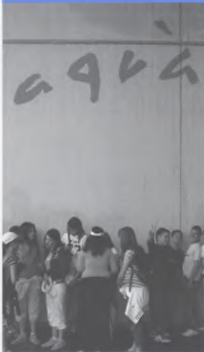
PREPARATS PER ENTRAR A L'AQUARIUM.

En acabar l'escola fem un viatge a les terres de Tarragona amb la finalitat de conèixer junts uns quants dies. En aquesta sortida vam veure moltes coses: l'Aquarium i l'Imax de Barcelona, el delta de l'Ebre, Penyíscola, la ciutat de Tarragona, Santes Creus. I també vam anar a Port Aventura, ja que no tot haurien de ser "pedres". Qui ha dit que la diversió no pot ser cultura...? La convivència fa que aquest dies tots es sentim bé i que aquest viatge sigui un bon comiat de l'escola que ens ha acollit durant aquests anys.