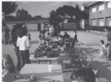
LA FIRA DE L'INTERCANVI.

L'AMIPA DE L'ESCOLA DE BESCANÓ (CEIP DR. SANTIAGO SOBREQÜÉS) AL LLARG D'AQUEST CURS HEM ORGANITZAT DIVERSES ACTIVITATS PER A PARES I ALUMNES, I EN AQUEST ARTICLE US EN FEM UN BREU RESUM.