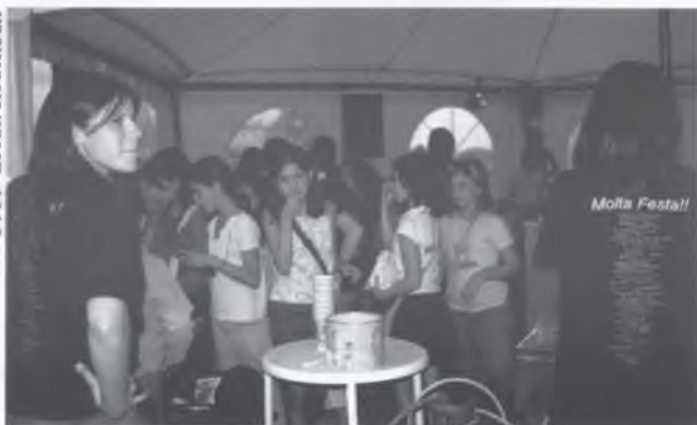
LA DISCOTECA INFANTIL VA SER UN GRAN ENCERT.