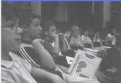
ANEGUETS AL PARLAMENT DE CATALUNYA.

El divendres 16 de juny vam anar a Barcelona. Primer vam visitar el camp del Barça i vam poder veure la copa de la Champions i l'estadi. També vam visitar el Museu del Barça. Tot seguit vam anar al Parlament de Catalunya on ens van explicar la seva història, quan es va construir i quan s'hi va establir el Parlament. Tothom estava molt atafegat, ja que el diumenge se celebrava el referèndum sobre la modificació de l'Estatut d'Autonomia i hi havia un munt de càmeres, pantalles de TV i gent fent tota mena de preparatius. Tot i així, la visita va ser molt interessant i vam poder seure a les cadires dels diputats i diputades al Parlament.