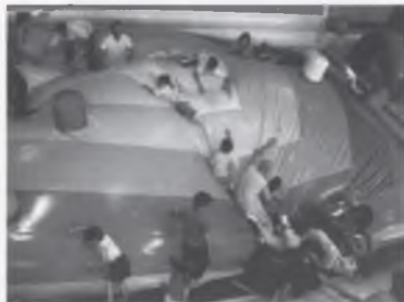
LA FESTA DE FI DE CURS AL PIG DE GIRONA.