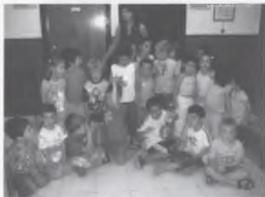
ELS MÉS PETITS EN EL TALLER D'EXPRESSIONI CORPORAL.