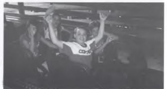
VIATGE A PORT AVENTURA.