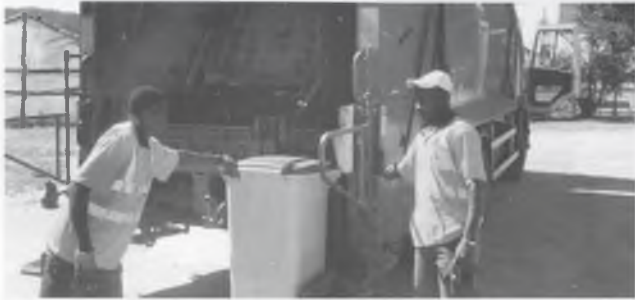
EL CAMIÓ BICOMPARTIMENTAT.

Què passa amb les nostres deixalles un cop les dipositem als contenidors? Per què s'han de reciclar? De quines infraestructures disposem? Sovint l'usuari es fa un seguit de preguntes sobre el destí de les seves deixalles. Aquí intentarem donar-li resposta.