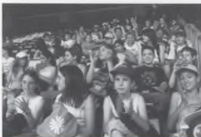
EL CAMP DEL BARÇA.