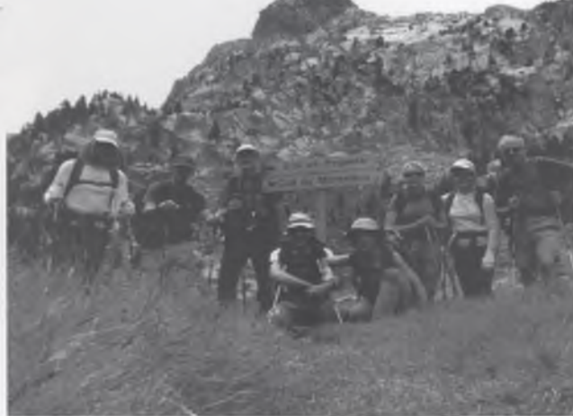
LA COLLA L'ISARD, DURANT LA TRAVESSA.

Etapa Amitges-Colomers (29 de juny): Passem pel costat del cim del Ratera i dos dels nostres hi pugem. Seguim per un camí suau cap al Saboredó i d'allà a fer nit a Colomers.