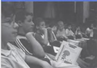
ANSEGUITS AL PARLAMENT DE CATALUNYA.

El divendres 16 de juny vam anar a Barcelona. Primer vam visitar el camp del Barça i vam poder veure la copa de la Champions i l'estadi. També vam visitar el Museu del Barça. Tot seguit vam anar al Parlament de Catalunya on ens van explicar la seva història, quan es va construir i quan s'hi va establir el Parlament. Tothom estava molt atafegat, ja que el diumenge se celebrava el referèndum sobre la modificació de l'Estatut d'Autonomia i hi havia un munt de càmeres, pantalles de TV i gent fent tota mena de preparatius. Tot i així, la visita va ser molt interessant i vam poder seure a les cadires dels diputats i diputades al Parlament.