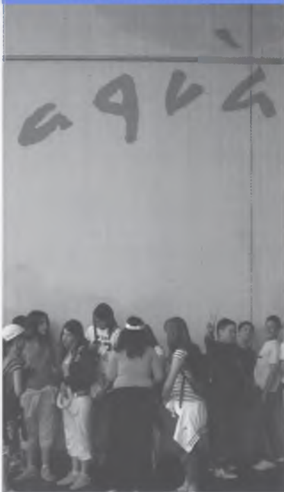
PREPARATS PER ENTRAR A L'AQUARIUM.

En acabar l'escola fem un viatge a les terres de Tarragona amb la finalitat de convidaure junts uns quants dies. En aquesta sortida vam veure moltes coses: l'Aquarium i l'Imax de Barcelona, el delta de l'Ebre, Penyíscola, la ciutat de Tarragona, Santes Creus. I també vam anar a Port Aventura, ja que no tot haurien de ser "pedres". Qui ha dit que la diversió no pot ser cultura...? La convivència fa que aquest dies tots es sentim bé i que aquest viatge sigui un bon comiat de l'escola que ens ha acollit durant aquests anys.