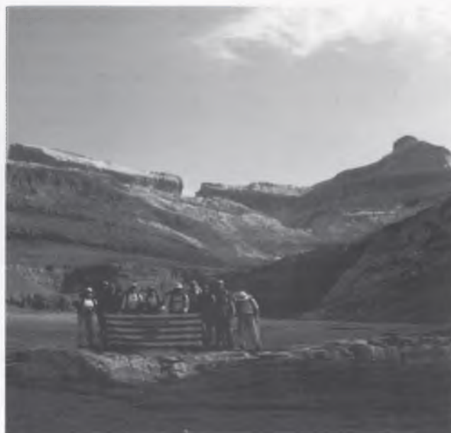
EL GRUP, A LA VALL D'ORDESA.

24 de Juliol: De Sarradets tornem a la Brecha i d'allà per la Plana de Narciso anem a trobar la Faja de las Flores. Aquest és un camí no apte per a gent amb vertigen, ja que són gairebé 3 quilòmetres de camí força estret, amb un penya-segat de 1.200 metres de desnivell. Baixem pel Circo de la Carriata cap a la pradera de Ordesa passant molta calor, i allà finalitzem la travessa.