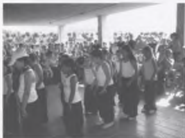
EXHIBICIÓ DE FUNKY.