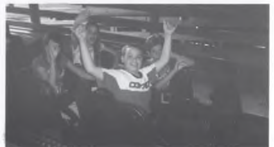
VIATGE A PORT AVENTURA.