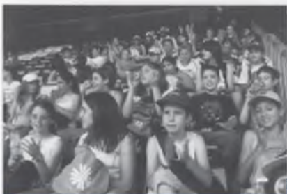
EL CAMP DEL BARÇA.