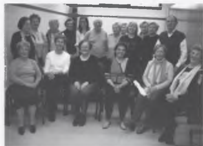
ELS PARTICIPANTS EN EL TALLER DEL RIURE.

També aquest darreres mesos el casal ha fet moltes activitats. Cal destacar el taller de riure, cosa bona per a tothom, i un taller de memòria, realitzats per l'empresa Jubilus. També es va fer una arrossada popular al Polivalent, on hi van assistir un centenar de persones i on després d'una paella molt bona feta per gent de Bescanó, es va poder ballar fins que el cos va aguantar.