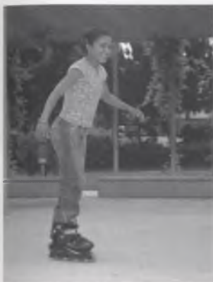
LA KHADI PATINANT (AQUEST ANY N'HA APRÈS FORÇA).