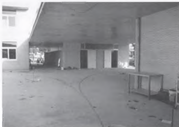
EL PORXO NOU PER PODER SORTIR A JUGAR ELS DIES DE PLUJA.