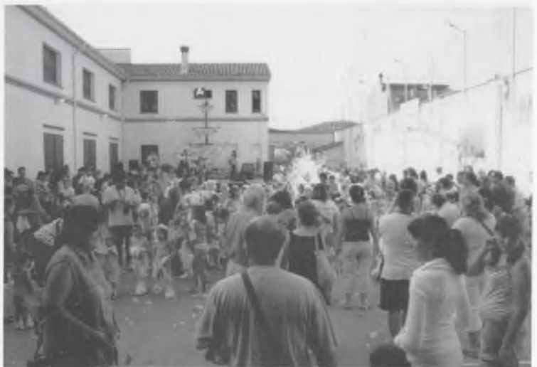
LA FESTA DE L'ESCUMA.