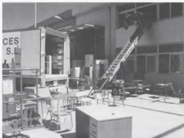
ARRIBA EL NOU MOBILIARI.

Entre tots ho vam aconseguir i el dia 12 de setembre a les nou del matí vam començar un nou curs escolar, ple d'il·lusió tot esperant l'acabament de les reformes i que, en començar el proper curs escolar 2008-09, tinguem una escola com els nostres nens i nenes es mereixen.