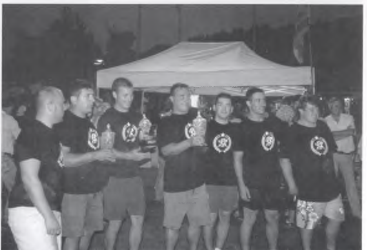
ELS GUANYADORS DEL BESCANONÍ DE FERRO.