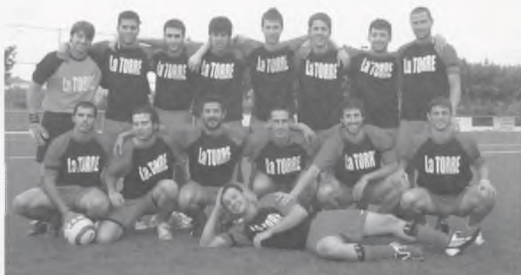
L'EQUIP DE FUTBOL 7, PATROCINAT PER LA TORRE.

La construcció de l'equipament va ser impulsada per l'Ajuntament de Bescanó, veient la necessitat de crear un espai lúdic i de lleure per al jovent. Des del març fins ara s'han dut a terme moltes activitats i us en resumim les més destacades.