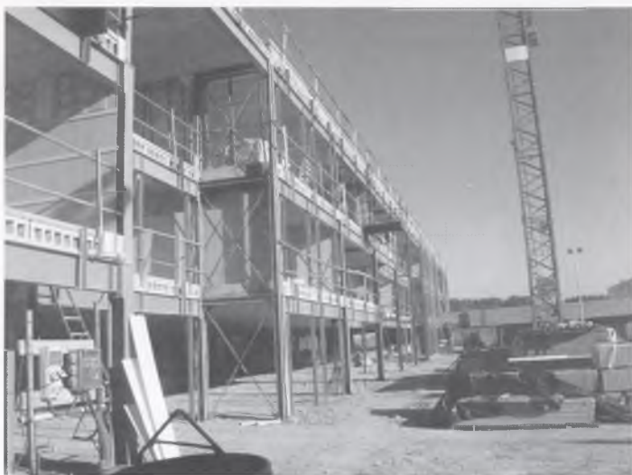
LES OBRES DEL NOU INSTITUT.

A més, l'IES Vallvera convida als pares i mares dels estudiants i a tothom qui estigui interessat a participar a l'escola de pares que tenim organitzada i que dirigeix la psicopedagoga del centre. Les convocatòries de les jornades les podreu trobar al web http://www.xtec.cat/iesvallvera , i també ens podeu fer arribar els vostres suggeriments al correu iesvallvera@xtec.cat .