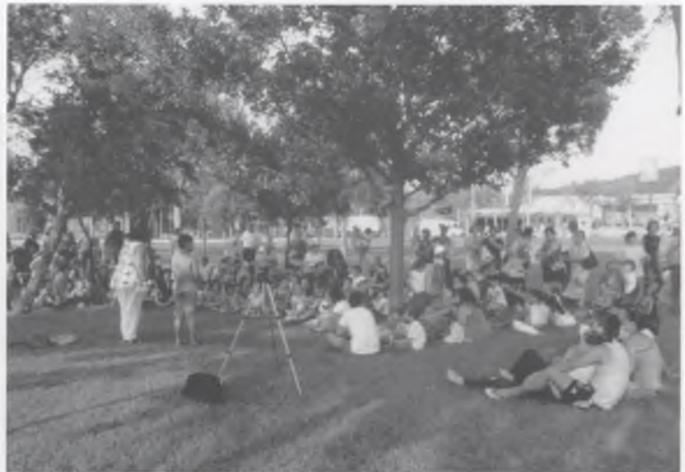
PETITS I GRANS VAN DIVERTIR-SE AMB ELS CONTES A LA FRESCA.

Moltes felicitats als joves, als grans i als menuts que van pujant i que han fet realitat aquesta Festa Major!