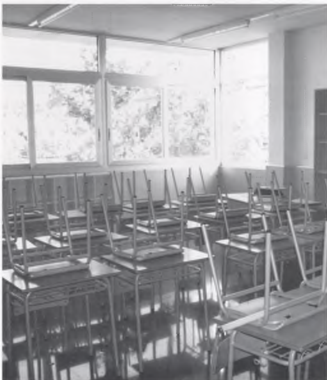
LES AULES NOVES QUE S'HAN CONSTRUÏT.