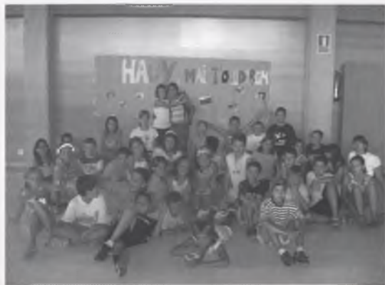
EL COMIAT SORPRESA QUE LI VAN FER AL JOVESTIU.