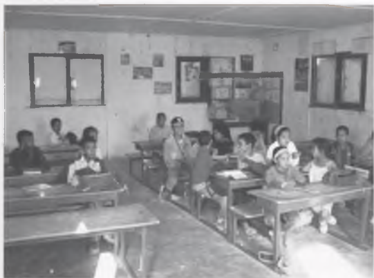
LA KHADI A LA SEVA MADRASSA (L'ESCOLA).

AQUEST ERA EL DESIG DE LA KHADI LA PRIMERA VEGADA QUE VA SORTIR DELS CAMPAMENTS SAHRAUÍS, UN DESIG QUE HA FET REALITAT A BESCANÓ