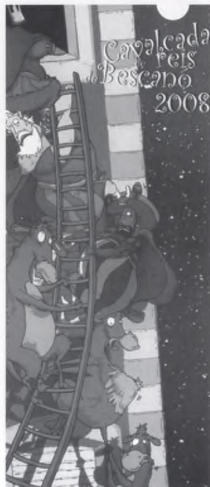
IL·LUSTRACIÓ : Carles Arbat