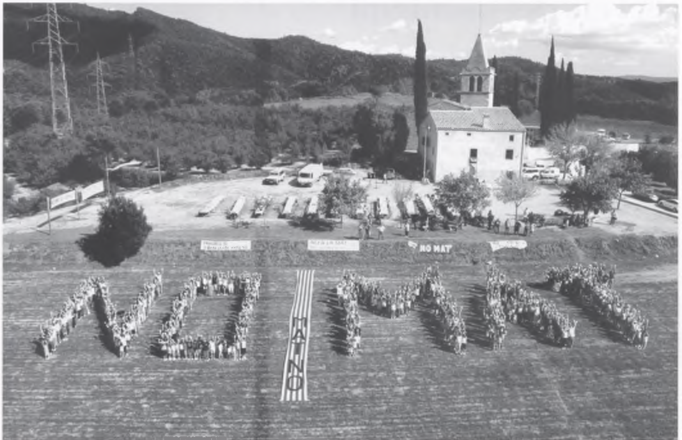
El 7 d'octubre Bescanó va tornar a dir NO a la MAT.