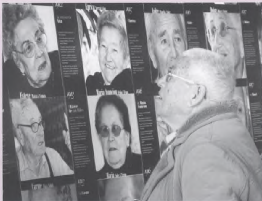
El dia de la presentació del llibre «Vides 1900-1927».