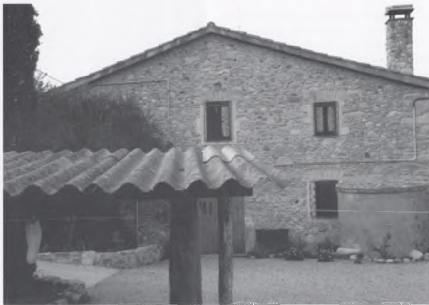
Can Coll de Vilanna.

El dia 17 de desembre passat, la Junta de Govern va aprovar inicialment el Pla especial urbanístic pel qual es cataloguen les masies i cases rurals del municipi de Bescanó.