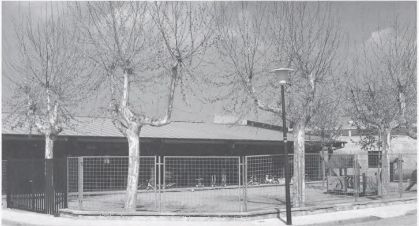
Escola Bressol de Bescanó.

Com aquell que no diu res, ja han passat les festes de Nadal. Això demostra clarament que el temps passa volant. Si no, pensem-hi fredament: quan tingueu a les mans La Pilastra ja farà un mes ben bo que el Nadal haurà passat.