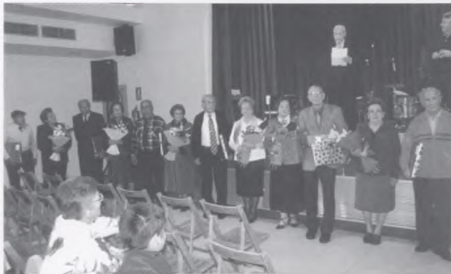
Reconeixement a les parelles que celebren 50 anys de casats.