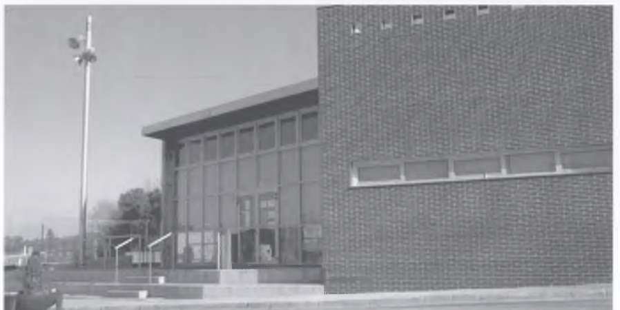
A la Sala de Joventut «La Torre» es construirà una cuina.

Els pressupostos del 2008 ajudaran al reequilibri territorial del municipi, ja que s'han tingut en compte els 4 pobles que formen Bescanó. Val a dir que l'equip de govern cataloga aquests pressupostos de prudents, ja que s'ha fet una previsió a la baixa tot esperant com respon l'economia davant els moviments actuals del sector de la construcció.