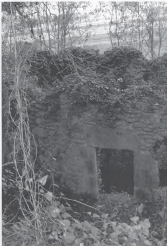
El Pou del Glaç de Vilanna.

• POU DEL GLAÇ: Projecte d'adequació de l'entorn natural del Pou de Glaç de Vilanna, gràcies al conveni entre