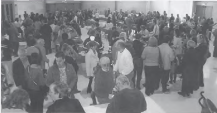
Molts van acostar-se a tastar els més de 50 plats elaborats amb bolets.