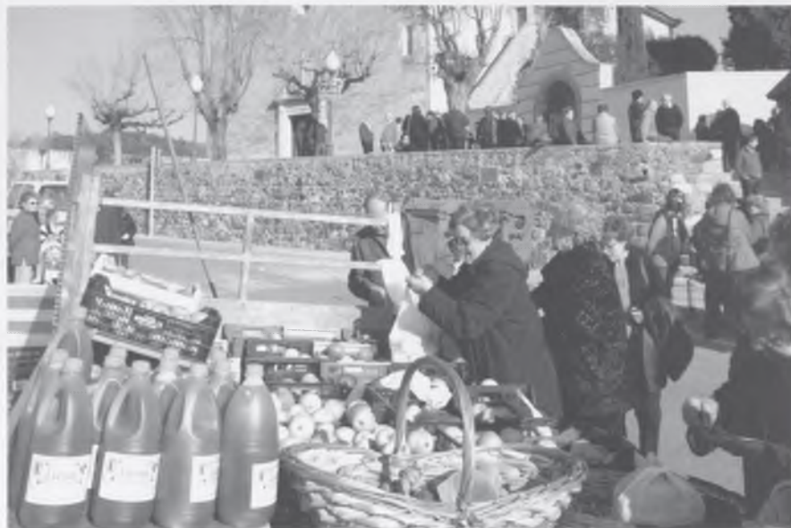
Dues instantànies de la Marxa i de la Festa.