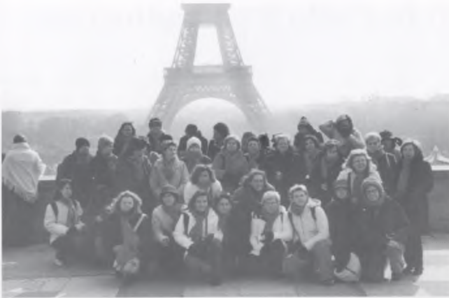
Algunes de les dones que van participar en el primer viatge del Dia de la Dona Treballadora a París, ara fa 4 anys.