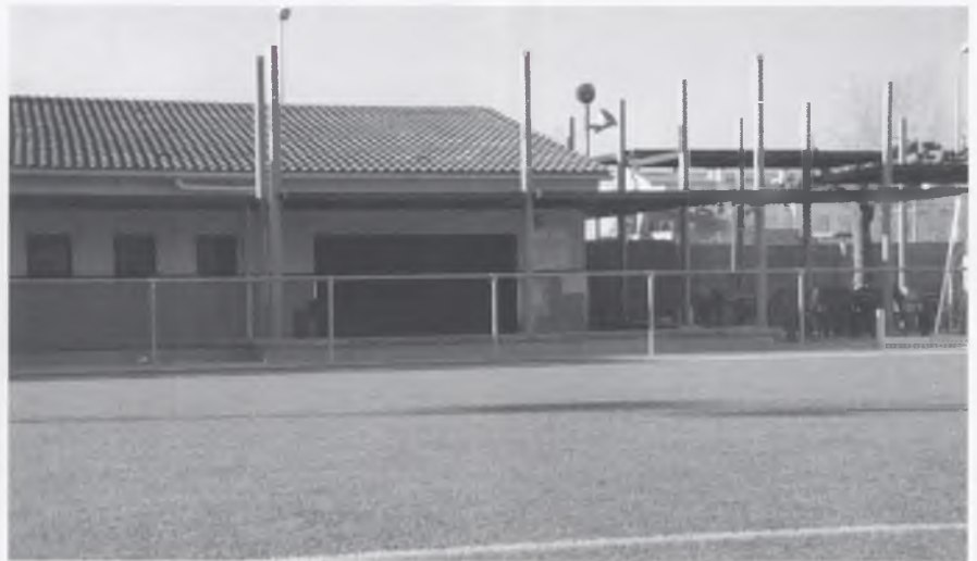
El bar del camp de futbol és un dels projectes per a aquest 2008.

L'Ajuntament de Bescanó destinarà aquest 2008, un total de 538.500 euros a diferents accions, dels quals uns 477.500 seran d'aportació municipal i la resta provindran de subvencions.