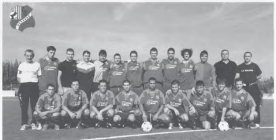
El primer equip del CE Bescanó.

Cal destacar la campanya de l'equip de 1a regional (situat molt amunt a la taula classificatòria) i també la de l'equip juvenil, que milita a primera divisió (es troba entre els sis primers classificats). Fem esment d'aquests dos grups per la dificultat que representa per a un equip de poble,