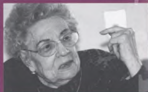
Selecció d'algunes de les imatges que podeu trobar en el llibre