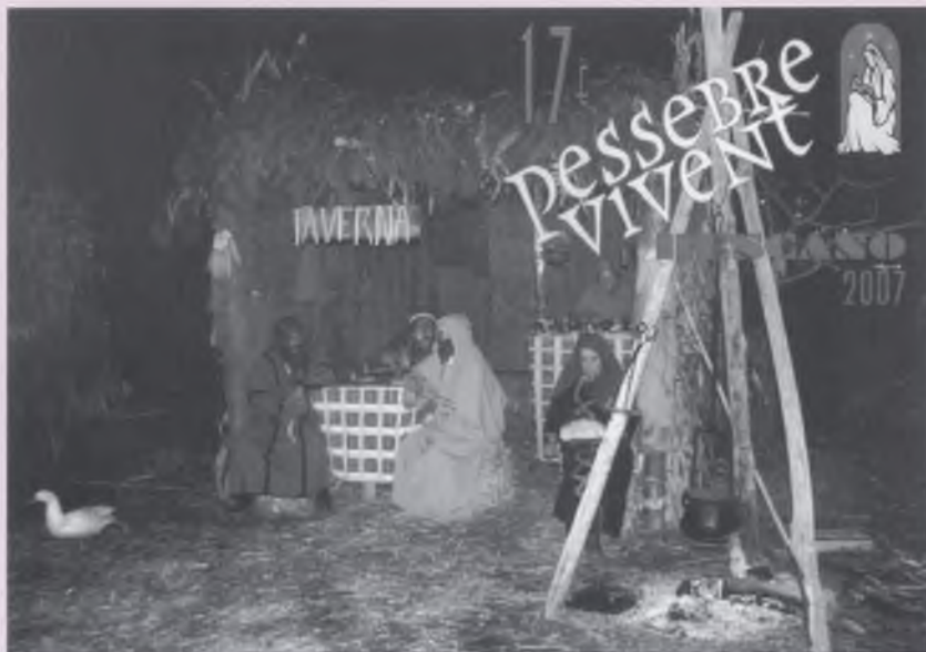
Una de les estampes típiques del Pessebre Vivent de Bescanó.

Unes 2.000 persones van acostar-se fins a Bescanó els dies 26 i 30 de desembre i 1 de gener passats. Totes elles van poder reviuir un dia a les tavernes, passejar-se entre romans, participar del naixement de Jesús o moure's entre bestiar i nadeses per totes bandes. I és que estem parlant del nostre Pessebre Vivent, que enguany ha arribat a la seva 17a edició i es consolida com un dels pessebres més visitats de les terres gironines.