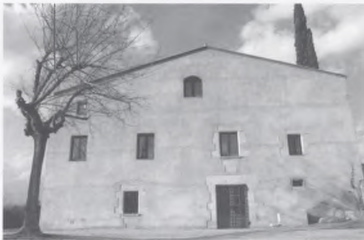
La rectoria de Vilanna, reformada.

l'espai per dormir, els serveis i la cuina amb el mobiliari existent, inclosos els fogons per escalfar el menjar. Tot per gaudir d'una bona estada. Aquesta, però, ha de tenir una durada màxima d'1 nit i 2 dies.