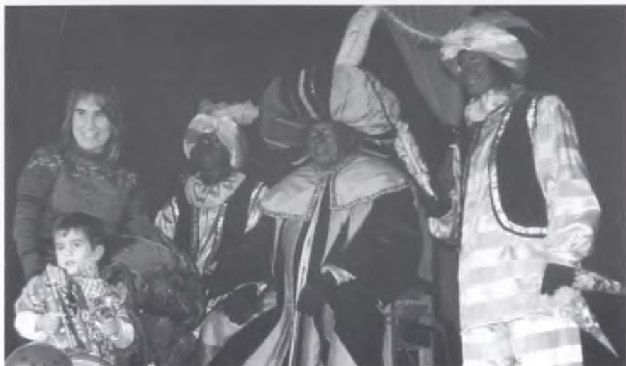
Els Reis van fer les delícies dels més petits.

Ara bé, la tasca de Ses Majestats no va acabar aquí. L'endemà, mentre tots els de la casa obrien els seus regals, els Tres Reis d'Orient van anar a repartir obsequis als avis de la Residència Santa Anna de Bescanó, de la Llar Infantil Nostra Senyora de la Misericòrdia i del Geriàtric Puig d'en Roca. Perquè el Nadal i els Reis no són només cosa dels més petits. Ara només queda esperar que tornin a passar ràpid aquests mesos per així tornar a gaudir dels quilos de màgia, dels paquets plens de somriures i dels sacs a vessar d'il·lusió... Fins al moment, porteu-vos bé!