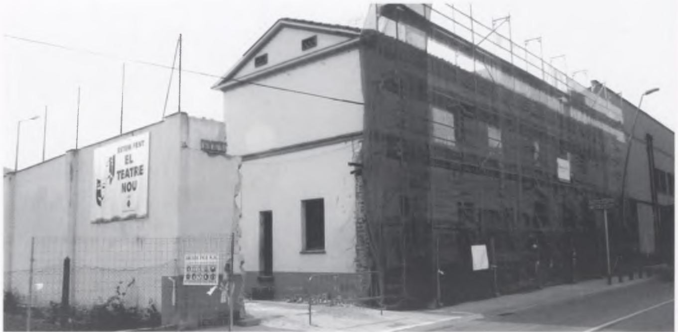
El teatre municipal, en obres per tal de reconstruir-lo.