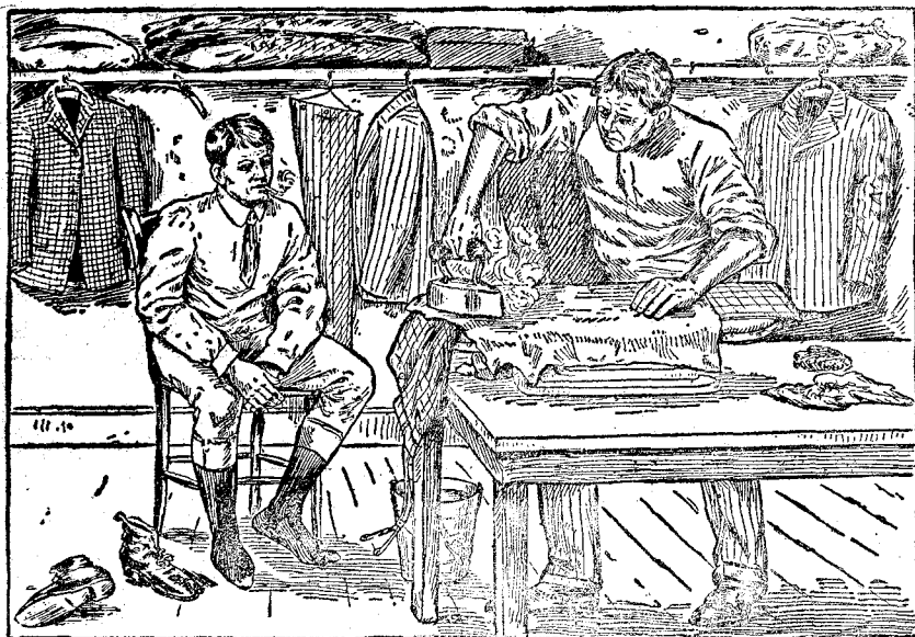
En otro establecimiento.—Esperando mientras se plancha (sudando).

Nuestro sistema de planchar es el único método higiénico conocido hasta la fecha, quedando los vestidos como nuevos.