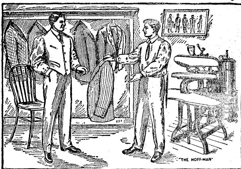
Nuestro establecimiento.—Planchado a los cinco minutos.

Todos los vestidos son repasados y recosidos antes de su entrega.