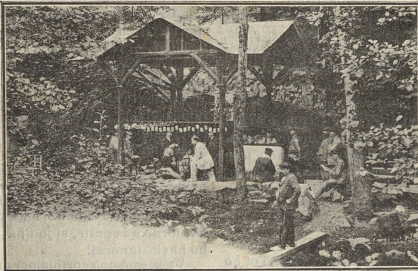
La célebre Font-Picant

Nombre solt, 0·20 ptes. Temporada, 3·00 »