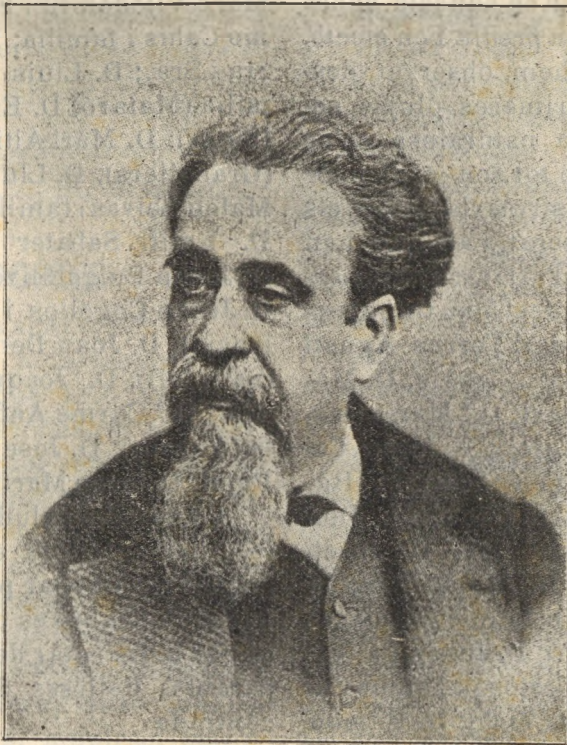
Frederic Soler Hubert (Pitarra)