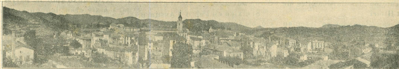
SANT HILARI SACALM