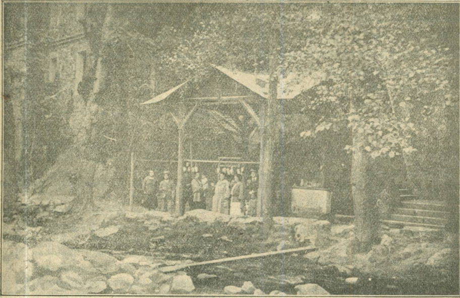
LA JOIA DE NOSTRA VILA