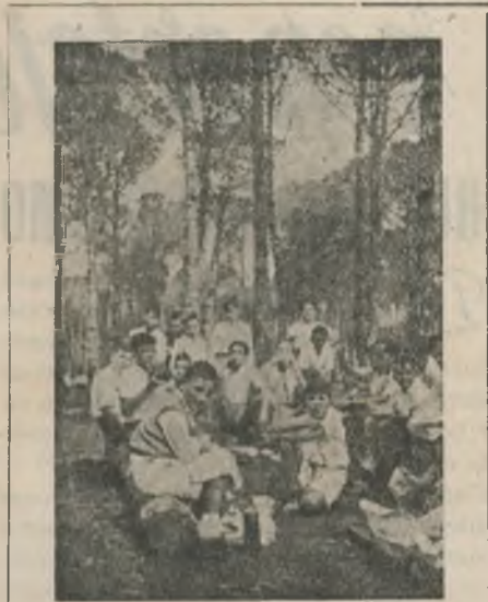
Aire libre y alegría son siempre el marco del «Día del Aspirante»

Y señalaremos, por último, que los decididos Aspirantes de las comarcas de Gerona y San Feliu de Guixols, no han querido quedarse atrás en este verano y, prescindiendo del termómetro, han celebrado brillantemente, el día 13, en Llagostera, su V Dia Comarcal del Aspirante .