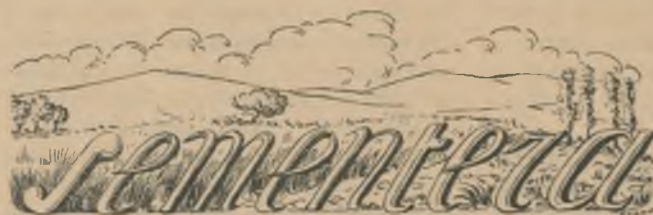
(Uno que vive en el campo, escribe para los agricultores)

UN reloj de sol hallamos pintado en casi todas nuestras «masías», con más o menos arte, el cual, con la regularidad inflexible del astro rey, rige la vida de los payeses. de tal manera que casi todos ellos han sabido prescindir de la artificiosa hora oficial inventada en estos tiempos modernos. ¡Ojalá hubiesen sabido prescindir de otros defectos, en especial el egoísmo, plaga de la humanidad presente!