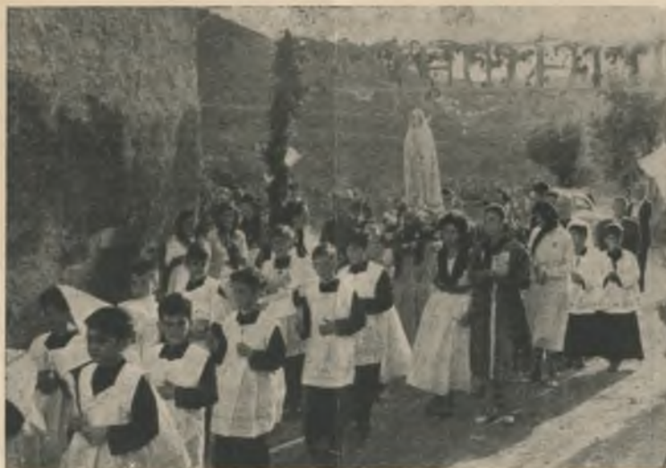
La imagen de la Virgen de Fátima en Colera. — El cortejo llansanense

VERANEANTES — Han pasado unos días entre nosotros el