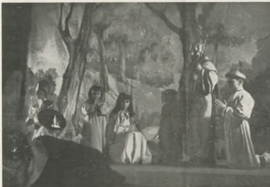
Dos momentos de la representación de los «Pastorets» por los escolares, que consiguieron crear un auténtico clima navideño en nuestra población