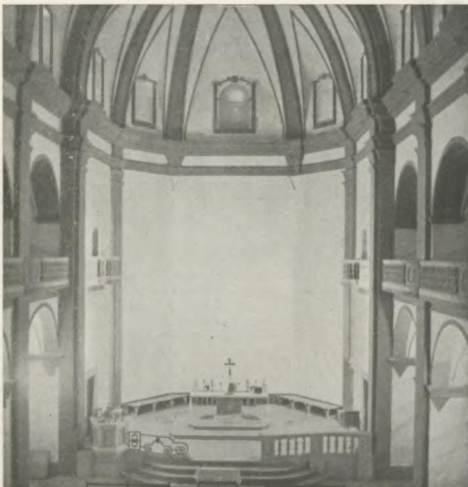
Perspectiva de la Iglesia Parroquial, ya pintada.

Obediente a la prudencia, opino que precisamente al bloc referido pertenecen los datos que pudieran tomarse de aquella reunión y tan sólo me permito mencionar algún detalle suelto que pudo quedar al margen.