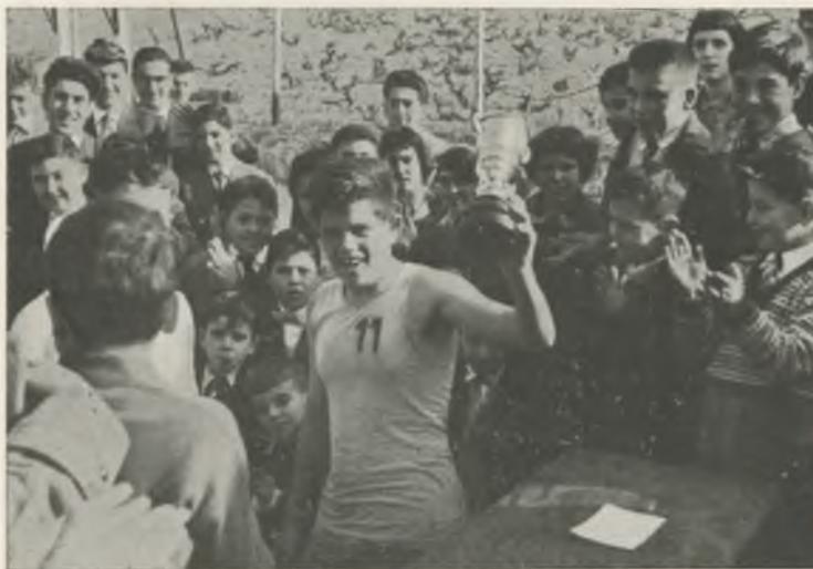
Por la mínima diferencia -37 a 36- el «C.B. Grifeu» ha ganado el «Título del Hostal de Grifeu 1958». Carriga el infatigable capitán lo muestra al sonriente público, que tanto alentó al equipo.

Dignos de loa son los esfuerzos que hace el Estado con la repoblación y sólo plácemes merece la labor callada de muchos propietarios plantando extensiones que hasta ahora sólo producen