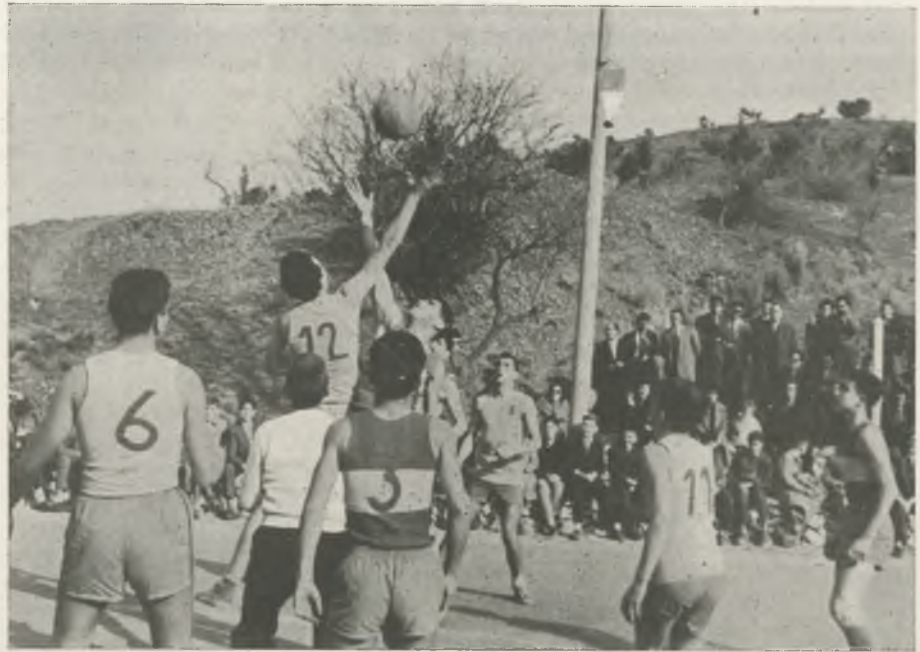
Un salto entre dos del partido La Salle de Figueras contra C. B. Grifeu de Llansá, en el que el amarillo n.º 12 -Iter- controlará la pelota. Es una muestra del inteligente y eficaz juego que este muchacho realizó durante todo el partido.

¡CÓMO TIEMBLAN LOS PINARES!... — Triunfador en toda la línea en Italia y casi en Francia, ha pasado los Pirineos tomando carta de naturaleza entre nos-