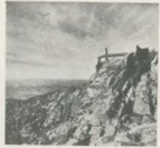
Ermita de San Onofre, a medio camino de San Pedro de Roda. Todos los años suben en romería los pueblos de la comarca, encabezados por Palau-saverdera.

estaremos más cerca de San Pedro de Roda