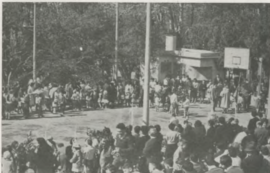
«Els Ametllers» ha sido escenario de bellas acciones, como la Bendición de Ramos.