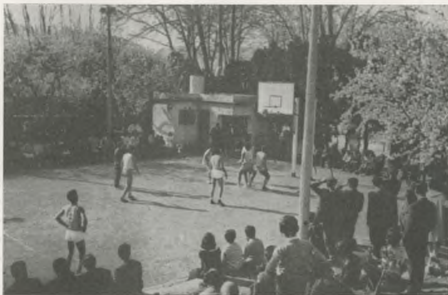
Con este almendro en flor, el campo tuvo momentos de gran atractivo.