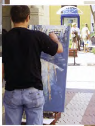
Participant del Concurs de Pintura Ràpida