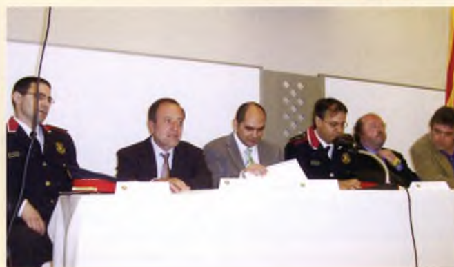
Celebració del Dia de les Esquadres, al Monestir