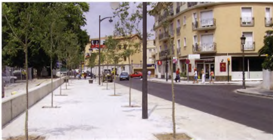
Nou aspecte dels carrers Callao i Enamorats