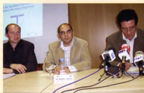
Presentació del Pla de Qualitat en Destí, a les dependències de l'Arxiu Municipal