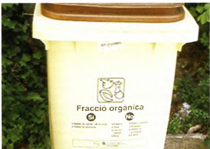
El cubell marró, característic de la recollida de la fracció orgànica

sorrencs, caracteritzats per la sequedat, la inestabilitat del sòl i la salinitat causada per la proximitat del mar, hi creixen un seguit de plantes molt singulars adaptades a viure en aquestes condicions. Les dunes són uns ecosistemes que en general han anat desapareixent sota la pressió turística i urbanística a la majoria de platges del litoral català. Actualment, atesa la seva importància ecològica i paisatgística, convé preservar les que resten.