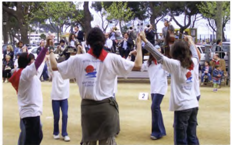
Mostra infantil de sardana, a l'abril del 2005