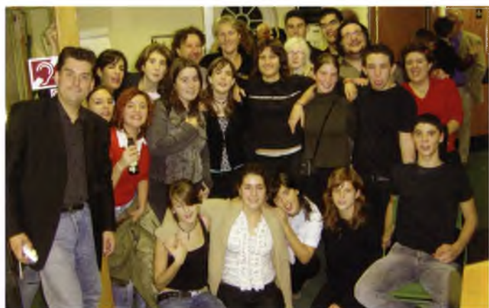
La delegació guixolenc a East Grinstead

El musical The West End Club , que narra la història d'un petit cabaret situat al cor del West End de Londres, va donar inici a la Primera Mostra Estable de Teatre Amateur de Sant Feliu. L'obra va ser portada a terme per la companyia Filagarsa, de Molins de Rei, i repassava fragments dels musicals més emblemàtics dels teatres londinencs.