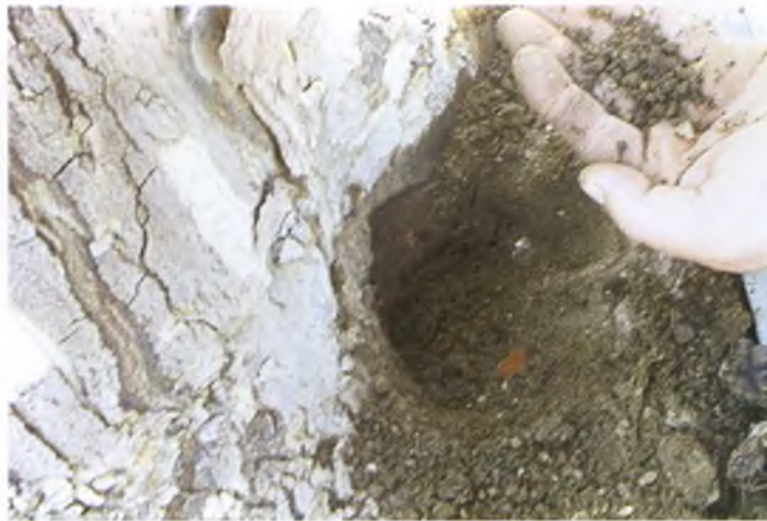
Els tècnics mostren restes de sal i altres materials usats contra els plàtans

La idea consistia en la construcció d'un camí de ronda en cinc trams, no agressiu amb l'entorn, no visible pràcticament des del mar, i molt integrat amb el medi. També tenia en compte criteris d'accessibilitat.