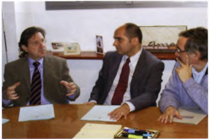
Moment de la signatura del conveni per implantar el viver d'empreses