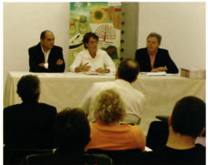
Moment de la presentació dels cursos