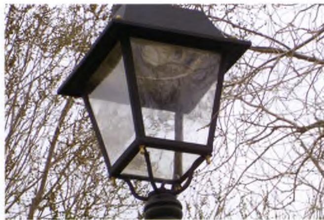
Un dels nous fanals del parc, amb protector anticonaminació lumínica