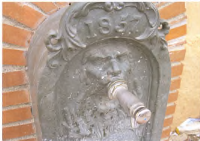
Una de les fonts que hi ha a la Ciutat

El 9 de juny es va inaugurar i va restar oberta fins al 3 de juliol La Caja de Ahorros del Mediterráneo (CAM) s'unien a les celebracions del IV Centenari de la publicació de "El ingenioso Hidalgo Don Quijote de la Mancha" amb la presentació d'una exposició, que des del passat mes d'abril feia un llarg recorregut per tot Catalunya. A Sant Feliu es van fer més actes en honor del Quixot.