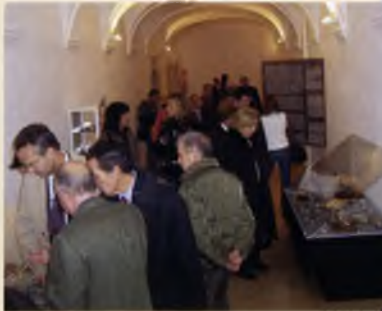
Inauguració de la Nit dels Metges i de l'exposició permanent del Museu dedicada al Metge Rural. Va comptar amb la presència de la consellera de Salut, Marina Geli