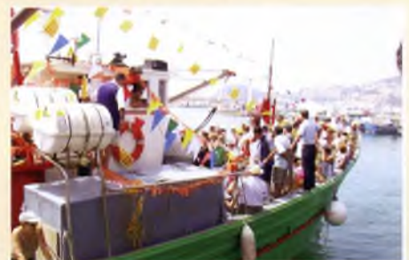
Festivitat de la Mare de Déu del Carme, novament un èxit de convocatòria