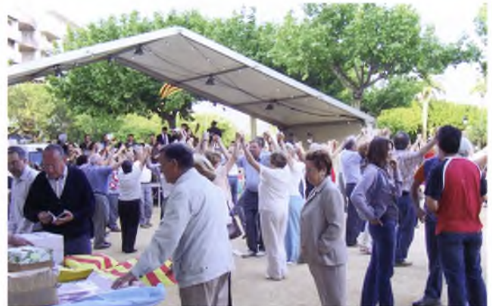
Aplec de la Sardana, al maig de 2005