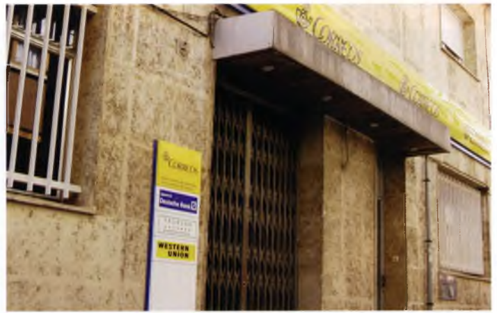
L'edifici de Correus, en una imatge recent

Un any més es va celebrar el tradicional Aplec de Pedralta, que incloïa, com en d'altres ocasions, un concurs de plantes i flors al matí, un concurs d'allioli i diferents actes a la tarda, com cantades d'havaneres i sardanes.