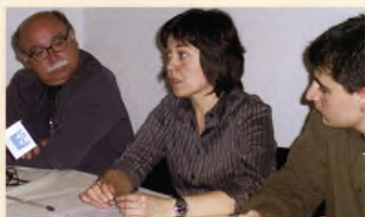
Presentació del Pla director del Monestir, un document estratègic per definir el futur de l'espai amb millores d'accessibilitat amb un ascensor interior, i propostes d'usos, entre altres aspectes com la reforma de les sales del Museu.