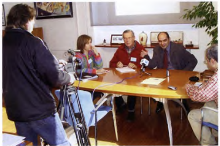
Presentació als mitjans de comunicació dels principals objectius proposats en el Congrés.

L'Ajuntament de Sant Feliu de Guíxols va demanar a la Generalitat de Catalunya, com a responsable de les obres d'ampliació del pont de la variant de Santa Cristina d'Aro, que posés molts més senyals que advertissin que el giratori d'enllaç amb la variant estava tallat per obres al febrer de 2005. La carretera que enllaça amb aquest giratori esdevé la principal entrada i sortida de Sant Feliu de Guíxols, i la via preferent per dirigir-se cap a Girona o Barcelona. L'Ajuntament va detectar nombrosos punts sense senyalitzar, especialment a dins del terme de Sant Feliu, en els llocs propers al punt tallat. Això provocava que molts usuaris haguessin de recórrer distàncies superiors als tres quilòmetres i mig fins que trobaven la via correcta.