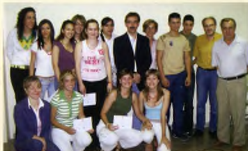
Premiats a l'IES Sant Feliu pel Departament de Comerç