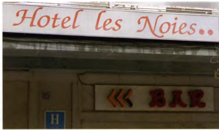
Un dels hotels de la família Anlló. A l'esquerra, la façana de l'antic hospital, que s'apunta com a seu de l'espai d'art.