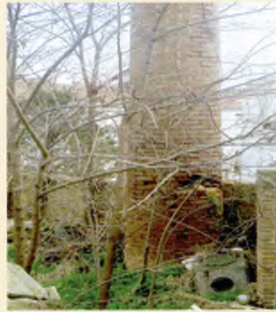
L'abans i el després de les obres de rehabilitació

L'últim dia de la celebració, el 9 d'abril, es va programar la tercera Marxa Popular amb una cinquantena d'inscrits, una exhibició d'aeròbic infantil i ciclo-indoor. També es va realitzar una exhibició de dansa del ventre, junt amb exhibicions de balls de saló i caribenys.