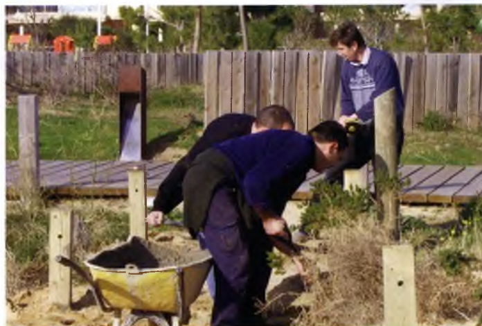
Les dunes es van protegir amb cordes i es van marcar itineraris per voltants per evitar que fossin trepitjades o malmenades.

L'espai web de l'Ajuntament de Sant Feliu de Guíxols ( www.guixols.net , ara ".cat") va registrar el seu rècord de visites anual. Un cop tancat l'exercici de 2004, l'estadística de visites de la pàgina web municipal va registrar un total de 165.575 visites en tot l'any. Aquesta xifra significava un 26,8% més que l'any anterior (130.464 visites). La web adaptada específicament per a minusvalids visuals ( www.guixols.info ) va assolir la xifra de 18.251 visites l'any 2004. El període més visitat del web municipal comprèn a l'estiu, els mesos de juny, juliol i agost, especialment el juliol, que s'emportava el nombre més alt de visites de tot el 2004. L'atracció de Sant Feliu com a destí turístic, la demanda de detalls via web sobre la Ciutat i la informació online del Festival Internacional de la Porta Ferrada podien ser algunes causes de l'increment.