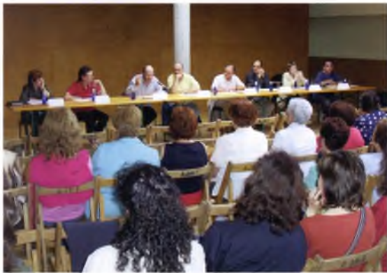
Debat a l'Escola d'Adults