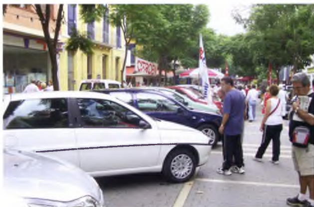
Fira Autocasió, al Setembre, mes tradicional de fires a Sant Feliu.