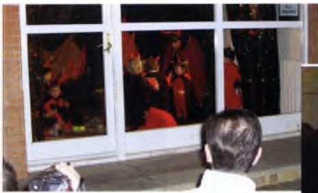
Quadres nadalencs al Centre 0-3