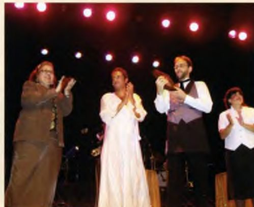
A l'octubre s'iniciava la 1a Mostra Estable de Teatre Amateur de Sant Feliu de Guíxols, organitzada per l'Ajuntament amb el suport de l'Agrupació Teatral Benet Escriba. A la imatge es veu el final de la primera representació.