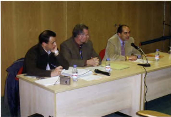
Moment del Consell Escolar Municipal