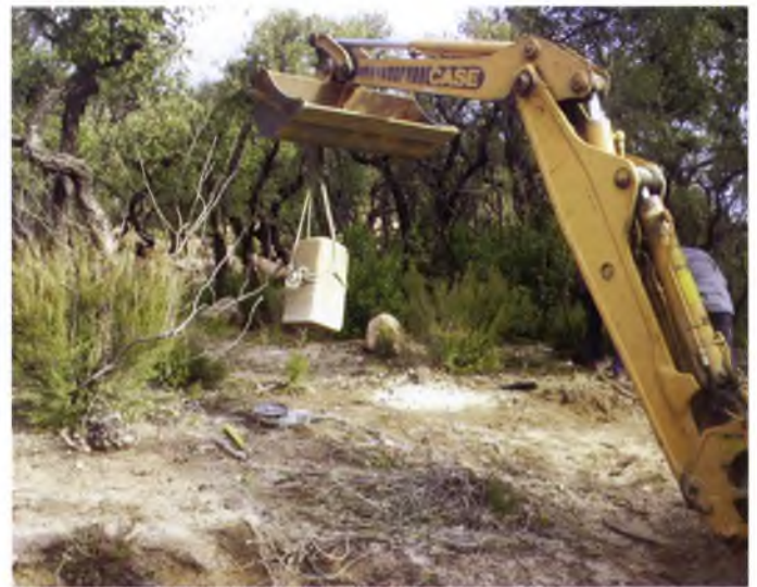
Treballs de recol·locació de la fita

En total, es van servir fins a 350 quilos de 'brunyols' durant la campanya. Des de Turisme, impulsora de la mateixa, s'aposta per aquesta fira per donar una alternativa durant la Setmana Santa per als residents o visitants de la Ciutat. La imatge correspon a l'edició de l'any anterior.