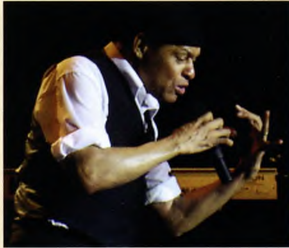
A la imatge gran, el cantant nord-americà Al Jarreau. A sobre, espai escènic de la Porta Ferrada. A la dreta, Joan Manuel Serrat a Sant Feliu de Guíxols

Tots els grups de l'Ajuntament de Sant Feliu de Guíxols es van mostrar favorables a un text que donava suport a la Confraria de Pescadors de Sant Feliu de Guíxols (adscrita a Giropesca), en el litigi que mantenia des de feia dies amb els majoristes de peix. Els grups municipals de CiU, el Partit dels Socialistes, el grup de Tots per Sant Feliu, el Grup Municipal d'Iniciativa per Catalunya Verds-Esquerra Alternativa i el Grup Municipal d'Esquerra Republicana de Catalunya (aquest últim no present al plenari però va manifestar suport a la proposta) van signat un document de suport a Giropesca, associació formada per les confraries de Blanes, Sant Feliu de Guíxols, Palamós, i l'Escala.