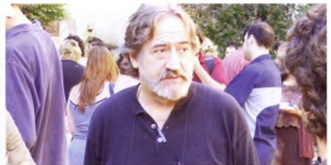
Una imatge de les classes de Música Antiga amb Jordi Savall

Sant Feliu de Guíxols va celebrar, un any més, la Diada Nacional de Catalunya, amb l'homenatge al referent polític històric més destacat i rellevant de la Ciutat, el president de la Generalitat a l'exili, Josep Irla i Bosch. Al davant de la seva tomba es va fer, a les deu del matí, l'ofrena floral institucional de l'Ajuntament, que comptava amb els representants de les formacions que hi ha al consistori. A banda, els diferents grups polítics i els seus seguidors van homenatjar la figura d'Irla, tant abans com després de l'acte 'oficial' de la Diada.