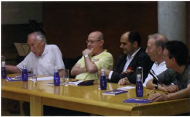
Presentació de l'edició de 'Per una clavellina' confeccionada per l'Escola d'Adults