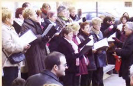
La Mostra de Corals, novament un nou èxit de públic