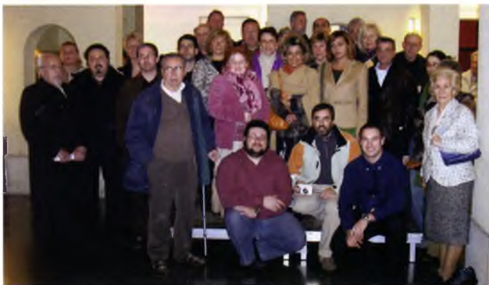
Foto de família dels artistes durant la presentació d'Art 2005, al Pati de l'Ajuntament