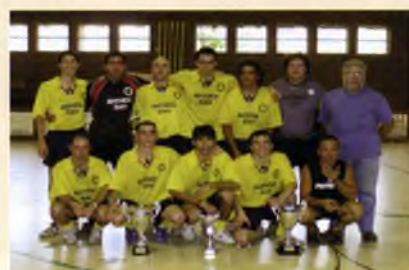
L'equip de futbol sala Avenida Bar va quedar Campió de Catalunya