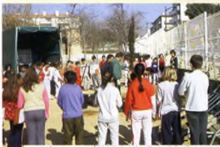
Diverses imatges de la Festa de l'Arbre, que es va celebrar al març