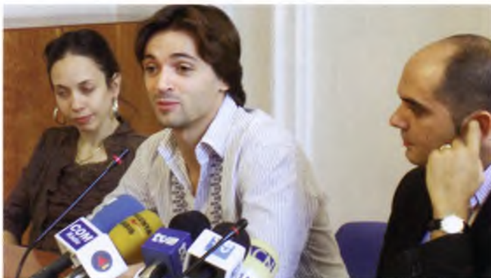
Imatge de la roda de premsa a l'Ajuntament de Sant Feliu