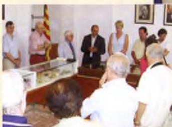
Presentació d'una nova edició de la Mostra Filatèlica, celebrada a l'Ajuntament