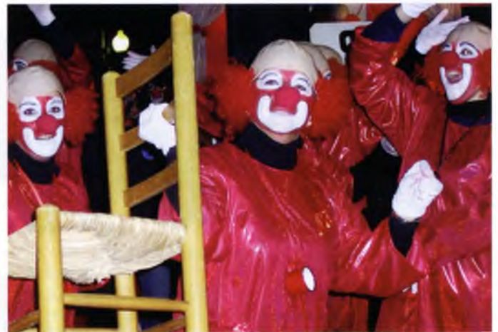
Imatge de la Rua del divendres 4 de febrer de 2005

La consellera de Cultura, Caterina Mieras, va exposar en una sessió informativa al Parlament de Catalunya que aspirava a tenir, en un màxim de dos anys, un acord a tres bandes entre el Departament de Cultura, l'Ajuntament i la Diputació de Girona per la creació de l'espai de pintura contemporània Carmen Thyssen. Mieras va indicar que l'equipament cultural "ha de tenir una vocació supramunicipal" i no va precisar l'indret on s'havia d'ubicar.