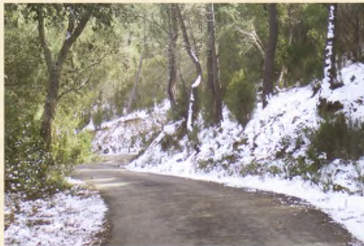
La nevada del febrer del 2005 va deixar emblanquinats carrers i accessos, com la carretera de Pedralta