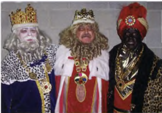
Els tres Reis Mags van portar il·lusió la nit del 5 de gener del 2005