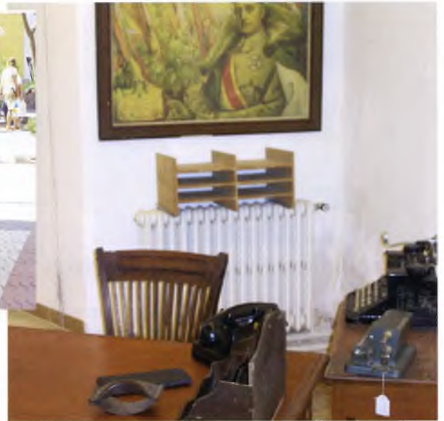
Una de les sales del Monestir que recreaven l'esperit i els moments viscuts durant la postguerra i el franquisme.