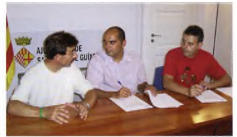
Signatura del Pla de dinamització comercial