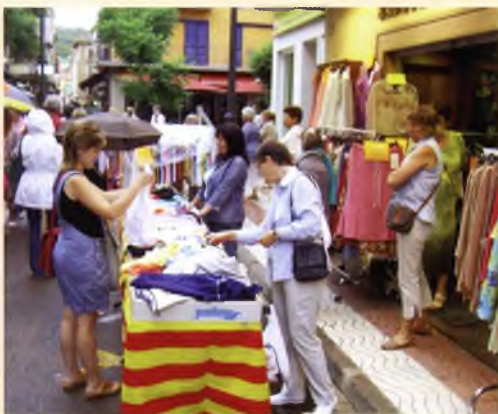
Un moment de les rebaixes d'agost, que van ser passades momentàniament per aigua. Els comerciants no van perdre les energies.

Les noves tarifes sota taxímetre van ser operatives a mitjans d'agost, es van aprovar el 26 de maig de 2005 per Ple Municipal, i la Comissió de Preus de Catalunya.