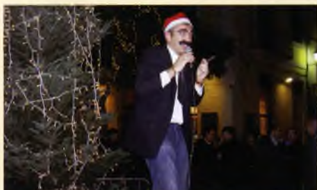
Festa de l'encesa de llums de Nadal, a la Rambla Vidal