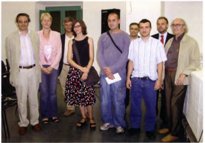
Els premiats de la Biennial Josep Amat

La policia local de Sant Feliu de Guíxols va recollir un dofi mort que el corrent marítim arrossegava cap a la platja de Sant Pol, en el seu extrem sud. Abans de fer cap altre procediment, els agents de la policia local es van posar en contacte amb Centre de Recuperació d'Animals Marítics i van informar als responsables d'aquest organisme. Després de constatar que l'animal portava un temps ja mort (tenia la cua rosegada i es trobava en un estat de descomposició avançat), es va procedir, d'acord amb les instruccions del CRAM, a retirar l'animal de l'aigua, després de fer-li nombroses fotografies de diferents parts del cos.