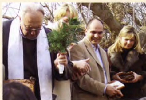
Festivitat de Sant Antoni Abat