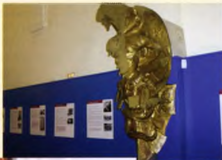
L'Àrea de Cultura va encarregar la restauració del Drac, ara al Monestir