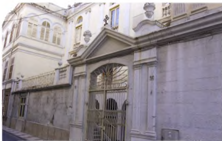
La façana de l'antic hospital. Lloc que ha d'ocupar el futur espai d'art