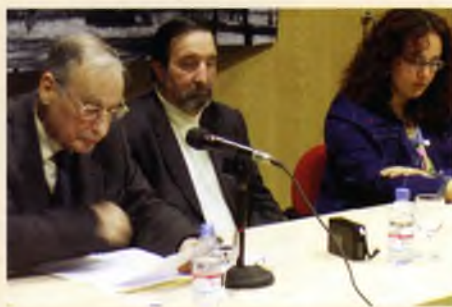
Imatge de les Jornades del GREF (Grup de Recerca de l'Època Franquista), sota el tema de la repressió franquista i el paper de l'església.