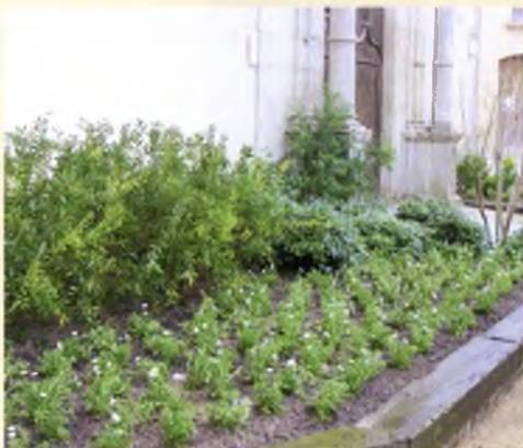
A l'octubre es va procurar arreglar i millorar jardins i parterres de diferents llocs de la Ciutat, com al Monestir