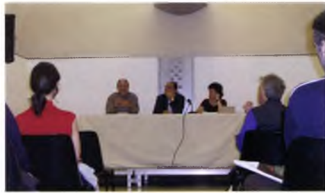
Presentació del postgrau 'Art, coneixement i realitat', al Monestir