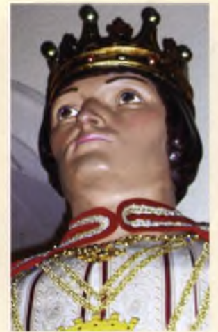
Els gegants de Sant Feliu. Angelina i Feliu