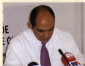
A l'abril, l'alcalde va presentar el Pressupost 2005, aprovat amb els vots del Govern municipal. El pressupost pujava a 22.927.744 euros, amb 3 milions d'euros destinats a la inversió.