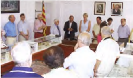
Inauguració de l'exposició filatèlica