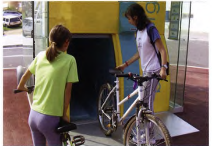
Biceberg, una nova forma d'aparcar la bici a Sant Feliu