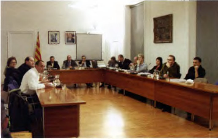
Ple municipal del novembre, corresponent a l'aprovació provisional del POUM