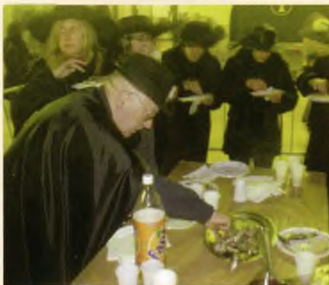
Imatge del moment de l'enterrament de la Sardina del Carnaval 2005