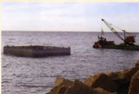
Col·locació dels protectors al Port