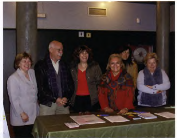
Els membres de l'entitat EMAD, durant el concert de Nadal