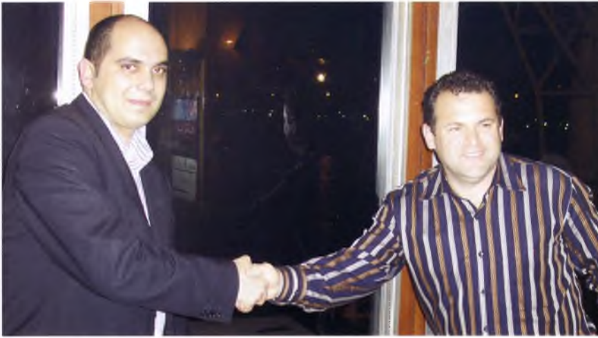
Imatge de l'acord entre els responsables del Mundalet i l'Ajuntament