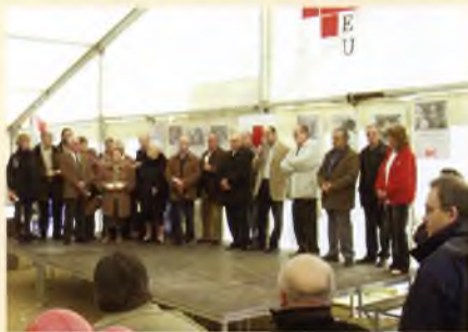
Diada de la Creu Roja, on es van homenatjar els socis més antics de l'entitat, entre altres activitats.