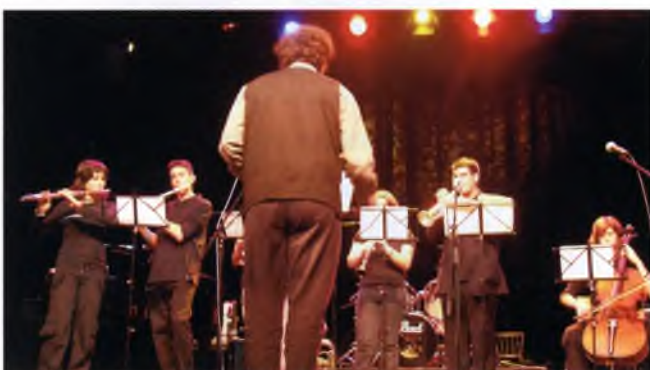
Alumnes de l'Escola de Música a East Grinstead (sud est de Londres), ciutat agermanada.