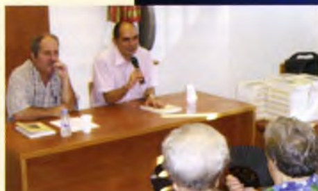
Presentació del llibre sobre l'antic hospital, obra de l'historiador Miquel Borrell