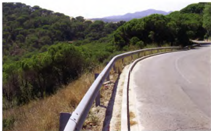
Imatge del vial on es vol construir el mirador