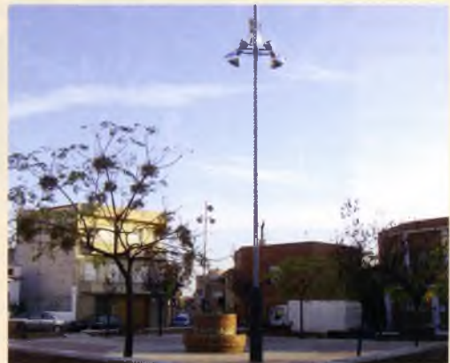
Fanals a la plaça Gaziol. L'Ajuntament va instal·lar dos nous sistemes de focus a la plaça Gaziol, que reforçaven i milloraven, de forma substancial, la lluminositat nocturna.