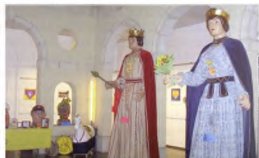
Cinquanta Anys de Gegants