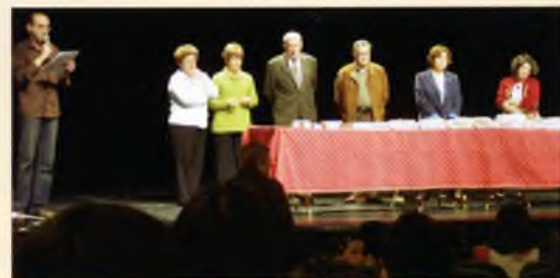
La imatge correspon a la Diada de Sant Jordi, als premis que es concedeixen als escolars al Teatre Municipal. A sota, un moment de la celebració de la Diada, amb la rambla Vidal plena de gent i de llibres.

En la data d'inauguració els ciclistes van agafar aigua de mar de Sant Feliu amb la intenció de fer el recorregut i portar-la fins al Santuari de Núria.