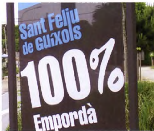
Un dels rètols de la nova campanya