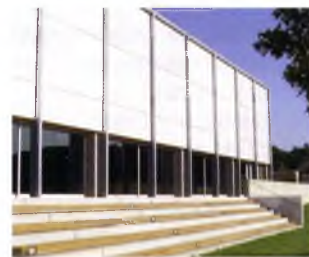
Moment de la inauguració del nou pavelló i imatges de la instal·lació

El nou pavelló era el segon de Sant Feliu. L'obra l'havia finançat bàsicament l'Ajuntament, amb un 70% del cost, amb aportacions en forma d'ajuda de la Generalitat i la Diputació de Girona. El pavelló disposa d'una pista de 1260 metres quadrats, que permet ser dividida en dues subpistes.