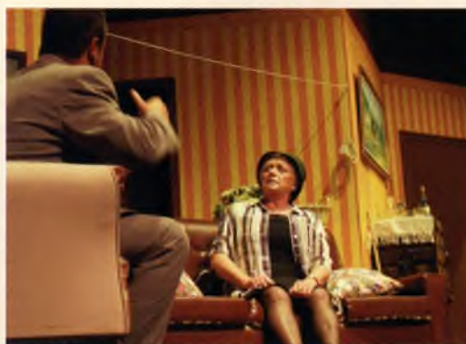
Representació, al mes d'agost, de 'Ninette i un senyor de Múrcia', a càrrec de l'Agrupació Teatral Benet Escriba, una mostra de la vitalitat cultural de les entitats guixolenques.

L'autocar de "Tots.es" va venir a Sant Feliu per difondre i fomentar Internet. La campanya "Tots.es", encaminada a aconseguir la implicació de la ciutadania en el coneixement de les noves tecnologies (i en especial de la xarxa internet) va tornar a ser a Sant Feliu de Guíxols. En aquesta ocasió es va desplaçar fins a la Ciutat l'Aula Itinerant Mòbil, un autobús de la campanya, ubicat al Passeig.