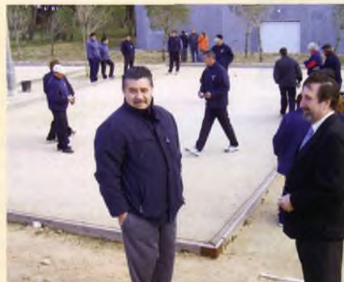
Imatge del Campionat de Petanca, celebrat a les instal.lacions situades a Vilartagues