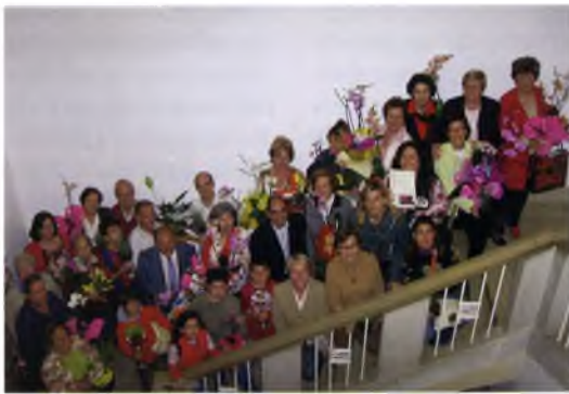
Premiats i premiades al concurs-exhibició de flors