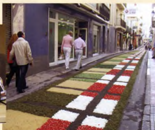
El carrer d'Espèciers, decorat pels veïns amb una catifa de flors impressionant