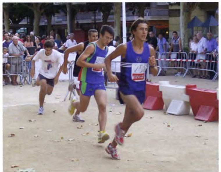
Una imatge de la Milla Urbana, celebrada a l'agost del 2005