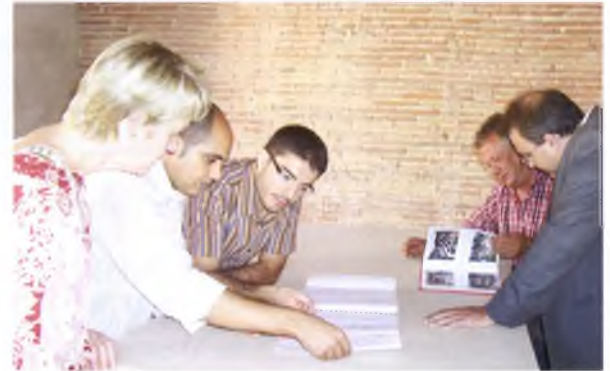
Visita de l'estat de les obres de rehabilitació de l'edifici de l'Horta d'en Palet