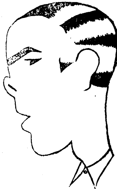
Es xato, però és eixerit

Nenita Andorrà i C. a : Us queda molt ben dissimulat el truc aquest.