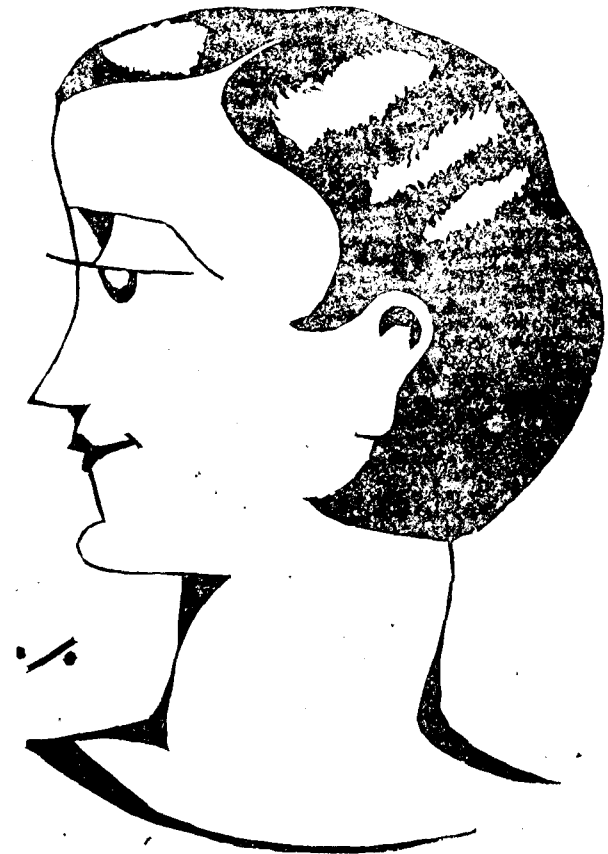
Es una odalisca o una vampireca?

Ahir va complir 15 anys la simpàtica «Miss Taire.» Va rebre moltes felicitacions.