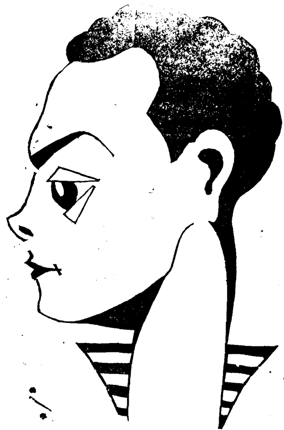
Un elegant star del cinema olotí.