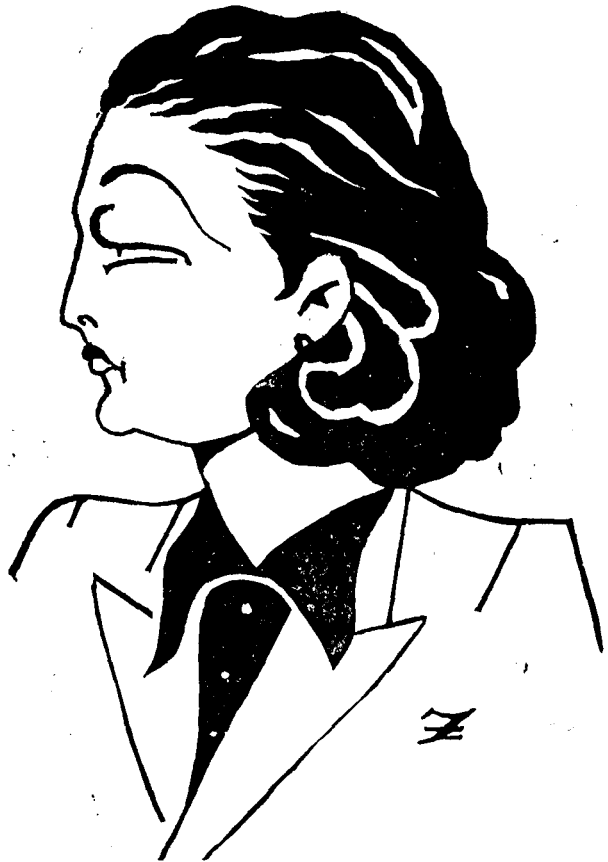
Fa més de tres pams de goig i a tothom fa tornar boig.

DENTISTA sense feina s'ofereix de cambrer per destapar ampolles de xampany sense dolor i a la primera estirada. J. M. a Agustí.