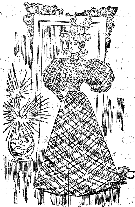
Trage para reunión.

Modelo exclusivo para nuestras lectoras, de los Grandes Almacenes de «El Siglo», Barcelona. (1)