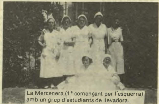
La Mercenera (1ª començant per l'esquerra) amb un grup d'estudiants de llevadora.

Ho és, ho és. I si no fos per l'inconvenient que comporta el no tenir hora!. Ni de dia ni de nit, i tant si és festa, com si et trobes malament; el desaventatge és aquest, però per la resta, dóna moltes satisfaccions. Perquè en acabar d'assistir el part si d'ha desenrollat normalment