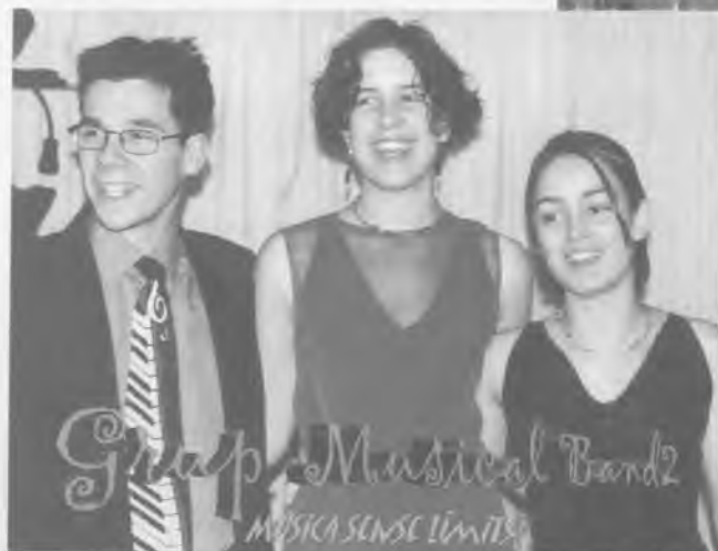
Un dels grups actuals de música festiva amb més projecció.

ganitzats, en diverses ocasions i amb diferents resultats, —en algun cas els organitzadors s'hi van picar fort els dits— per persones i entitats locals i forasteres. Gràcies a aquestes iniciatives hem pogut escoltar de viva veu a la nostra vila, els principals grups de rock català i individualitats com Lluís Llach, Raimon o Maria del Mar Bonet, entre molts d'altres.