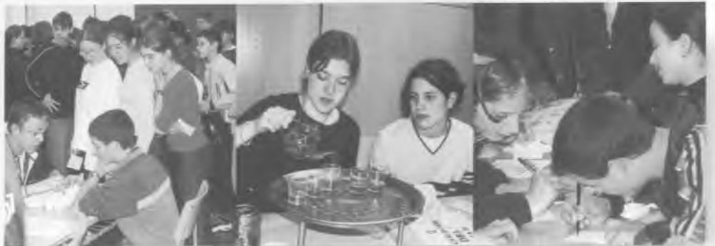
Tallers de la fira multicultural.