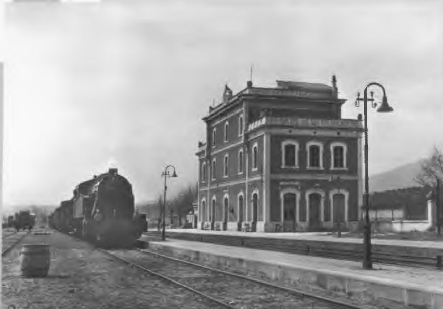
Estació de Breda.

A la primera guia excursionista editada en el nostre país l'any 1879 "Excursió a la montanya de Montseny per un propietari de la Vila de Breda" obra d'Artur Osona, Arbúcies ja hi apareix citada "Sens dubtar-ne la vila d'Arbucias es de las mes agradables de Catalunya, a més de que és moltíssim còmoda; te una bona fonda y la separan del ferro-carril de Fransa 3 horas y mitja de una magnífica carretera que