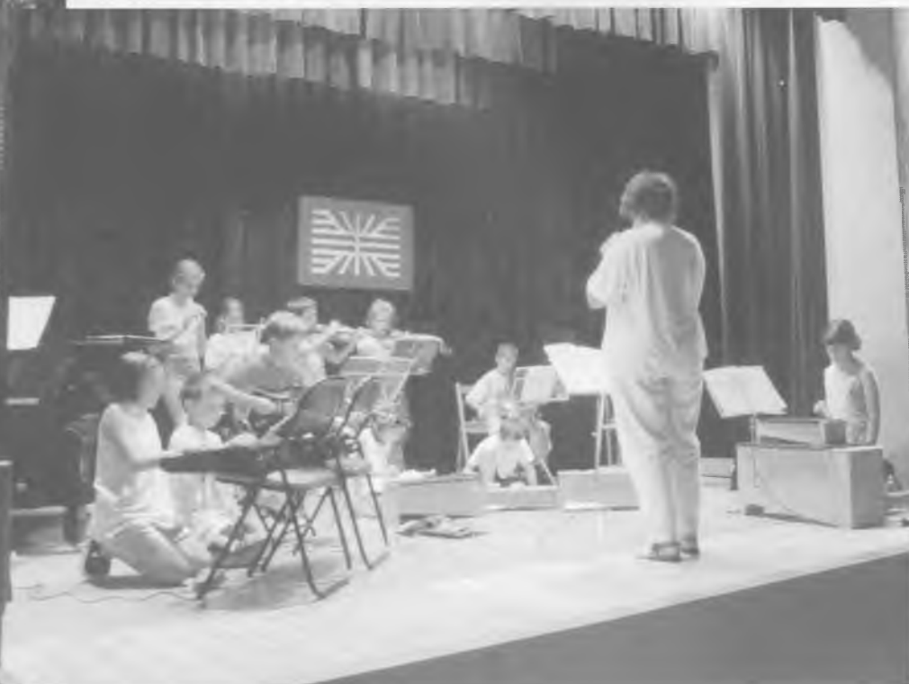
Audició fi de curs d'enguany del grup instrumental de l'Escola de Música.