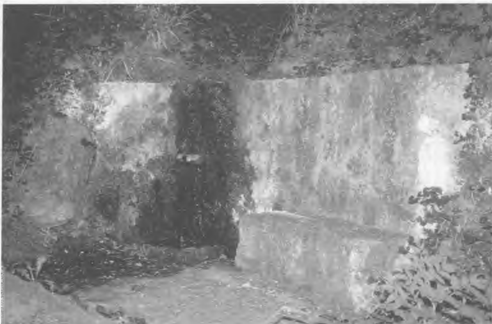
Font a la carretera de Mollfollada.

Si continuem fixant-nos en les dades observem que a mig termini s'havia previst un consum igual en l'agricultura, força més