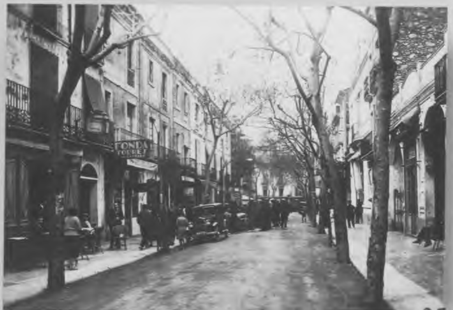
El carrer Camprodon.

Cal esmentar també l'aparició, dintre de la primera dècada del segle