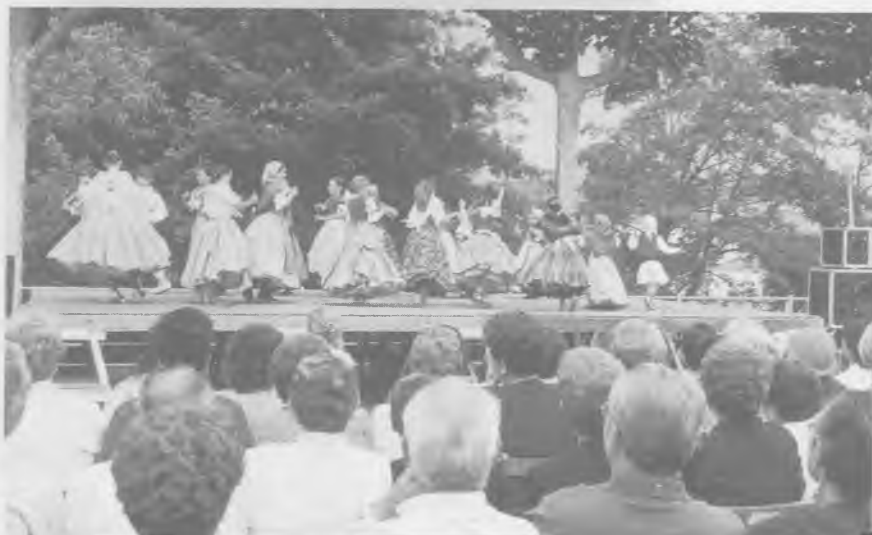
Balls tradicionals a la Placeta de Can Reus.

Actualment i com un dels darrers elements que encara resten per finalitzar cal esmentar l'escultura que l'artista australià Lawrence Gundabuka està esculpint a la Riera Xica.