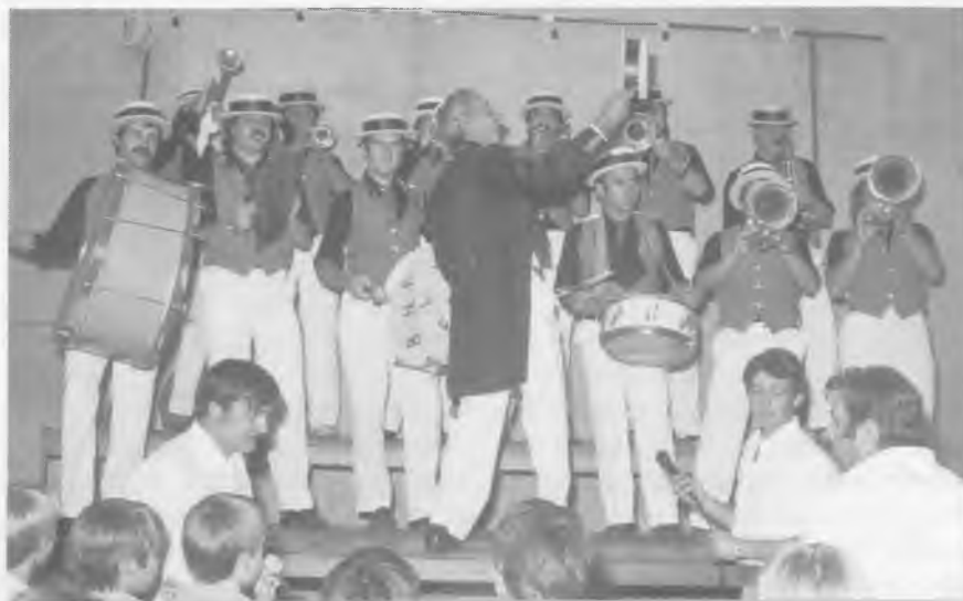
La banda còmico-musical ELS SERAFINS en acció.

propera amb les sabates a la mà i les espadenyes als peus. L'instrument, facturat abans en el cotxe de línia, ja el trobaven a l'estació.