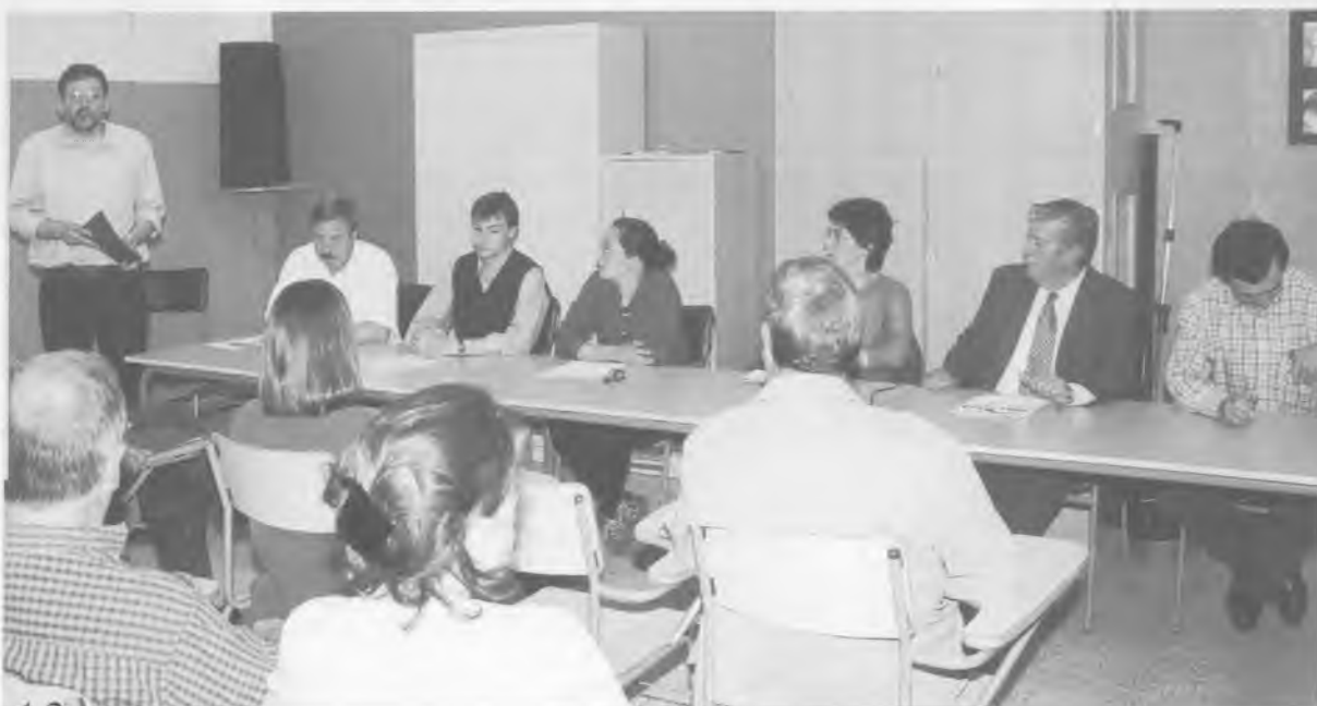
Taula Rodona empresa-escola.

El curs 79-80 es van iniciar els estudis de la Formació professional a Arbúcies. Durant els cursos que ha funcionat l'antic pla d'estudis de l'FP, han obtingut el títol de tècnic especialista 358 alumnes en la branca Administrativa i 213 alumnes en la branca de Metall i Electromecànica. Aquests joves, provinents dels diferents municipis de la subcomarca Montseny-Guillerries, s'han integrat d'una forma majoritària en les indústries de la zona. L'interès demostrat pels joves de la comarca en adquirir una formació professional especialitzada, juntament amb la demanda de personal qualificat que es produeix per part de les empreses, justifica la continuïtat de la Formació professional. La reforma educativa ha comportat canvis a l'ensenyament, i la nova formació professional s'ha d'obrir camí en el nou model educatiu. La creació