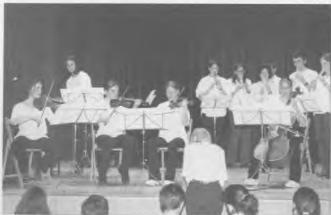
El grup instrumental interpretant una peça del concert.