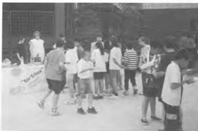
Parada d'elaboració de tortitas.