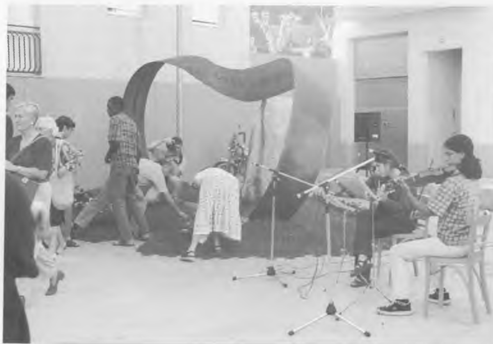
Acte a la Plaça de la Solidaritat.

proclamació, la reivindicació i la implimentació de la justícia. Comprovava que aquí, en una petita i pròspera localitat del Primer Món, també teníem presents unes causes compartides.