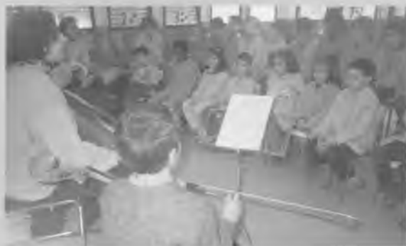
Concert de violoncel al CEIP Dr Carulla.