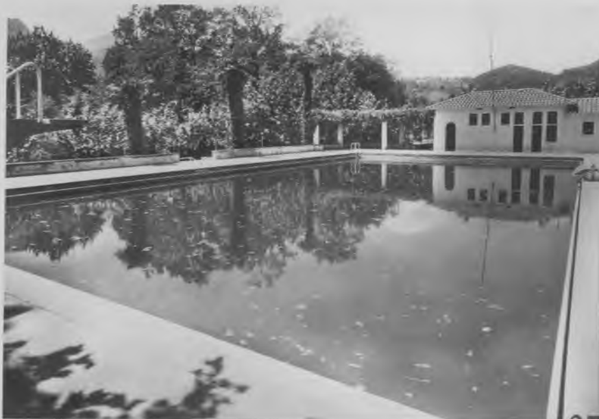
Piscina del Parque.

La base d'aquesta oferta, sobretot pel que fa als allotjaments, amb poques modificacions i amb unes poques incorporacions, serà la que estarà vigent durant els propers quaranta anys.