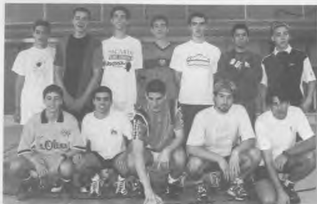
Jugadors de handbol, esportistes per la pau.