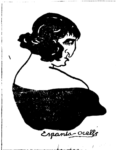
Heus-aquí una sastresa que es l'única per fer pantalons d'home.