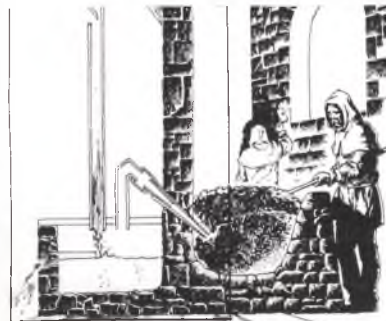
Dibuix: Esteve Polls Borrell

El teu to; els teus ulls blaus. Has deixat perfum de rosa en el teu curt camí.