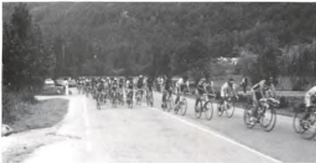
La Volta passant per Camprodon.