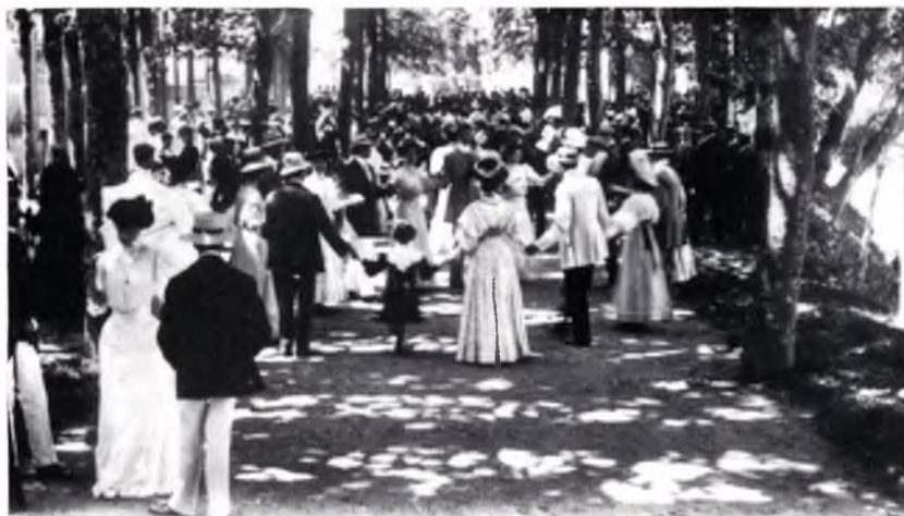
El Passeig a principis de segle, quan encara per la Mercè s'hi aplegava la gent per celebrar l'acabament de les feines d'estiu.