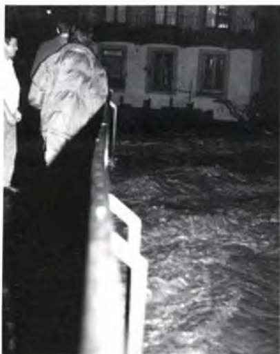
L'espectacle esteridor de la brandilla.