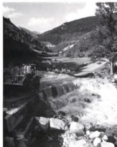
La carretera de Vallter tallada a la sortida de Setcases.