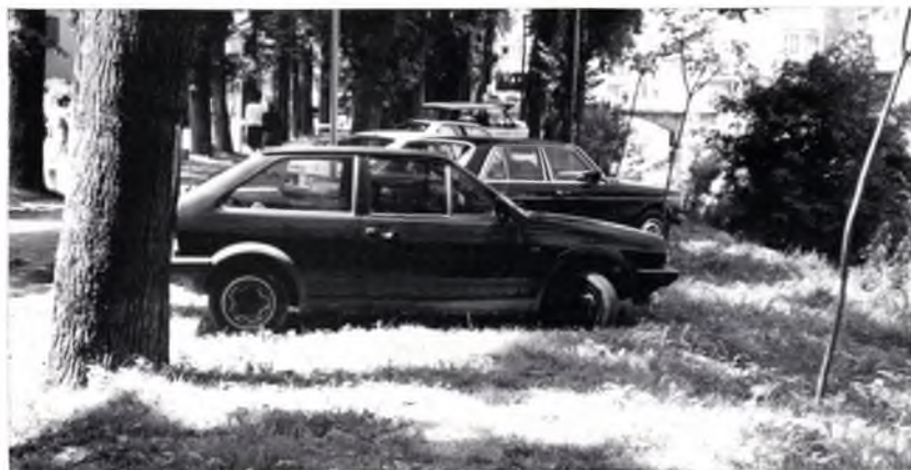
La Font Nova actualment, improvisat aparcament i mal aguanyada arbreda.