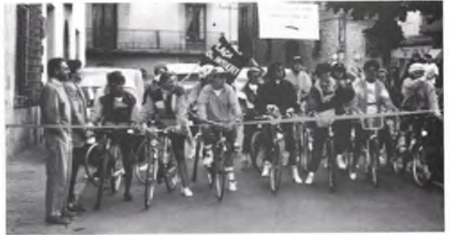
L'altre Volta, la de les dones...