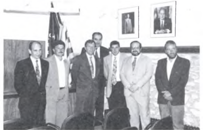
L'ufanós equip de govern, gestor de l'obra.