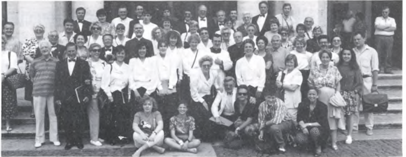
La Coral i acompanyants devant de les portes de Santa Maria la Major, a Roma.

La matinada del 23 al 24 de juny, en plena revetlla de Sant Joan, la majoria dels components de la Coral Camprodon i acompanyants vàrem emprendre el desitjat viatge a Itàlia. El bus de 2 pisos, perfectament equipat, escalfà motors i entre l'alegria de tots i al cap d'una estona la son que ens envaïa, ens dugué França endins.