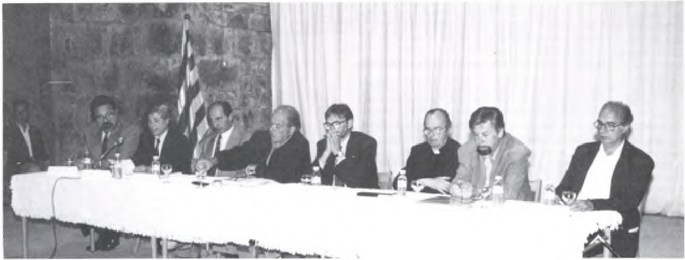
El president Pujol presidint la presentació del llibre: Camprodon, una Vall del Pirineu.

petita comunitat. En fer-ho es corre el perill d'obrir ferides, però és responsabilitat de l'autor, si en vol correr el risc. No és en cap cas lícit realitzar un treball d'investigació a mitges i deixar de parlar, amb tots els seus ets i uts, del contraband, de «l'estraperlo» o de l'acumulació de capital que alguns feren amb els «cupos» que atorgaven els guanyadors, com autèntic botí de guerra. Tot això es fa imprescindible si realment es vol que les joves generacions coneguin el nostre passat.