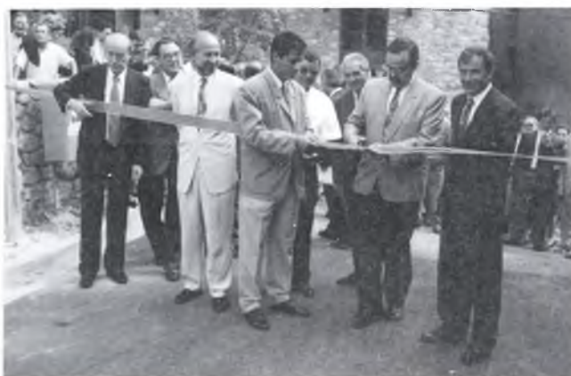
Inauguració de la urbanització del nou carrer.