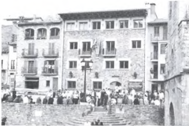
El nou ajuntament.

Finalment vermut popular a la plaça i dinar de luxe per a personalitats i autoritats a l'hotel EL GRÈVOL.