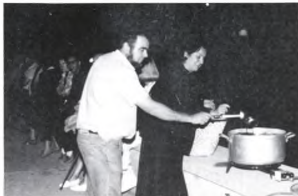
No hi podia faltar un bon cremat...