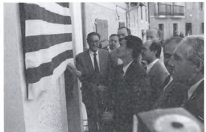
Inauguració de la nova seu de Protecció Civil.