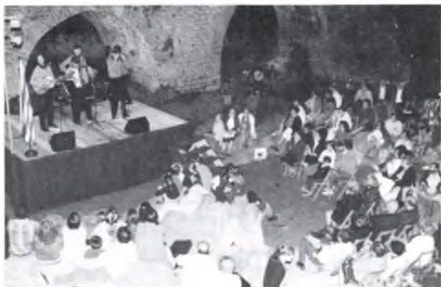
El bon temps ens va portar vora el riu...