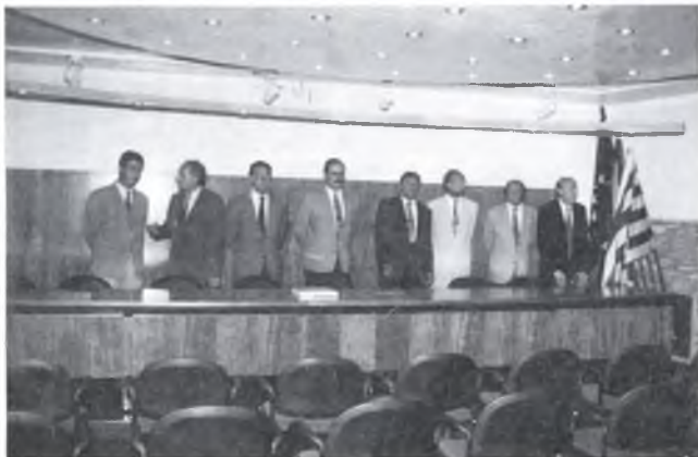
Les autoritats que van presidir l'acte.