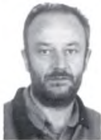
per Jordi Romans