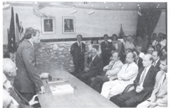
L'alcalde fent el seu parlament a la flamant sala de plens.