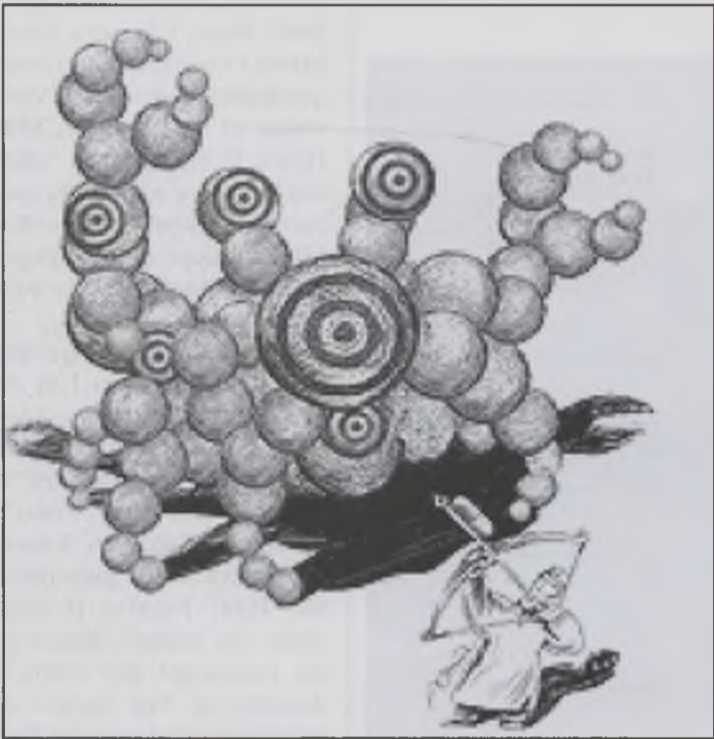
El virus de l'àntrax.

Una malaltia infecciosa que avui té en alerta a tots els governs del món