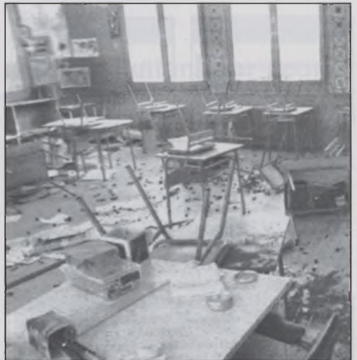
Una de les aules del col·legi Les Guilleries.

Els Mossos d'Esquadra van estar més de quatre hores recollint tot tipus de pistes que havien deixat aquests individus. En aquests moments segueixen investigant quins podrien ser els autors d'aquest acte vandàlic. En principi sembla que s'estan centrant les investigacions en un grup de joves del poble que possiblement no seria la primera vegada que haurien comès algun delictes.