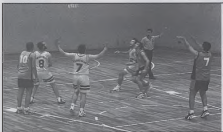
Jugador del Lloret tirant un tir lliure

L'equip sènior masculí de bàsquet no van aconseguir finalment la victòria, tot i que van lluitar fins l'últim minut per intentar guanyar l'equip visitant.