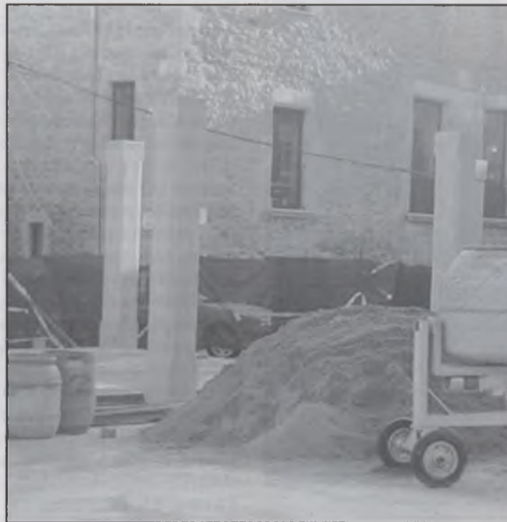
La nova plaça en obres

Mentrestant que el grup de CIU pensa que és una cosa del poble, i com a tal, si afec-