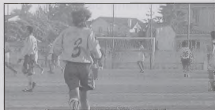
Partit del primer equip contra el Besalú