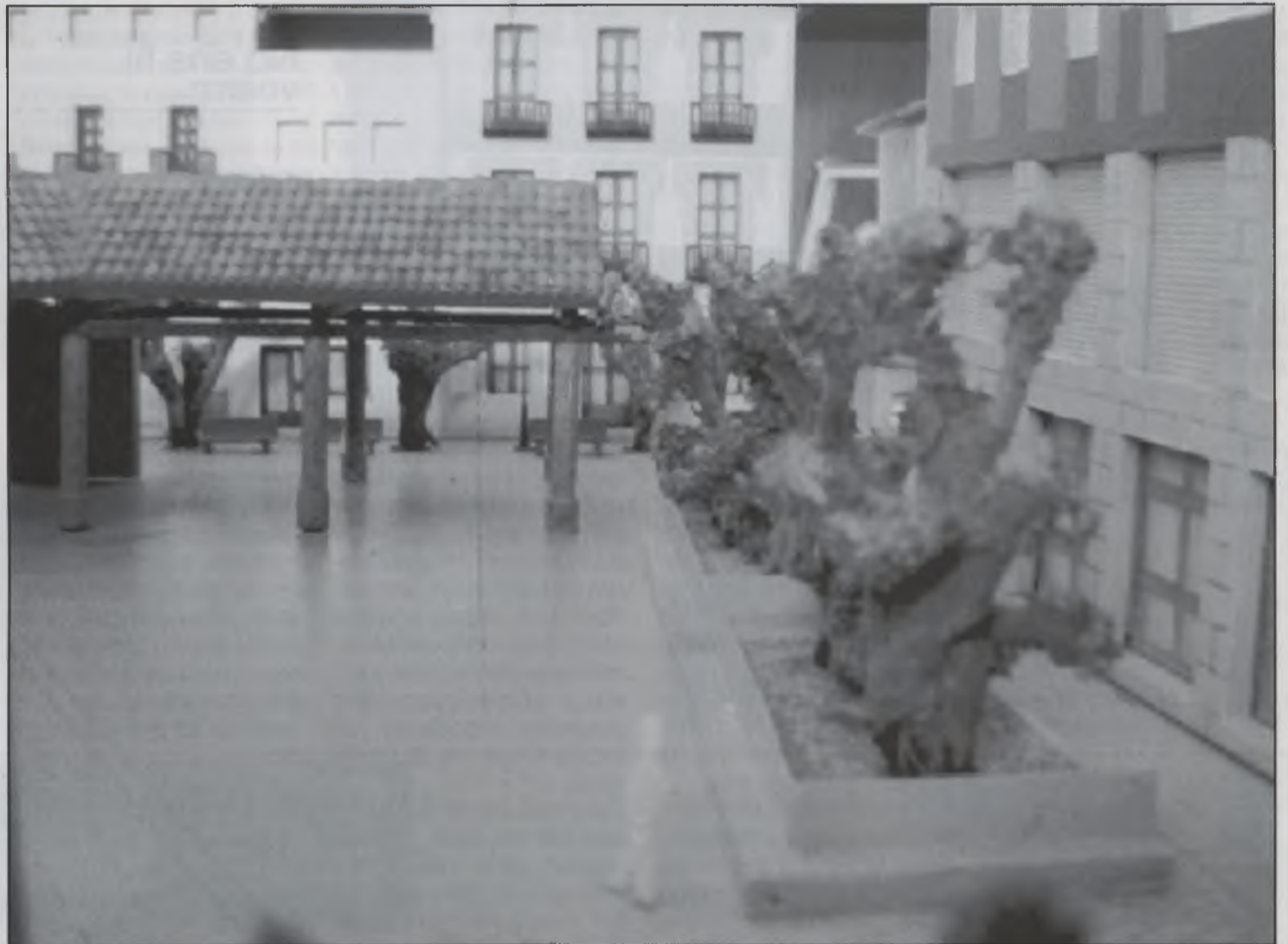
Vista frontal de la maqueta que uneix les tres places