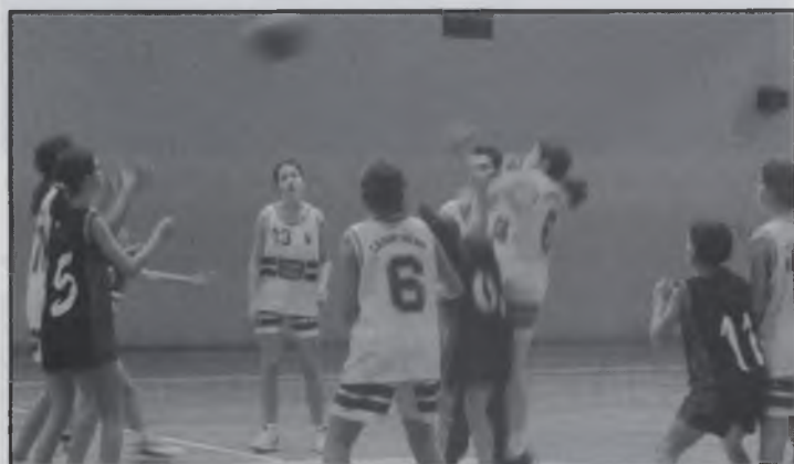
La pilota en joc després d'un tir lliure.

El partit entre el Sant Josep i el Sant Hilari C.B, jugat dissabte passat al poliesportiu, va mostrar una clara superioritat física i d'edat per part d'aquestes últimes. Malgrat les ganes mostrades per les jugadores del Sant Josep, la clara superioritat de les jugadores del Sant Hilari sota els taulers els va donar un avantatge que es va traduir en una victòria còmode. Aquest