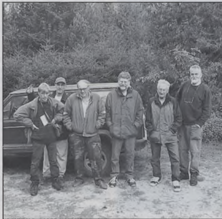
El grup de micòlegs més importants que han participat.

Segons els experts la climatologia d'aquest any no ha afa-