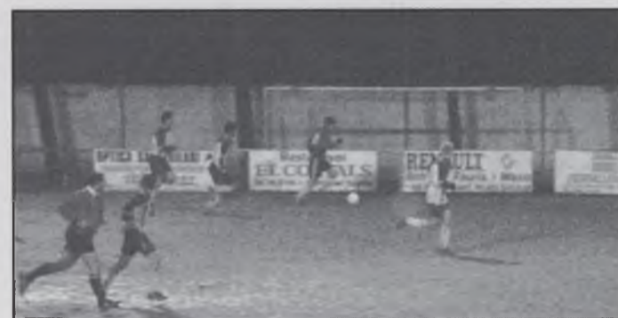
L'equip de veterans contra l'Arbúcies