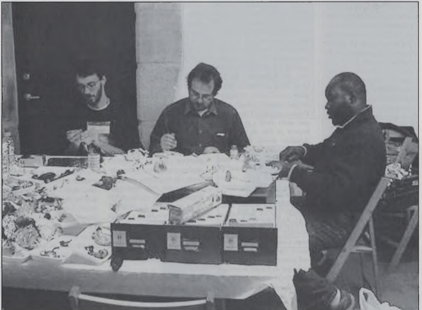
Un grup de micòlegs treballant al laboratori.