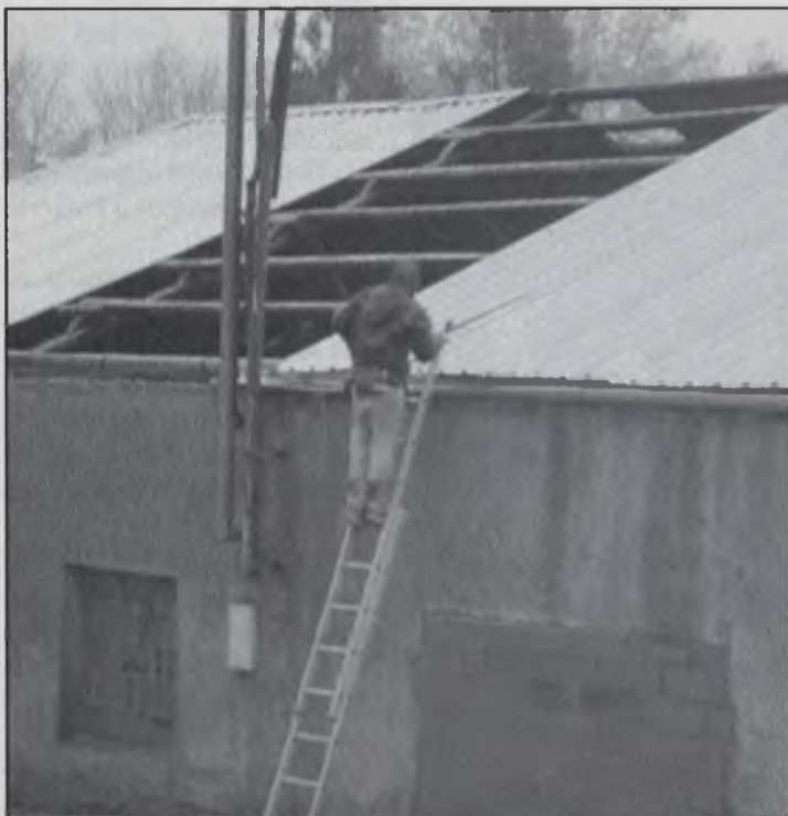
Una mostra del mal que va fer el temporal..

Una de les parets del camp de futbol va cedir a causa del fort vent