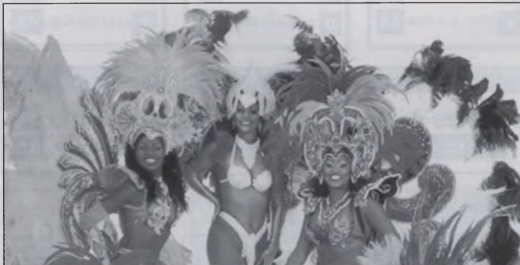
Carnaval de Brasil

Buzius és una destinació d'estiu per la gent amb un cert poder adquisitiu a de Rio - abans era una ciutat de pescadors tranquil·la, fins que la Brigitte Bardot i un novio bra-