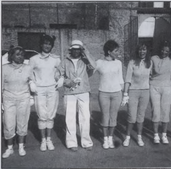
Les mares es desmadraren

Per finalitzar la setmana esportiva i cultural es farà l'obra ja coneguda per tots de Quan les mares es desmadraren , que ja és la cinquena vegada que es representa. A la mitja part