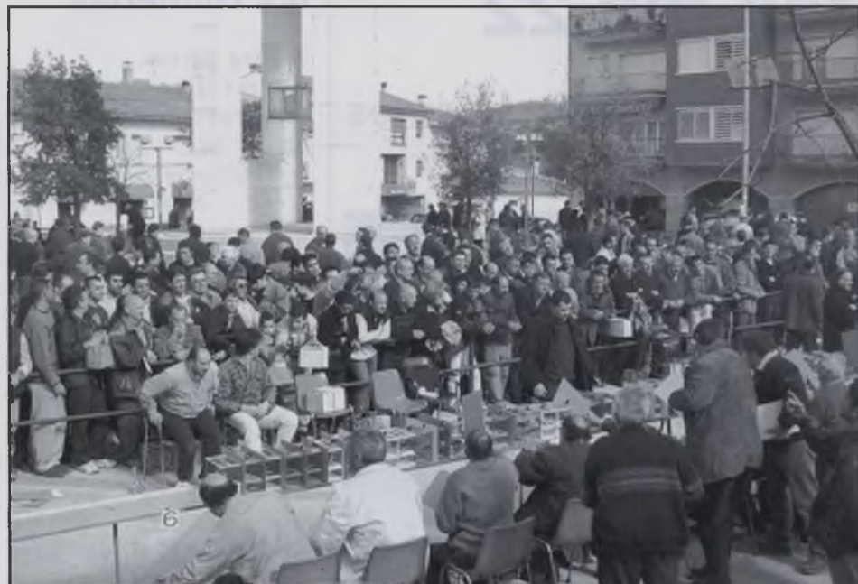
Concurs de Cants d'Ocells.