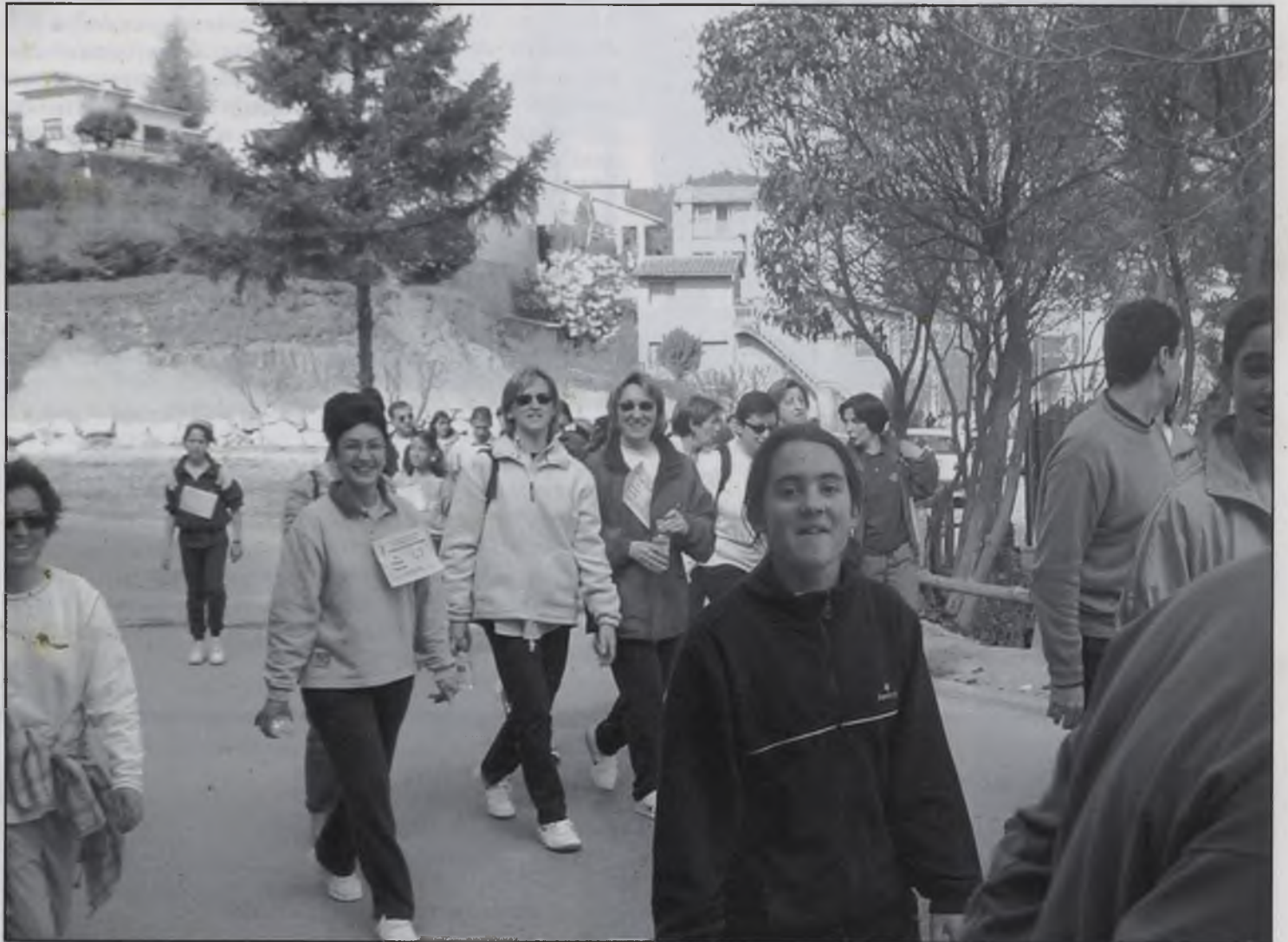
Alguns dels participants de la marxa popular.