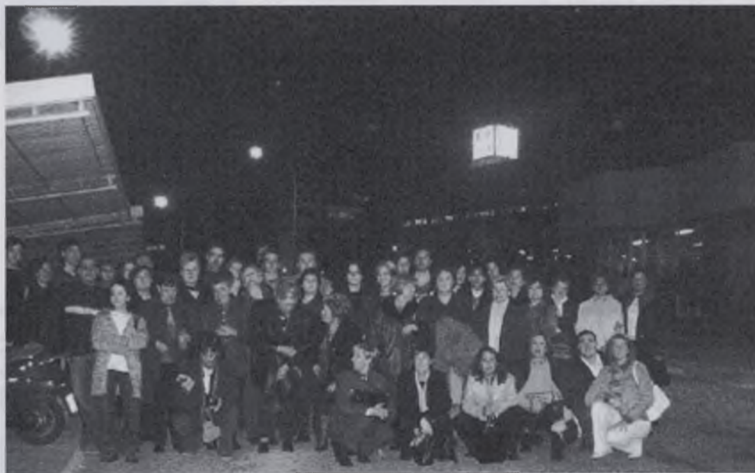
Públic de Set de Nit

Tothom vagaudir molt i esperen poder assistir a algun altre programa com a públic