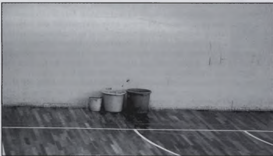
Galledes al pavelló per agafar l'aigua de les goteres.

L'equip sénior va haver de parar l'entrenament perquè hi havia goteres al sostre