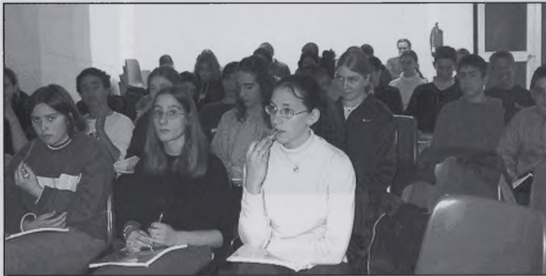
Els alumnes en el taller

El taller va constar de dues parts: per una banda veure alguns hàbits i tècniques d'estudi, i per l'altra es va tractar l'importància d'unes condicions favorables del lloc d'estudi, igual que la postura, l'exercici físic, l'alimentació, la relaxació i el descans. L'objectiu d'aquest taller era aprendre a afrontar millor l'època