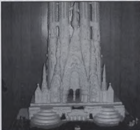
La Sagrada família