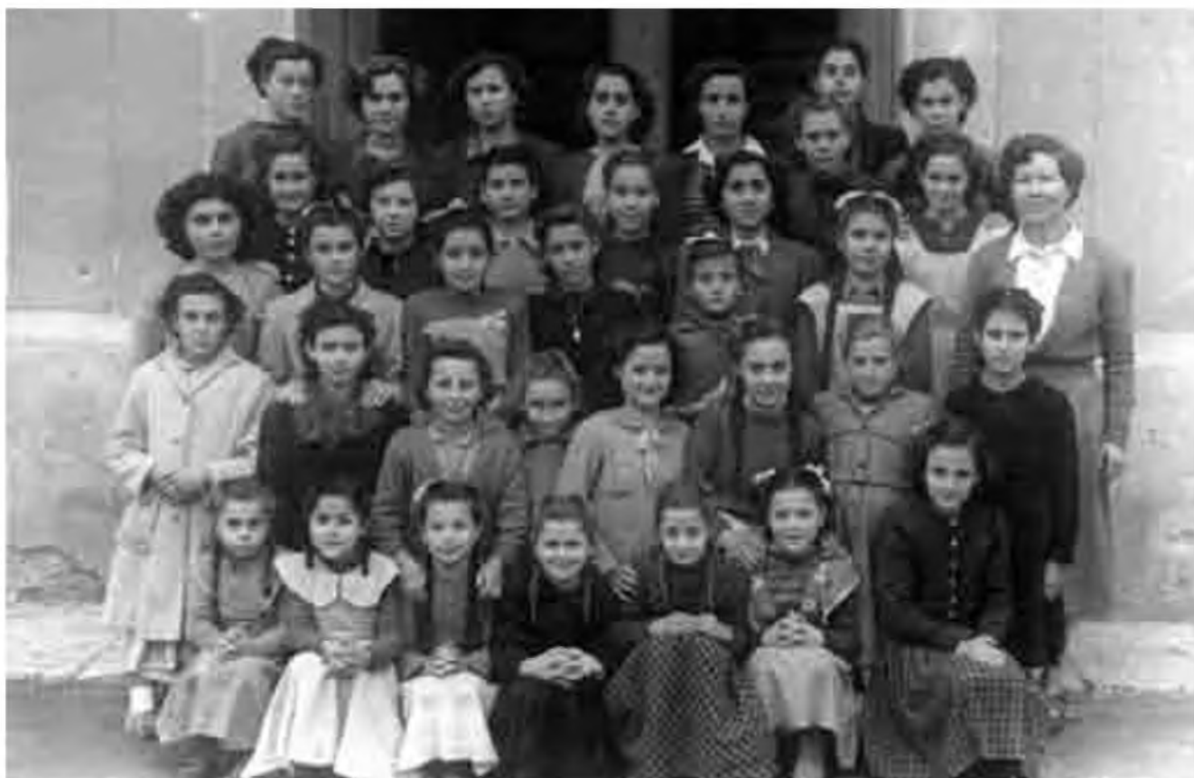
Alumnes de l'escola de la senyora Teresa Vinyals de l'any 1950 (Foto: Col·lecció Nuri Vernatallada).