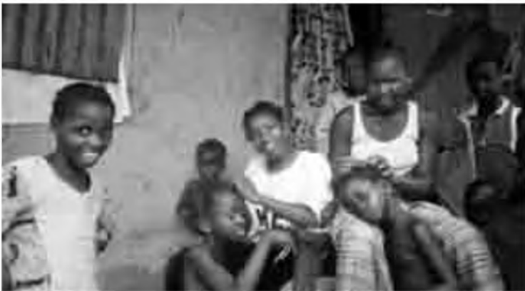
Noies fent trenes a Serekunda (Gàmbia).

Des de Serekunda vam posar-nos de ruta per la part sud