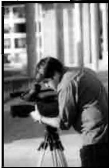
El càmera enfocant la imatge durant el rodatge al cementiri de Vidreres.