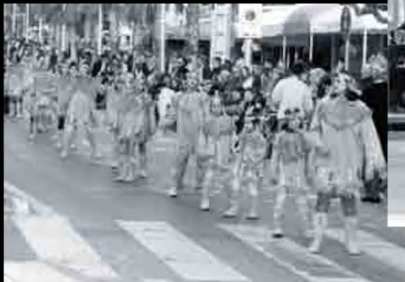
Primers premis dels concursos i carrosses del Ranxo i Carnaval, foto-estudi Albert.