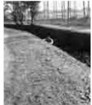
Orientador travessant una riera.