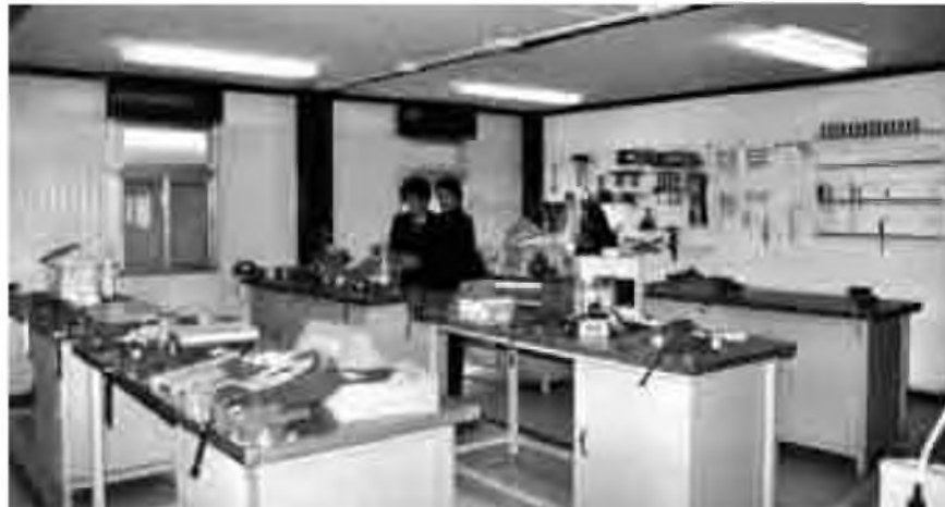
Diverses imatges del transcurs de la Jornada.