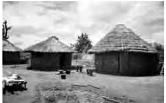
Diverses cases a Kerewane (Gàmbia).

Podem dir que Kerewane respon a la idea estereotipada que coneixem aquí de l'Àfrica: casetes de fang i palla, ramats de cabres pasturant en llibertat, gent fent la xerrada sota l'ombra d'arbres imponents; una vida tranquil·la i reconfortant per a una viatgera com jo. Allí vaig conèixer la part més important de l'Àfrica i la que poques vegades es llegeix en els llibres: la seva gent, la seva manera d'entendre la vida i veure el món i, també, que les adversitats es prenen com una