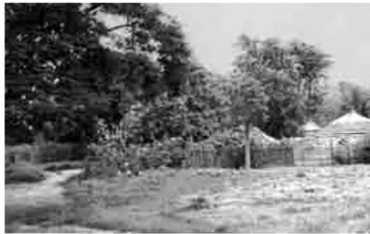
Un poblet del camí, a Gàmbia.

Durant el trajecte ens vam parar a dormir en cases de