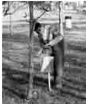
Orientador pinçant l'últim control de la cursa.