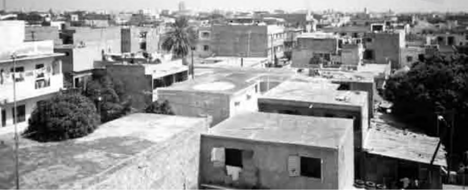
Vista de la ciutat de Dakar des de la casa on vivia.