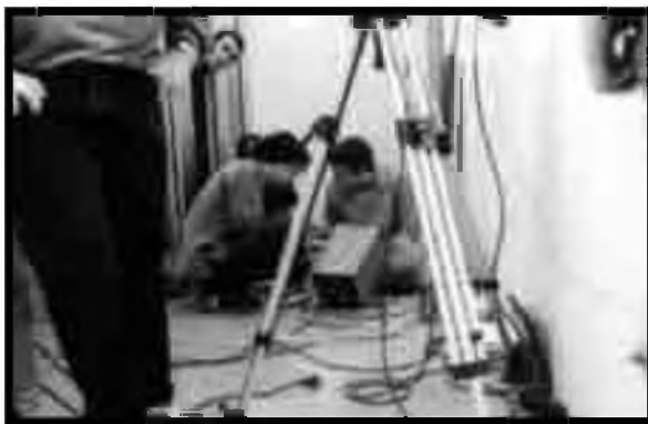
Director, productor i director de fotografia compostant un pla.