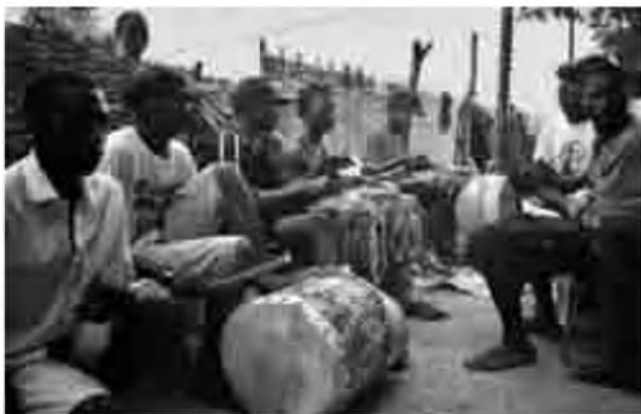
Una família de músics a Kolda (Senegal).

També tinc oportunitat per viure de prop una de les tradi-