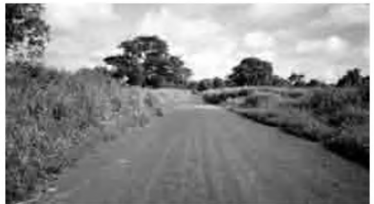
La carretera de Kerewane a Patta (Gàmbia).

De tornada, ens decidim per fer el camí cap a Tambacounda (Tamba pels habitants del lloc), ciutat de pas per als comerciants que entren per la frontera de Malí o Guinea Bissau. La mateixa carretera ens portarà fins a Koungeul, Kaffrine i Kaolack, una de les ciutats més importants de la