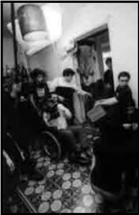
Preparant un tràveling amb mitjans casolans.