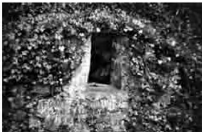
Font de Can Dalmau.