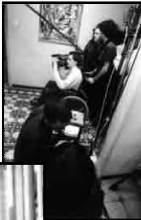
L'equip tècnic en plena acció.

DIRECTOR I GUIONISTA DE "IMAGINA CUANDO LLEGUE EL INVIERNO"