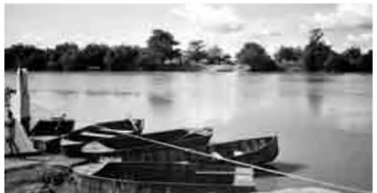
El riu de Gàmbia, al seu pas per Basse.