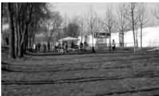
Panoràmica d'on estava situada l'arribada de la cursa.

El dia 20 de gener d'aquest any s'ha celebrat per quarta vegada. Com en edicions anteriors, la prova ha estat organitzada pel Club Esportiu d'Orientació Oros (Oros prové de la paraula muntanya en grec). Amb la finalitat de promocionar aquest esport, aquesta entitat organitza també altres curses d'aquesta modalitat a les comarques de la Selva i el Maresme