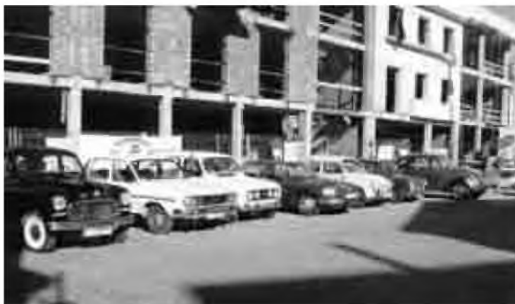
Alguns dels vehicles participants a la II Ruta dels Tapers.

Tots els vehicles participants van restar exposats a la plaça Lluís Companys, des de les 10 del matí fins a les 12 del migdia. Van ser molts els curiosos i els nostàlgics que es van passejar per la plaça contemplant i admirant aquelles peces de museu. Mentrestant, els participants van poder fruit d'un bon esmorzar al restaurant Can Pitu, per recuperar forces i fer-la petar tot comentant les peripècies de la segona Ruta