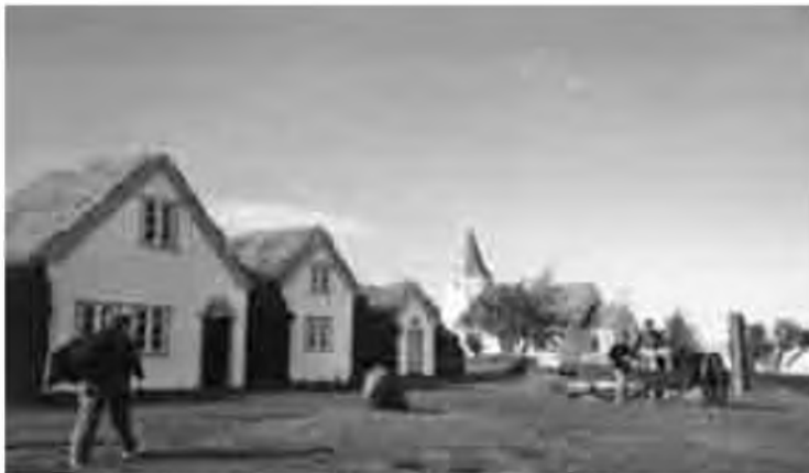
Museu etnològic de Glaumbaer.

criptible. Continuem cap al parc i passem al costat del llac més gran del país el Þingvallavatn, a banda i banda petites casetes d'estiueig i xais per tot arreu, i molsa verda de vellut, com si estiguéssim dins del pessebre més bonic del món. Quan la guia ens parlava de visitar Þingvellir, la seu de l'antic parlament islandès, ens pensàvem trobar un vell palau, doncs no, es tracta d'una magnífica vall, travessada per la gran falla Atlàntica, aquí podem veure uns set quilòmetres, d'aquesta immensa columna vertebral que creua tot l'oceà Atlàntic de nord a sud, separant Amèrica d'Àfrica i Europa.