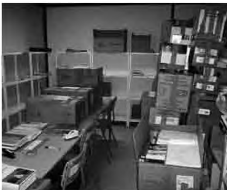
Sembla un magatzem, però és el departament de llengües.

per quan arribés el gran dia, els departaments feia setmanes que anaven fent caixes, les secretàries no donaven l'abast, Direcció estava elaborant el protocol del trasllat, els pares fent reunions per venir a col·laborar, tothom estava engrescat i vivia el canvi de centre com si fos el canvi de casa seva.