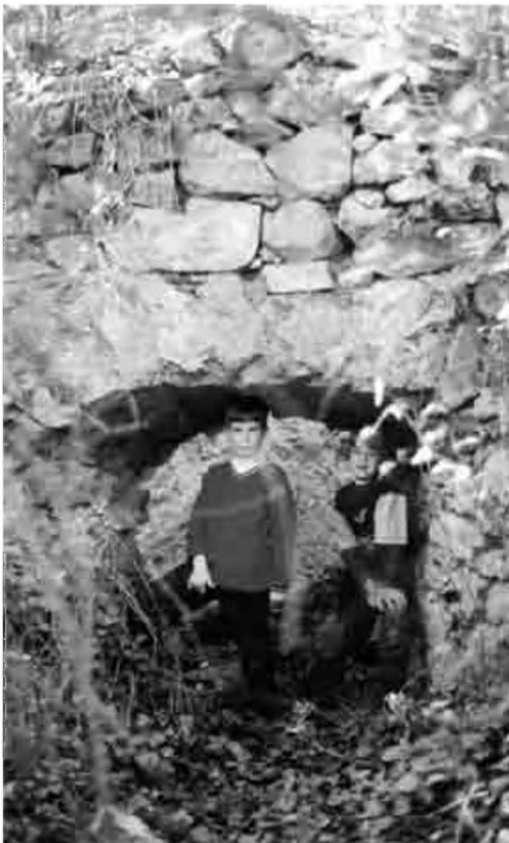
Forn de vidre.

(o sigui, anterior a l'arribada dels romans a aquestes terres el segle III a.C.). Segons aquesta versió, l'escriptura correcta seria Caulés , amb accent tancat. Posteriors estudis van considerar que aquesta interpretació era equivocada, i que l'origen calia buscar-lo més a prop, en el mot llatí caldarios (calderons, encalentidors, banys calents; però també, antigament, basses i gorgues d'un riu) i per tant caldria escriure Caulers .