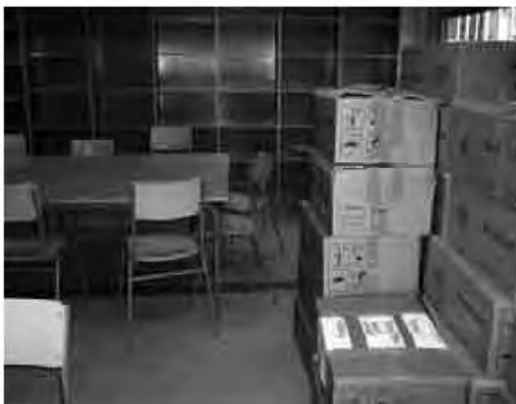
Els llibres de la biblioteca en caixes a punt de ser traslladades.

El passadís, lloc de pas i de trobada al canvi de classe, s'havia convertit en els darrers dies en una mena de magatzem. Ple de caixes, taules, cadires, armaris... els professors atrafegats anant d'un lloc a l'altre, el centre ple de gent forastera carregant el material en camions. Tots anàvem fent preparatius