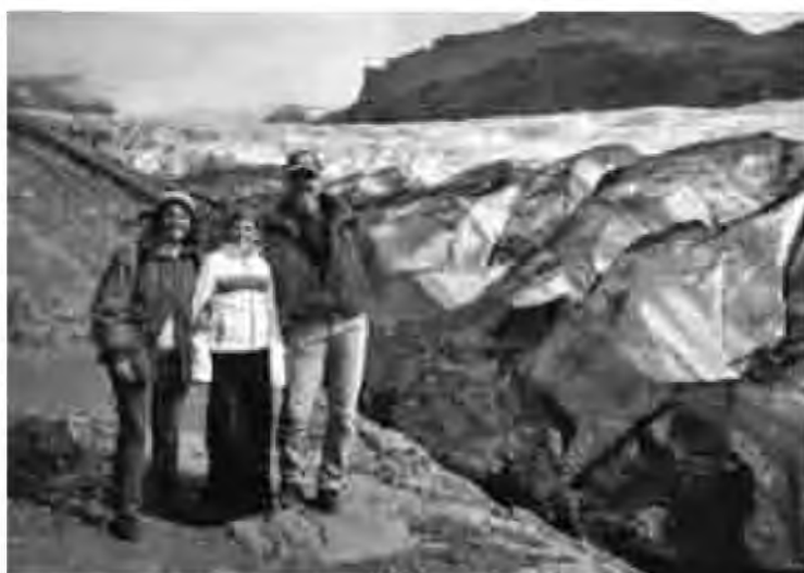
A una de les llengües de la glacera de Vatnajökull.

de les diferents glaceres ens acompanyen durant l'esmorzar. Avui toca recórrer tot l'est de l'illa, els fiords orientals, profundament encaixats entre altes muntanyes. La carretera els va vorejant. El més bonic són els petits pobles de pescadors que hi ha a la part més interior de cada fiord i la gran quantitat d'aus aquàtiques que hi viuen. Avui, dia més tranquil, parem a Egilsstaðir, al costat del llac Lagarfljót: és una plana fèrtil, amb massa arbòria, dels pocs llocs d'Islàndia on hi ha arbres. Quan els vikings es van establir a l'illa varen talar els pocs arbres que hi havia per fer llenya pel foc i alleugerir els extrems climàtics, per això fa il·lusió veure algun lloc amb arbres durant el recorregut. Passem per aquest poble tranquil i acollidor, nus de comunicacions i punt de sortida de moltes excursions. Avui anem cap al Nord, cap al llac Myvatn, situat en una de les zones volcàniques més actives del planeta. Aquí podem observar tota classe de fenòmens curiosos: fonts termals, cràters bombollejant, camps de lava amb formacions rocoses d'aspecte fantasmagòric, xemeneies fumejant... Podem dir que