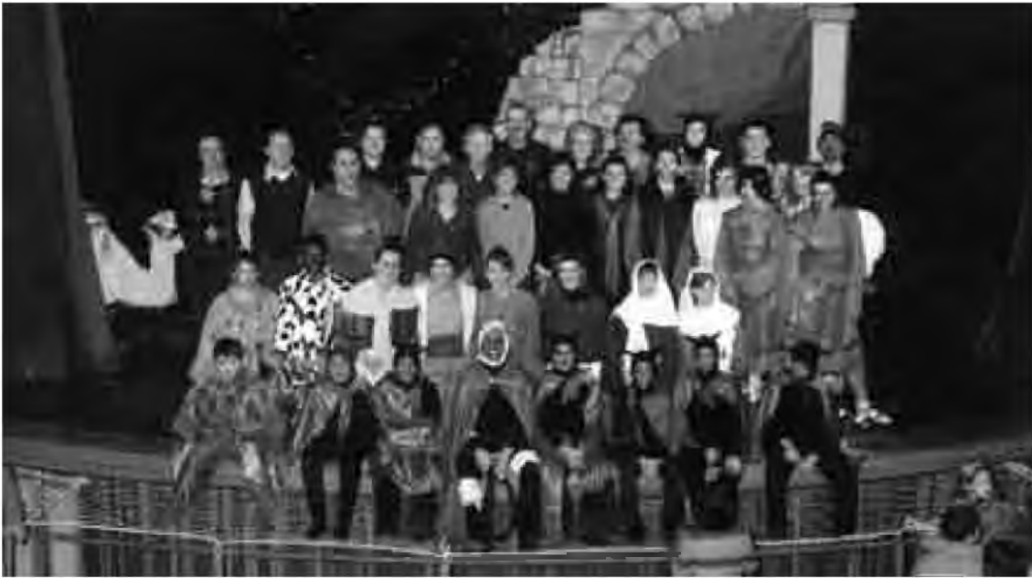
GRUP DELS PASTORETS DE VIDRERES

Les trifulgues de Lucifer, les discussions de l'hostaler i l'hostalera, les bertranades dels soldats romans, les magarrufes dels pastors i les pastores... i el triomf final del bé sobre el mal, van acompanyar de nou les diades nadalenques. Van ser dos dies amb la sala del casino plena de públic (cinc-cents espectadors) que ens van animar amb els seus aplaudiments i rialles. Ells, però, no van veure tot el que realment va passar darrere l'escenari, aquelles anècdotes que fan que cada representació sigui única. Per exemple, que el primer dia no hi va haver manera de fer funcionar un altaveu espatllat i potser algun espectador va sortir de la funció pensant que sordejava de l'orella dreta. O que a l'escena inicial vam posar erròniament el tamboret on s'asseia la Verge un metre lluny de l'abast del seu focus