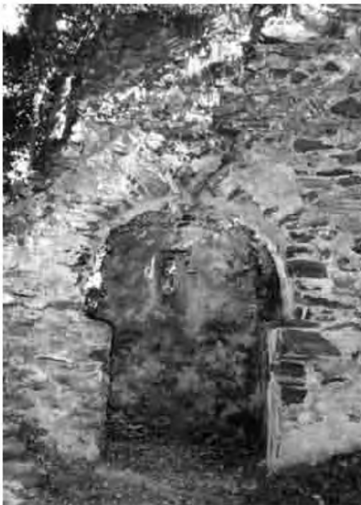
Sant Esteve de Caulès (Caulès Vell).

El primer, i que presenta un interès molt especial, són les restes d'un forn de vidre que es troba enmig de la boscúria en un indret conegut com El Forn , al vessant muntanyós orientat al nord entre can Mundet i can Noguera . És una construcció circular, d'uns tres o quatre