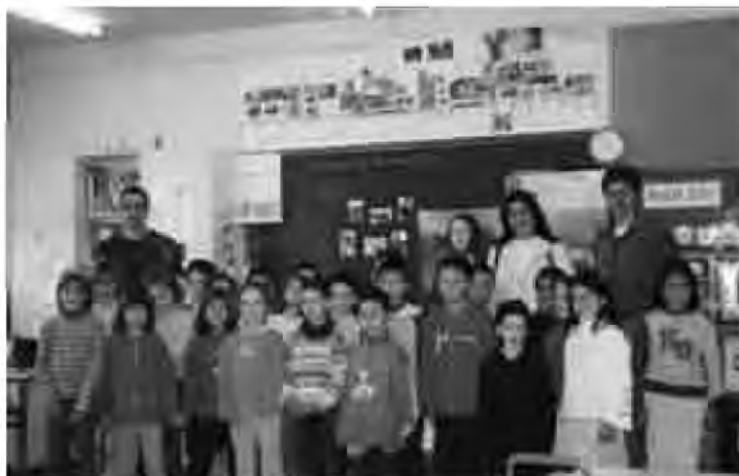
En les tres fotos veiem els mestres francesos i romanès amb els alumnes de segon, primer i educació infantil.