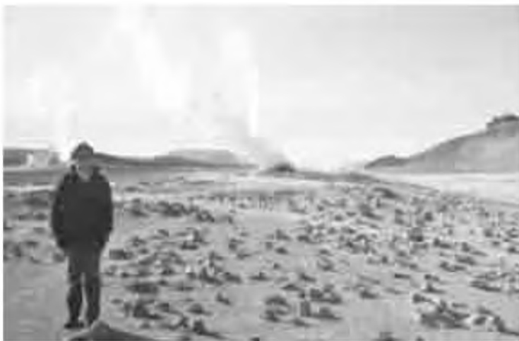
Paisatge marcià a tocar del llac Myvatn.

el terra bull als nostres peus. Abans d'arribar al llac, ens parem en una zona que, entre el color taronjós del terra i la quantitat d'escalfor dels molts petits cràters que estan bullint, sembla que hem aterrat en un altre planeta. Aquí, precisament, és on trobem una colla de Vidreres. Quines casualitats!