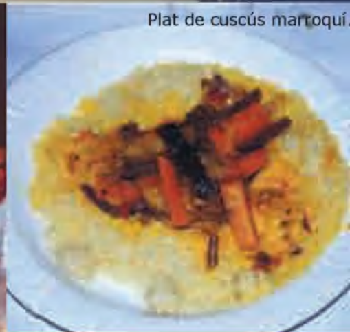
Plat de cuscús marroquí