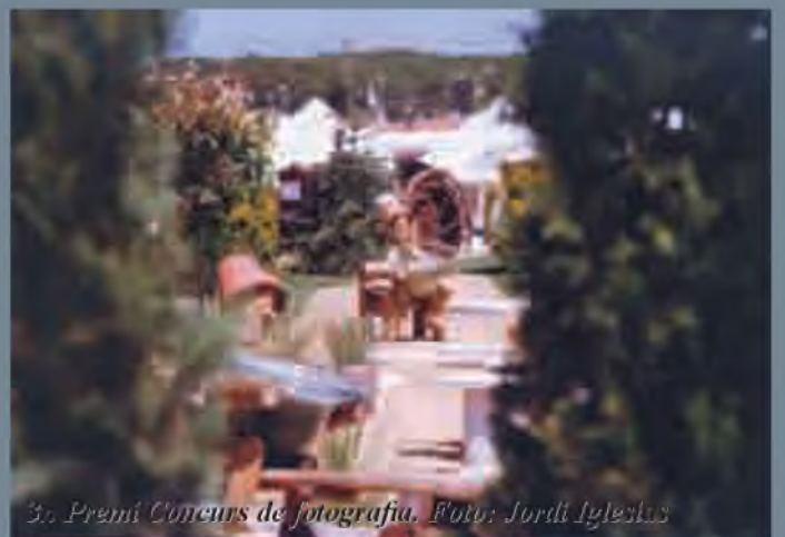
3r Premi Concurs de fotografia.