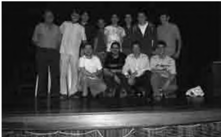
Torneig d'Escacs "El Tigre del Casino" 2005.