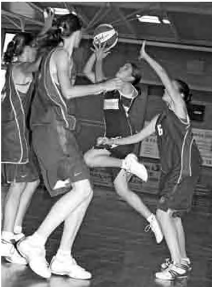
Partit de semifinal entre dos equips catalans, l'UB Barça i el BF Sant Adrià.

La lluita per la medalla de bronze la disputaren dos equips catalans, en un partit on final-