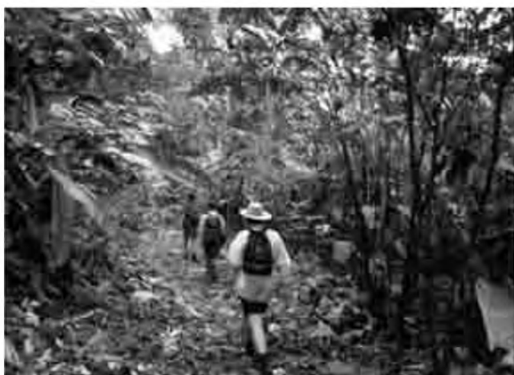
Caminada Selva Choco.

Després vam visitar la Fundació Fernando Botero (artista