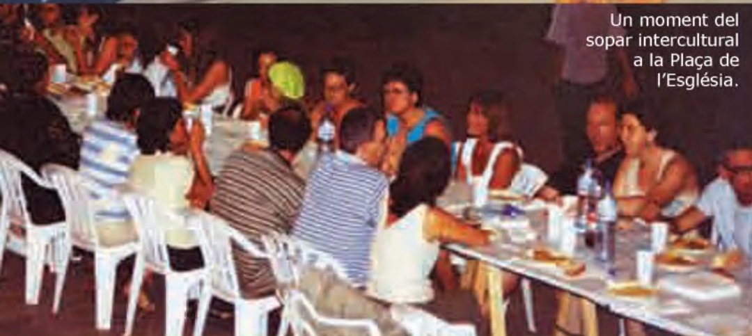
Un moment del sopar intercultural a la Plaça de l'Església.