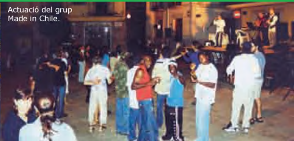
Actuació del grup Made in Chile.