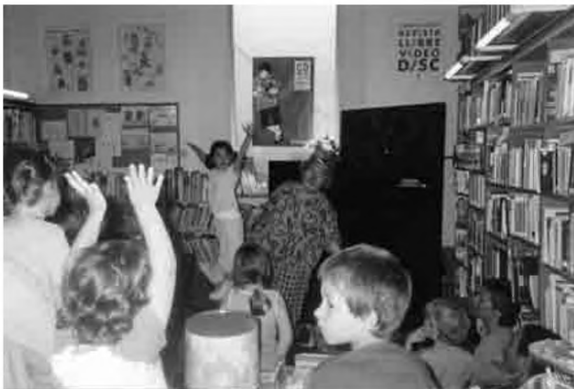
Una de les actuacions a la biblioteca.