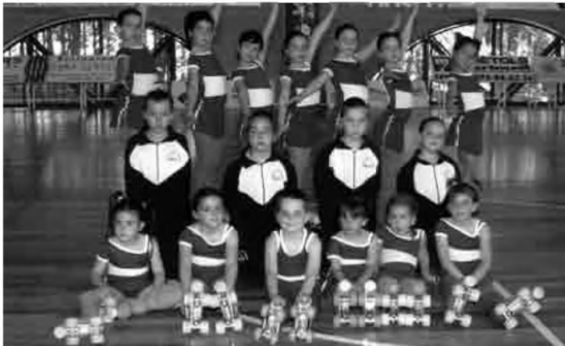
Foto de grup del Club Patinatge Artístic Vidreres. (Foto: Santi).