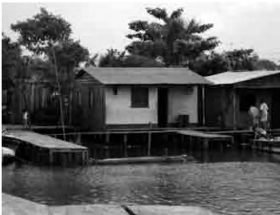
Palafit "El Valle".

només fa dos anys, els guerrillers de les FARC van segrestar dos vaixells amb turistes i això fa que tot just ara s'hi torni a anar, però mirant de no embarcar al costat equivocat. La Ensenada és una entrada d'aigua salada terra endins, tot ple de manglars (aquests arbres que viuen amb l'aigua salada i que quan baixa la marea deixen les arrels al descobert), aquest lloc és molt arrecerat i prou profund perquè hi entrin les balenes sense por. En aquest lloc hi ha una illa que en diuen Playa Blanca, on la sorra és ben blanca, com el sucre. T'hi pots banyar sense perill i només t'hi has de capbussar per veure infinitat de peixos de tots colors i uns boscos de corall realment increïbles.