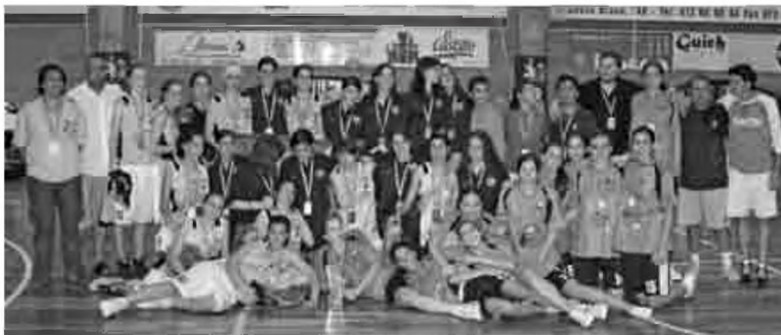
Els tres primers classificats del campionat amb les seves medalles i trofeus.