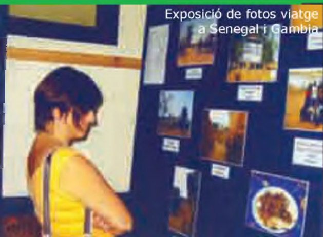
Exposició de fotos viatge a Senegal i Gambia