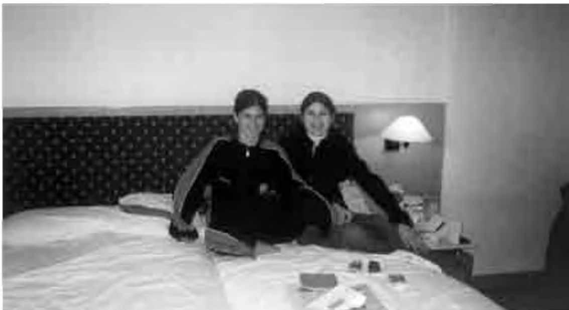
Les dues atletes del equip Gi-Costa Brava en una habitació d'un hotel.