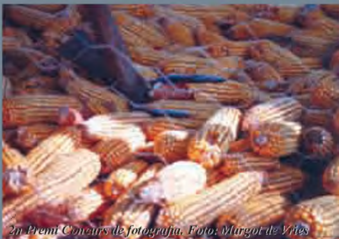
2n Premi Concurs de fotografia.