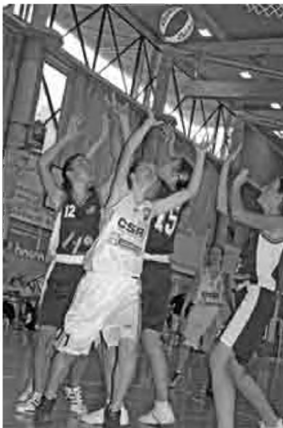
Les jugadores de Madrid i La Rioja lluitant per la pilota en la final.