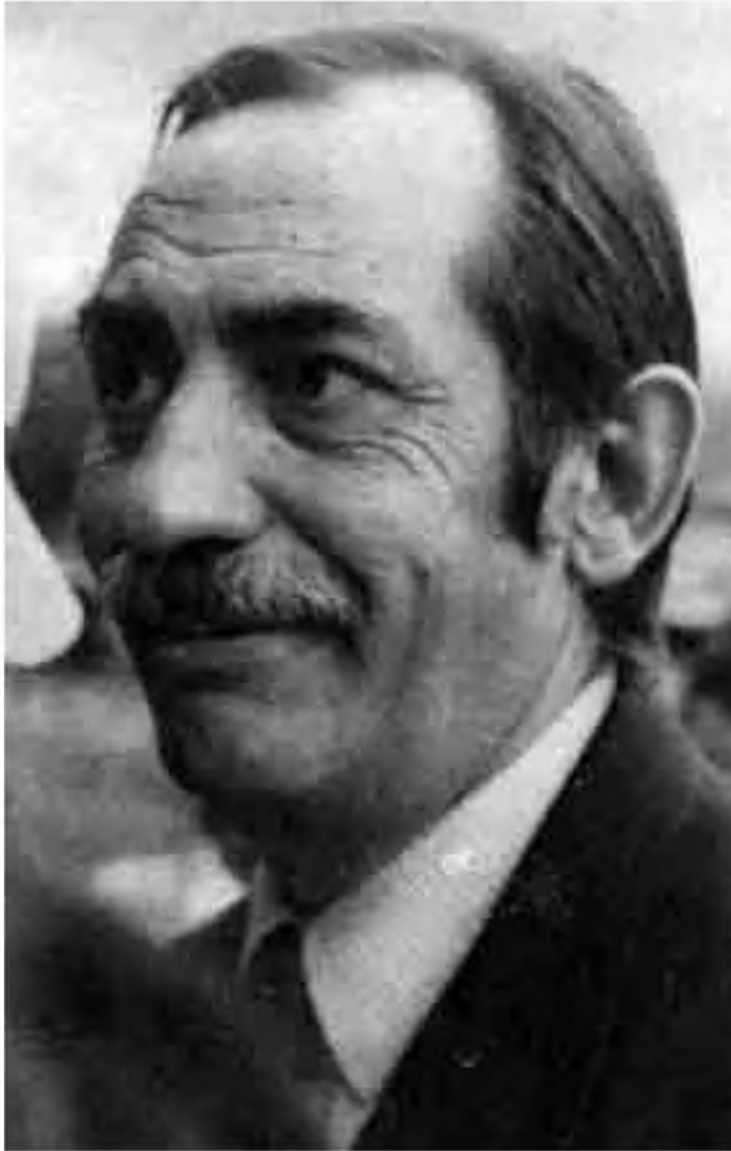
Retrat d'Emilio García Riera en les guardes de la portada de la seva autobiografia.

sos mitjans de comunicació. De 1962 a 1966 va editar una primera revista, La semana en el cine , mentre acumulava dades i experiència. Per aquell temps va entrar a treballar a l'emissora de televisió Telecadena , on va poder visionar munts de pel·lícules mexicanes. Cap al 1970, en fer fallida aquesta cadena, continuà a la televisió al Canal 13 .