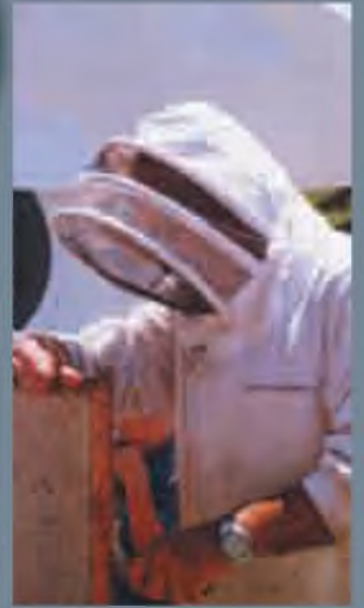
1r Premi Concurs de fotografia.