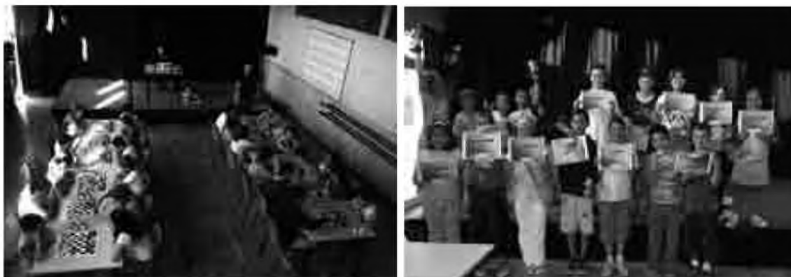
Torneig Infantil d'Escacs 2005.