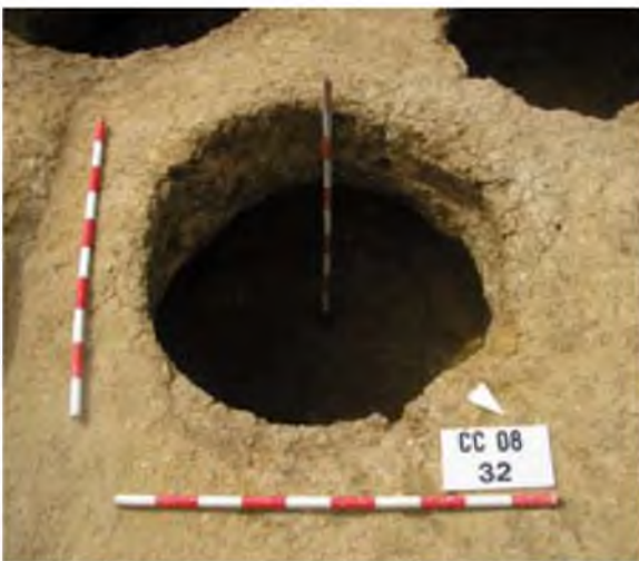
Imatge d'una de les sitges excavades.

Per una banda, tenim una primera fase corresponent a una petita ocupació de finals d'època ibèrica (entre els segles II i I aC) i, en segon lloc, trobem tota una