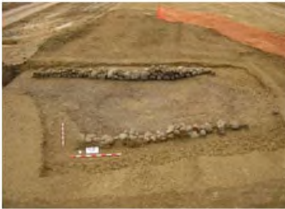
Imatge del fons de cabana de la fase tardoibèrica.

Aquestes obres de desdoblament estan promogudes pel Ministeri de Foment i l'empresa encarregada de la seva execució, fins al moment de l'aturada, ha estat l'UTE Maçanet-Sils.