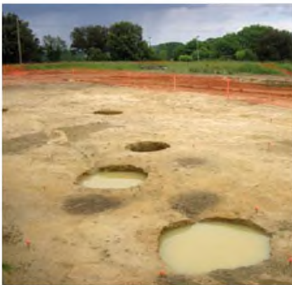
Vista general d'una part del camp de sitges, després d'un dia de pluja.