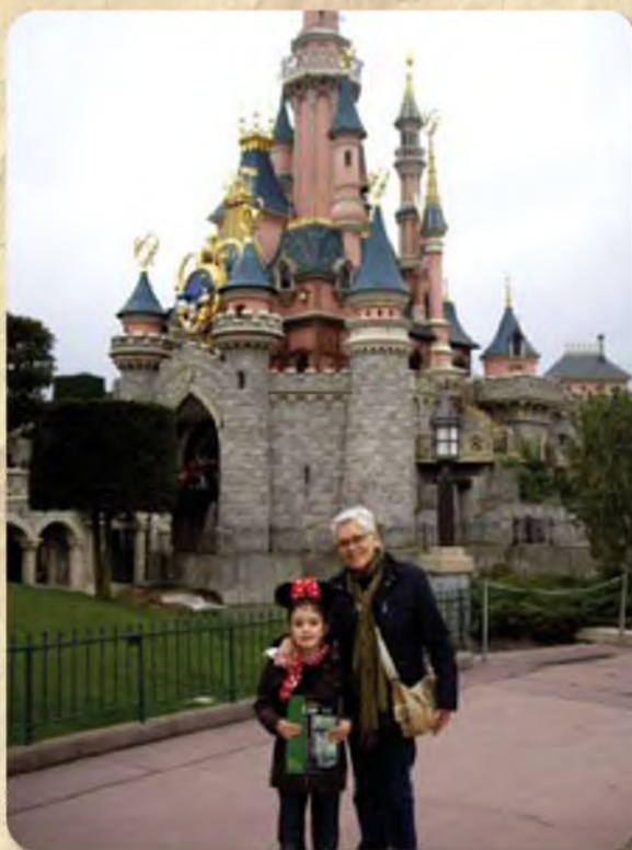
La Gala i la iaia a Eurodisney.