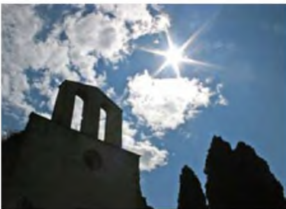
Primer premi en el concurs de fotografia de la pujada a Caulès. Autora: Helena Ordoñez. Títol: La llum.

El tema de la crisi, tan a bastament tractat, també fou analitzat des d'un punt de vista poc corrent per Biel Jover. El debat que s'hi creà va ser prou interessant com per generar moltes preguntes i respostes entre el públic assistent a l'acte.