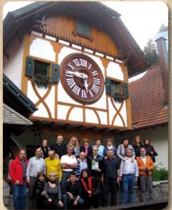
Una colla de vidrerencs a la Selva Negra (Alemanya).