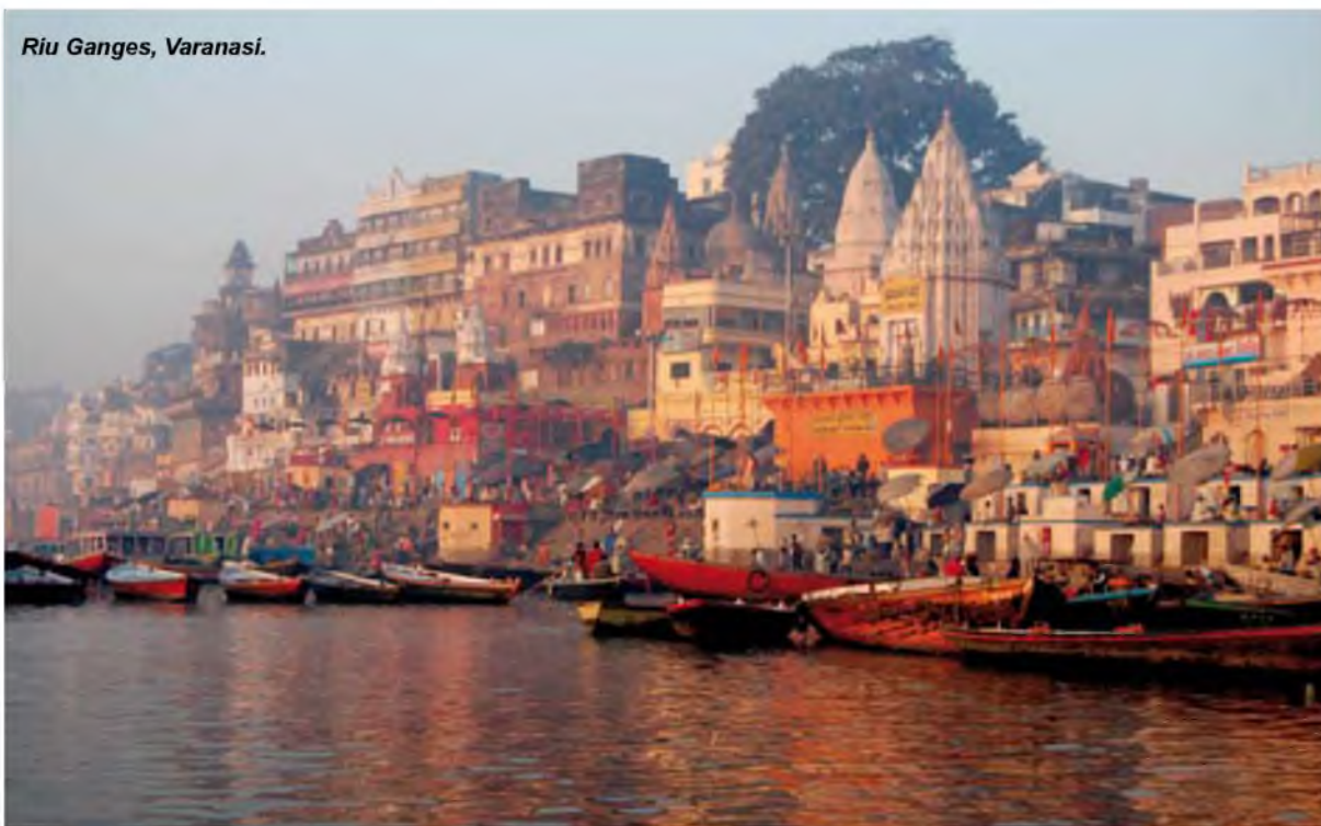
Riu Ganges, Varanasi.