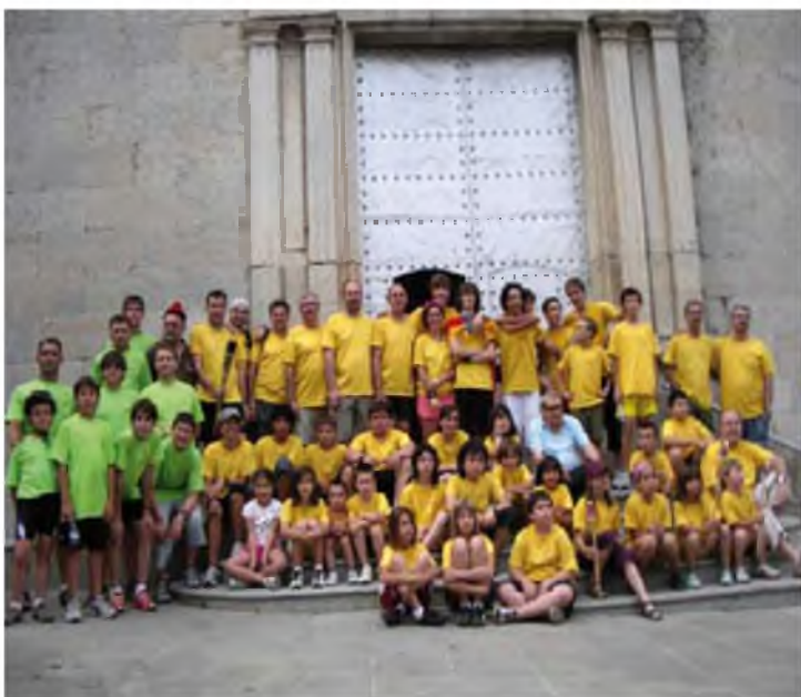
Festa de Sant Joan. Autor: J.V.

No cal dir que la participació de públic va ser un èxit. Des de Vitraris aprofitem aquest article per donar les gràcies a tots els vidrerencs que hi van col·laborar.