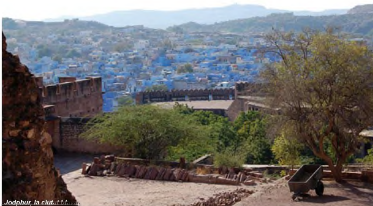
Jodhpur, la ciutat blava

Jaipur és la capital de la regió del Rajhastan i, com a tal, una de les més poblades i caòtiques que vàrem trobar durant el nostre viatge. Se l'anomena la ciutat rosada, pel color de les cases del seu nucli antic.