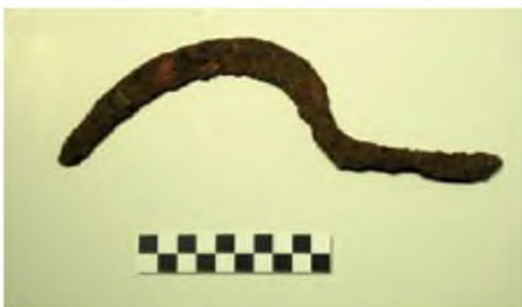
Falç apareguda en una de les sitges medievals.

En planta, la cabana presenta una forma trapezoidal, amb tendència rectangular, amb els costats llargs seguint l'eix est-oest. Al seu interior s'ha pogut excavar un sol estrat amb abundants fragments de material ceràmic de tradició ibèrica, com ceràmica comuna ibèrica, àmfora ibèrica, ceràmica grisa de la costa catalana, càlats... Entre la ceràmica recuperada també n'hi havia d'importada, com alguns fragments d'àmfora itàlica i un parell de fragments de ceràmica campaniana. Aquest conjunt de materials ceràmics és el que ens ajuda a datar el moment de funcionament d'aquesta cabana, que ja podem avançar que hauria funcionat entre els segles II i I aC.