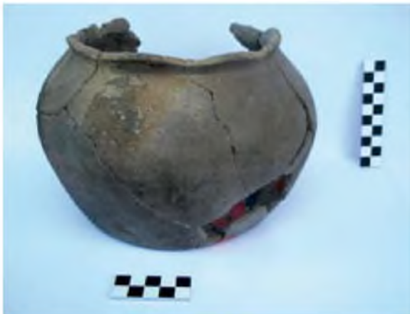
Una de les olles trobades dins d'una sitja medieval.

En planta, la cabana presenta una forma trapezoidal, amb tendència rectangular, amb els costats llargs seguint l'eix est-oest. Al seu interior s'ha pogut excavar un sol estrat amb abundants fragments de material ceràmic de tradició ibèrica, com ceràmica comuna ibèrica, àmfora ibèrica, ceràmica grisa de la costa catalana, càlats... Entre la ceràmica recuperada també n'hi havia d'importada, com alguns fragments d'àmfora itàlica i un parell de fragments de ceràmica campaniana. Aquest conjunt de materials ceràmics és el que ens ajuda a datar el moment de funcionament d'aquesta cabana, que ja podem avançar que hauria funcionat entre els segles II i I aC.