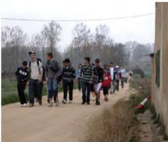
La pujada a Caulès. Autor J.V.