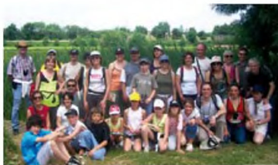
Visita guiada als estanys de Sils.