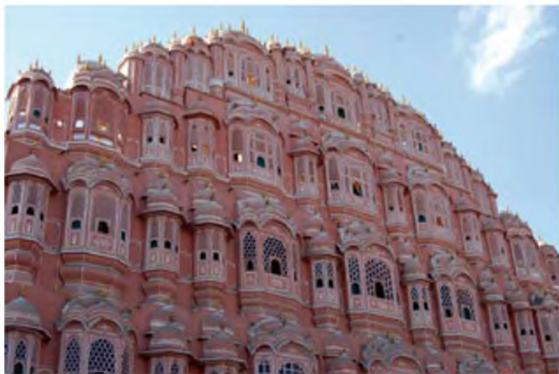
Palau dels Vents a Jaipur.

A Jaipur vàrem visitar l'antic palau del maharajà i el Palau dels Vents, que és l'edifici emblemàtic de la ciutat. Es pot passejar pels seus carrers i fer diverses compres pels seus basars, tot anant amunt i avall amb un ricshaw , que és com un carro motoritzat que el conductor domina amb un manillar. Jaipur està ple de ricshaws pels seus carrers i encara que tres persones hi caben molt atapeïdes, nosaltres en vam veure un que en portava divuit!!! Sembla impossible, però era real, els nostres ulls ho van veure.