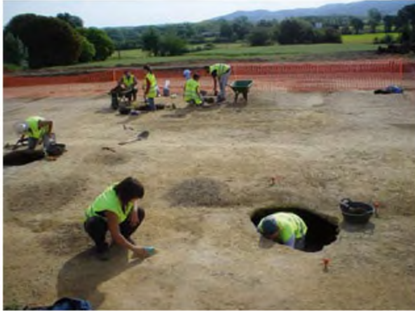
Un moment de l'excavació.

El nom del jaciment (Can Castells) l'hem triat els mateixos arqueòlegs. Tot jaciment ha de ser registrat amb un nom que l'identifiqui. Normalment, els jaciments prenen la denominació del lloc on s'han trobat (si és un camp o un paratge que ja és conegut amb un nom) o d'una casa propera, com és el cas. Aquest jaciment, doncs, s'ha batejat com Can Castells pel fet de trobar-se en l'entorn immediat del mas d'aquest nom.