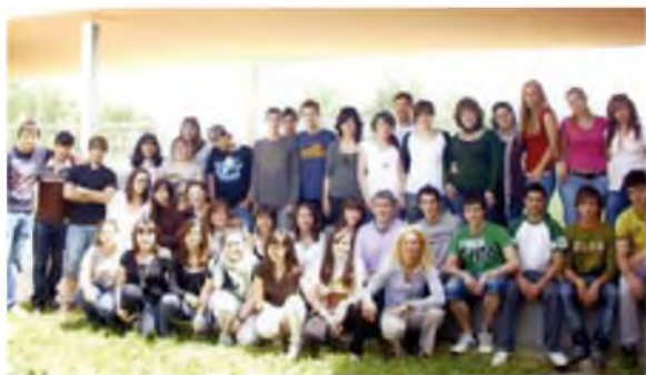
Els alumnes de 2n de batxillerat els més grans de l'IES

L'aula taller a tercer d'ESO permet contemplar la diversitat d'interessos dels alumnes tot propiciant currículums particulars que preveuen activitats de tipus pràctic amb l'objectiu de preparar aquests joves per al món laboral. Amb tot, és el projecte singular Fractal –desenvolupat per als alumnes de quart d'ESO– el que s'ha convertit en un referent fonamental del nostre centre. Aquest projecte –avalat per l'Ajuntament de Vidreres, el Departament d'Educació i l'Institut– permet que els alumnes puguin compaginar un currículum pedagògic bàsic (60%) amb una formació pràctica en empreses del poble.