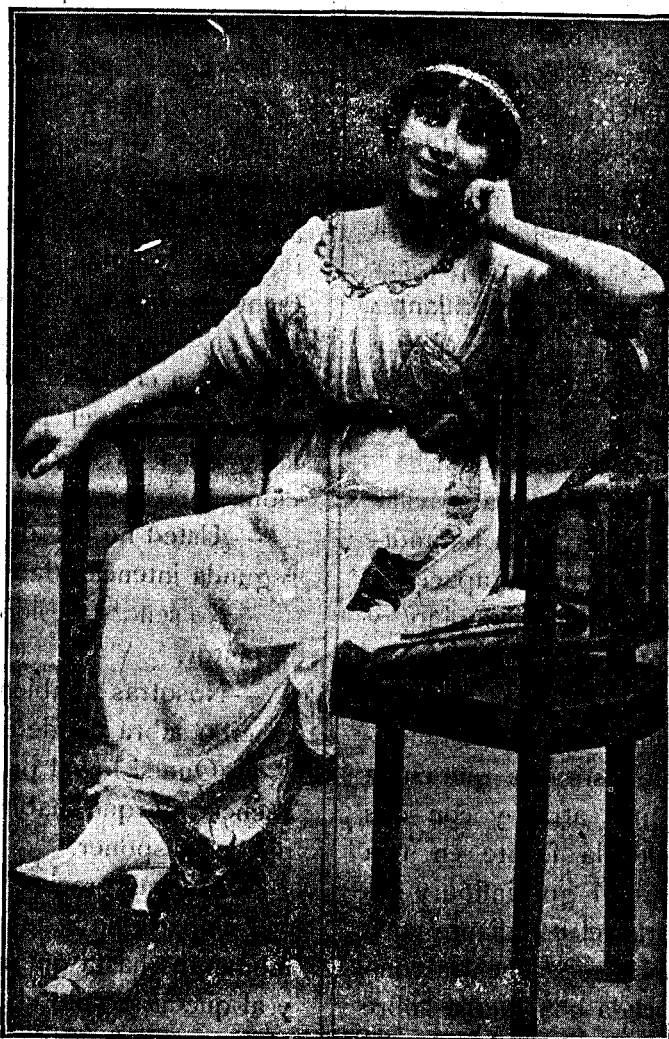
LA FAVORITA (Canzonetista)