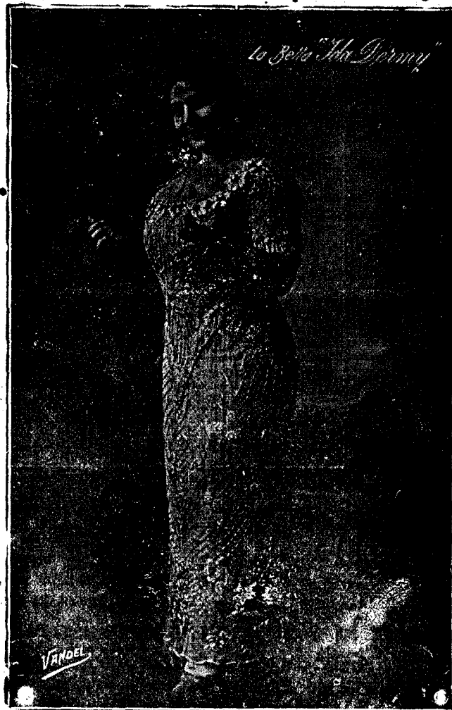
IDA DERMÝ (CANCIONISTA)