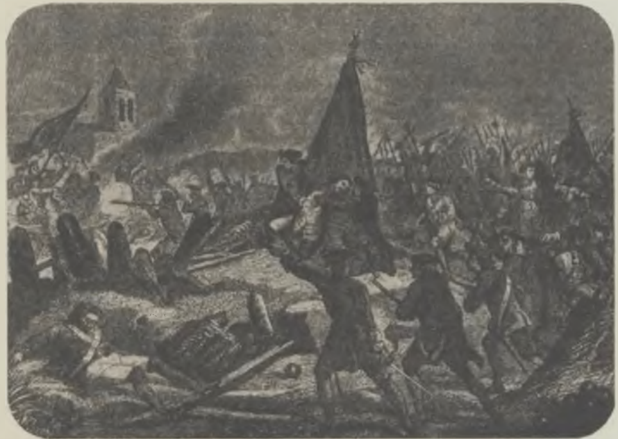
El Conceller en Cap, Rafel Casanova, enarborant la bandera de Santa Eularia, cau ferit, al foragitar les hordes enemigues [del baluart del Portal Nou.]

Entretant, els Concellers, Diputats, Braç Militar i les Juntes, reunits, acordaren fer la