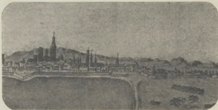
Vista del barri de Ribera, Torra Nova i moll de Santa Creu (1714).

Sobre aquestes runes hi alçaren, com un infamant estigma, l'oprobiosa Ciutadela.