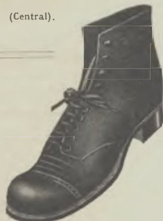
Article 2893. - Reclam BOTINA doble sola, folre de caño... 9.90

LES CASES MILLOR ASSORTIDES EN CALÇAT DE TOTES CLASSES PER A HOMES, SENYORES I NENS