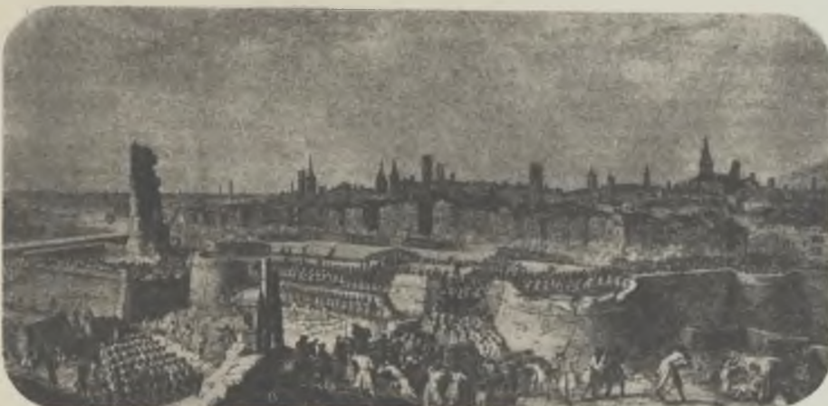
Vista de la ciutat, durant el siti de 1714.

La ciutat, freturosa d'expansió, assalta els suburbis, s'endinsa pels camps, s'arrapa a les muntanyes; i arreu edifica, embellint-ho tot, dintre aquell marc immens, prodigiós, incomparable, que li donà natura per a ostentar dignament el ceptre reial del Mediterrà.