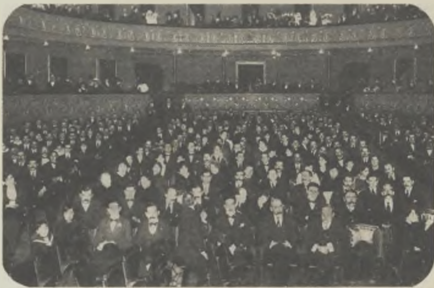
Aspecte que ofería la sala del teatre Victoria, en el festival, celebrat el dia 20 d'agost prop-passat, en homenatge al malhaurat mestre Granados.

Tot català té el dever moral d'ajudar al sosteniment d'escoles catalanes, inscrivint-se soci de l'«Associació Protectora de l'Ensenyança Catalana».