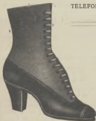
Article 0480 - M. Reclam BOTA xarol, panyo, cosida sola croixada... 9.90

TELEFONS | Coop.: 4 5, 3826 (Central) - 3 nord - 491, 1757 (Central). Unió: 1417 (Juncal) - 1731 (Llibertat).