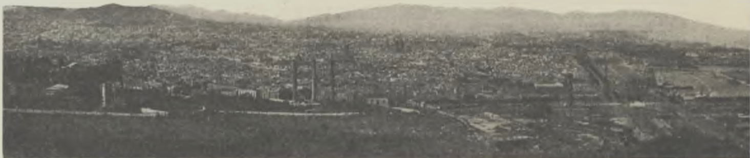
Perspectiva de la ciutat i el port, des de Montjuïc.

La muntanya de Montjuïc desapareixerà amb tots els seus antres repugnants i misteriosos, sos hortets humils i ses fonts típiques. El Montjuïc macàbric, el de les males lle-