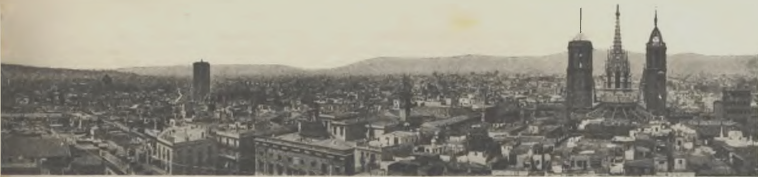
Panorama de Barcelona, en l'actualitat.

genges, el que està com una amenaça enclavada a l'entrada del port, sofrirà les conseqüències del progrés de la ciutat, per a transformar-se en verger immens que destrià odors damunt la Barcelona que l'adorarà.