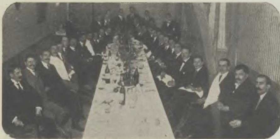
Apai de germanar, cobebest en el Centre Català de Montaner, el dia 19 d'agost prop-passat.

Finalment, el cronista afirma que l'existència del catalanisme naix i creix de la decadència d'Espanya, i a continuació afegeix que Espanya seguirà sempre ascendent. A més de que no sabríem desxifrar aqueix ga-