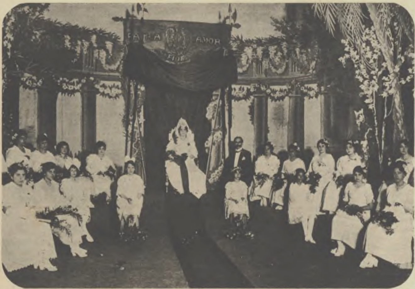
La reina de la festa, acompanyada de la cort d'amor i el poeta premiat amb la Flor Natural.

Tots treballaren amb discreció distingint-se especialment la senyoreta Cabrera, tota