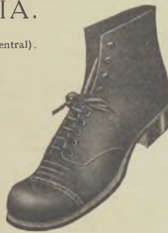
Article 2893. - Reclam

BOTA xarol, panyo, cosida sola groixuda... $ 9.90