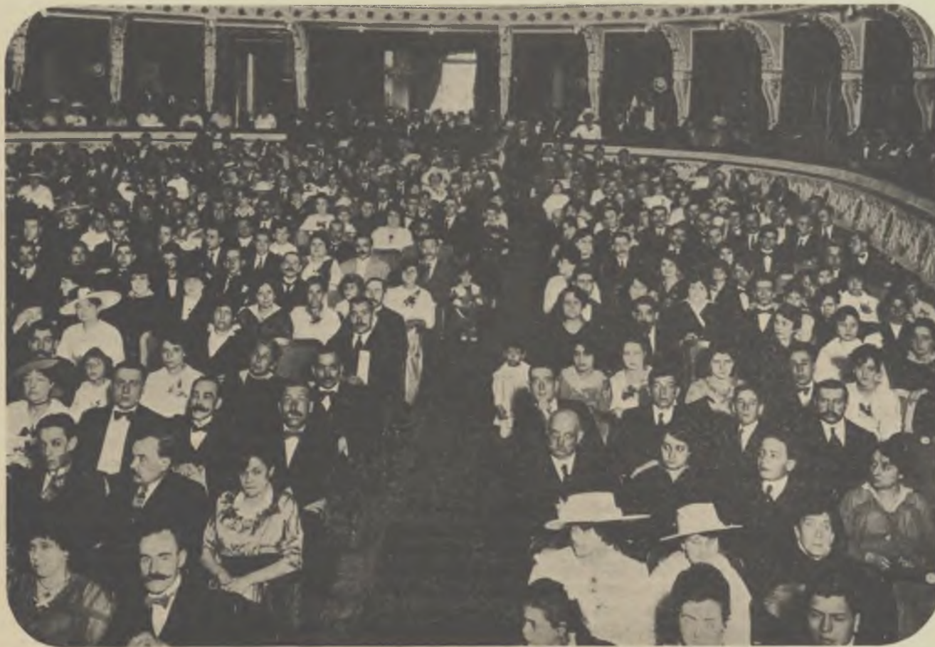
La selecta concurrència que omplenava el saló del teatre Nuevo, on s'efectuà la festa dels Jocs Florals.