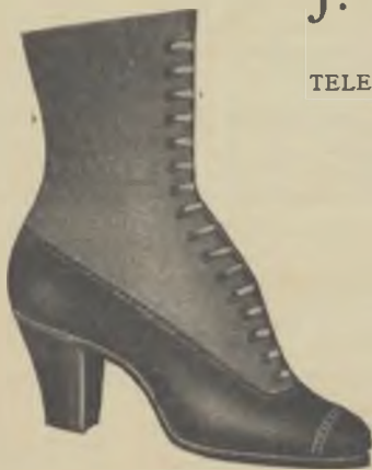
Article 0460 - M. Reclam

Santa Fe, 2273; Tucumán, 399; Santa Fe, 1957; Sarmiento, 1499; Santa Fe, 2051 - Buenos Aires.