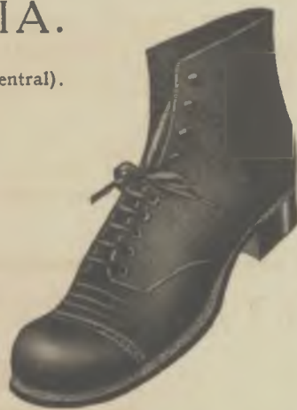
Article 2893. - Reclam

BOTA xarol, panyo, cosida sola groixuda . . . $ 9.90