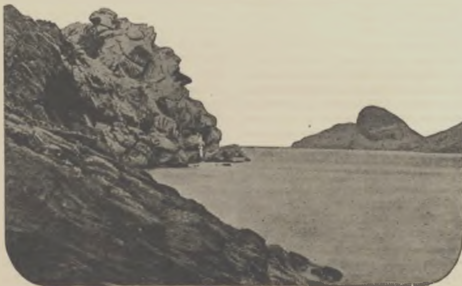
Costa brava catalana.— Illa Grossa i Cap de Creus.