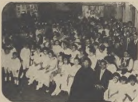
Acte de distribució de premis als alumnes de l'escola gratuïta que sosté el Centre Català de Rosari.