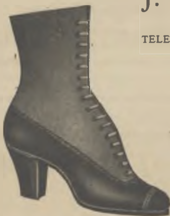
Article 0460 - M. Reclam

BOTA xarol, panyo, cosida sola groixuda . . . $ 9.90