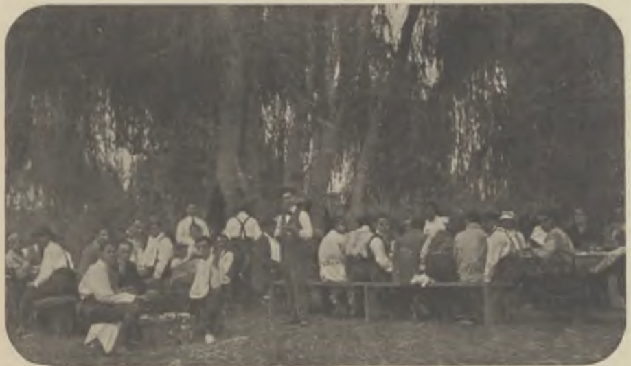
Apet de germanor, celebrat darrerament en el poble «La Lagunita», commemorant el primer aniversari de l'«Orfeó Art i Patria» del Centre Català de Mendoza.