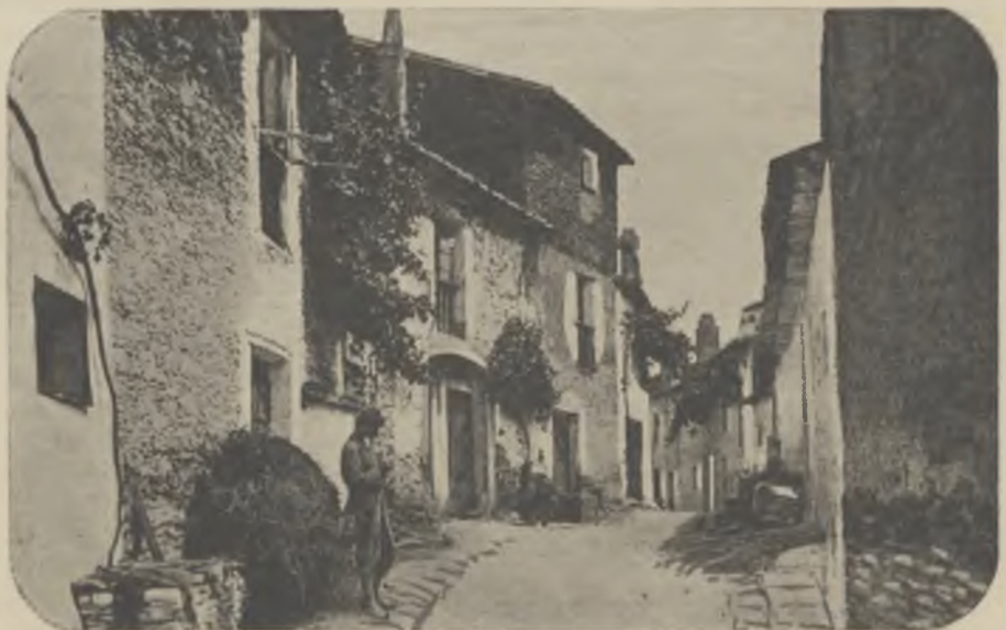
CADAQUÉS. — Carrer de les farres.