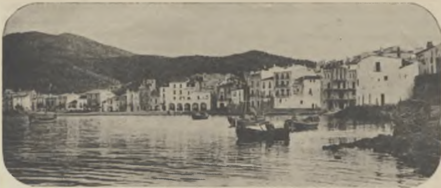
CADAQUÉS. — Vista parcial.