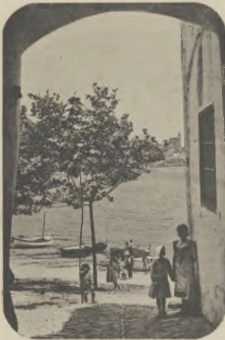
CADAQUÉS. — Des del porxo d'en Sisó.

La nova organització començà a regir el primer de gener de l'any 1915 (la institució de la Borsa data de l'any 1912), i amb ella s'ha aconseguit un major i més fàcil desenrotlle. Comprèn 22 grups professionals i és basada en la rigorosa classificació, l'absoluta separació de sexes i de patrons i obrers, i la independència de funcionament de cada grup professional, centralitzant-se tots ells en la Direcció, fent-se les operacions a l'interior de les oficines, sense picarres, sense ordre de numeració i regint el sistema de fitxes. Durant l'any 1915, a pesar de la crisi i l'anormalitat del treball a conseqüència de la guerra europea, les operacions de la Borsa giraren sota aquest total: demandes de treball, 10.184; ofertes de treball, 4.199; col·locacions realitzades, 3.557. Aquest percentatge de col·locacions sobre les ofertes, demostra l'eficàcia del seu funcionament.