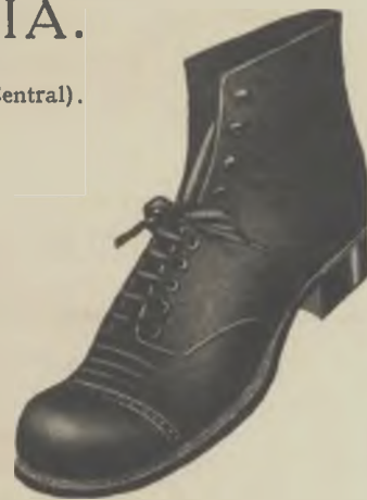
Article 2883. - Reclam

Les cases millor assortides en calçat de totes classes, per a homes, senyores i nens