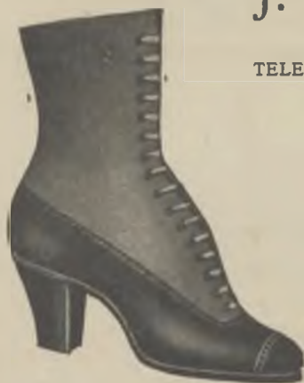
Article 0460 - M. Reclam

TELEFONS { Coop.: 4 5, 3826 (Central) - 3 nord - 491, 1757 (Central). Unió: 1417 (Juncal) - 1731 (Llibertat).