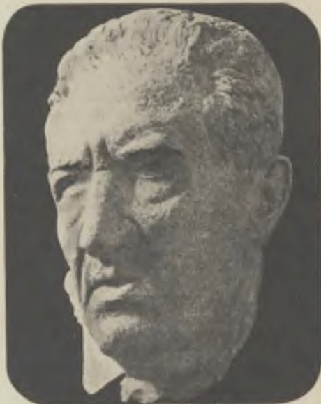
Màscara d'en Soler.

El monument, que perpetuarà el geni artístic de l'Isclé Soler, ha estat sufragat per subscripció pública, mercès a la iniciativa de la benemèrita entitat barcelonina Foment del Teatre Català.