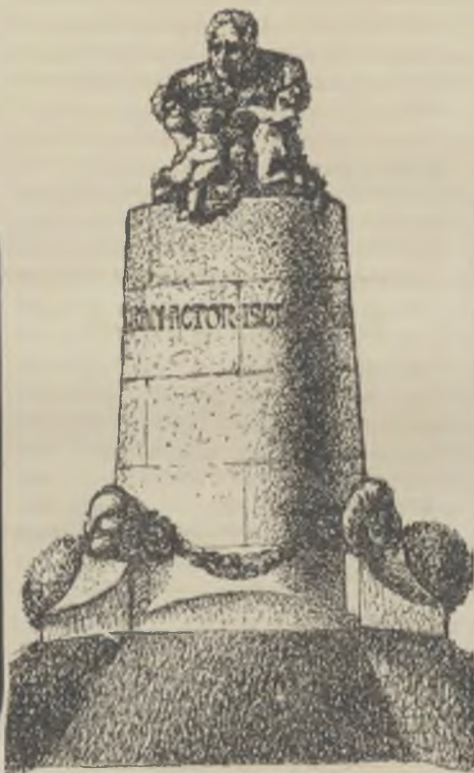
Projecte de monument a l'Isclé Soler.