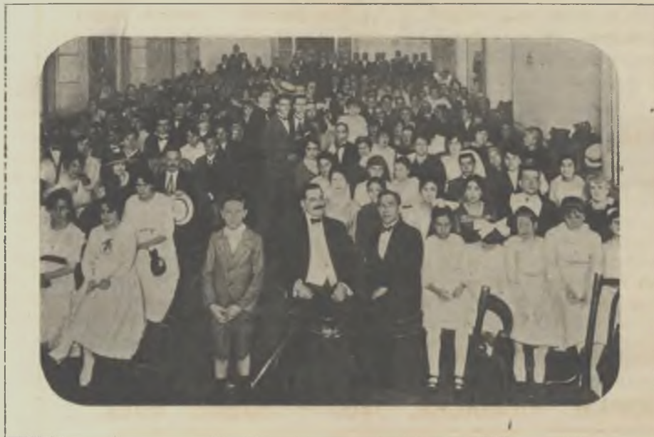
Públic que assistí a la inauguració dels «Dissabtes selectes», organitzats per l'Orfeó Català de Buenos Aires en el Saló-Teatre del Casal Català.

Germanor exigeix que tots els articles siguin rigorosament inèdits i recomana especialment l'adopció de les Normes Ortogràfiques de l'Institut d'Estudis Catalans.