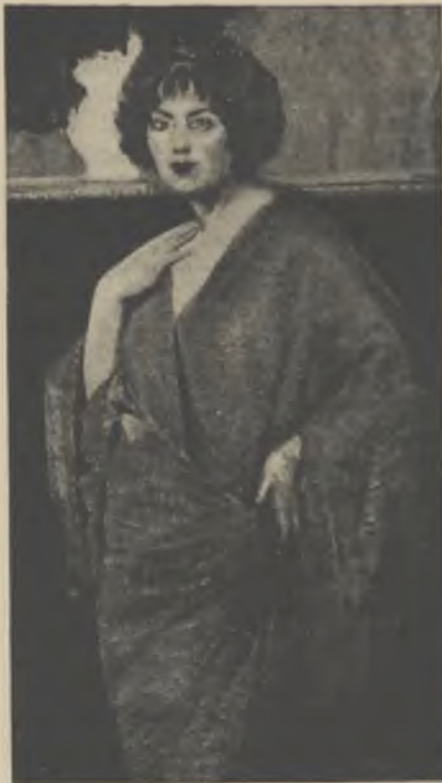
«Les dalies roges», quadre, de l'artista català en Vicens Puig, exposat a la ciutat de Montevideo en el seu primer saló municipal de belles arts, i adquirí per l'ex president de l'Uruguay, en Josep Batlle i Ordóñez.

No vol dir això que no totes les entitats d'aquestes no tinguin la nostra llengua oficial