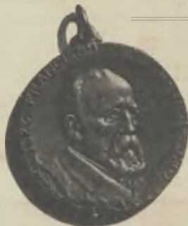
Anvers de la Medalla

Album de reproduccions gràfiques del projecte segons la maqueta d'en Blay. - Preu, $ 0.30