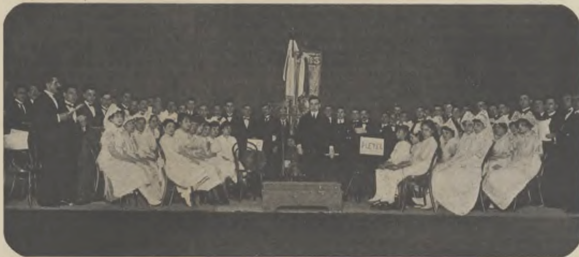
L'Orfeó Català, en el saló «La Argentina», durant el concert.

Tal com tenim anunciat en números anteriors, el dia 23 del prop-passat mes, revetlla de Sant Joan, tingué efecte en la sala d'espectacles «La Argentina», el festival artístic organitzat per la Comissió Delegada a Buenos Aires de la magna Associació Protectora de la Ensenyança Catalana de Barcelona, amb el concurs de les entitats catalanes aquí constituïdes, pel fi altament lloable d'instaurar un premi anyal pedagògic per als concursos que celebra la Protectora en diferents ciutats de la nostrada patria.