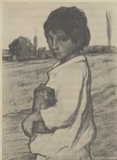
Solitut (dibuix al carbó).