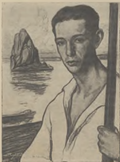
Sportman (dibuix al carbó).

Trobar en mig del materialisme ambient d'aquestes terres profanes encara a les exaltacions sensitives de l'esperit per la bellesa artística, qui, vivint íntimament reclòs amb la seva ànima escullida, labora pacientment i incansable per tal de mostrar, un jorn, que pot-ser veu sols en somnis, la empremta del seu saber, el sagell d'una personalitat inconfundible, es cosa bon xic miraculosa. I si