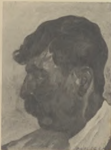
Estudi de cap (oli).

escoles pictòriques ja consagrades, però en això hi cauen tots els artistes incipients que, com en Subirats, papellonegen alentorn dels grans mestres pugnans per a definir-se i trobar una orientació definitiva.