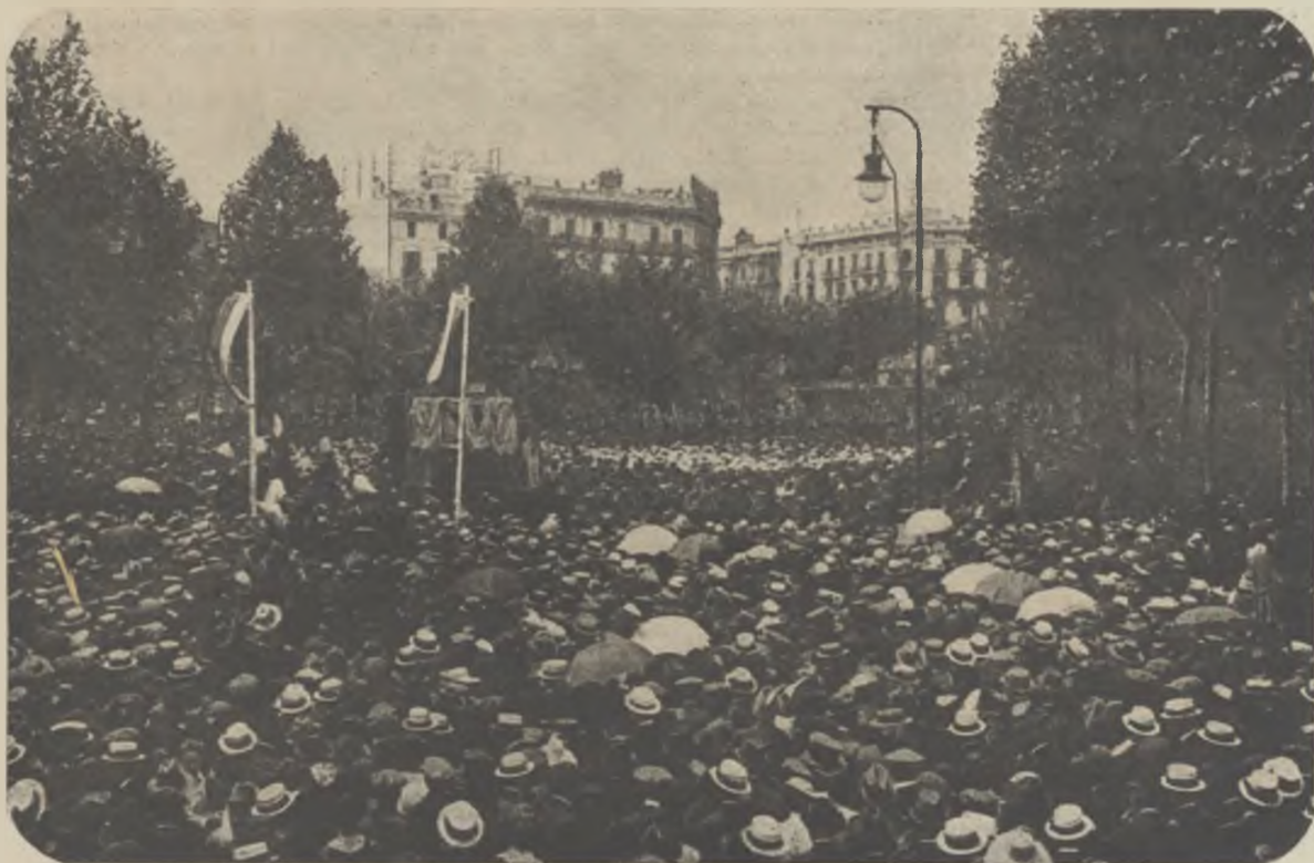
Imposant aspecte que oferia la plaça de Catalunya de Barcelona, amb motiu del concert que hi donaren les masses corals dels orfeons de Catalunya, celebrant el vinticinquè aniversari de la fundació de l'Orfeó Català de Barcelona. Sis mil choristes d'ambdós sexes, sota la direcció de l'insuperable Lluís Millet, desgranaren un programa selectíssim.