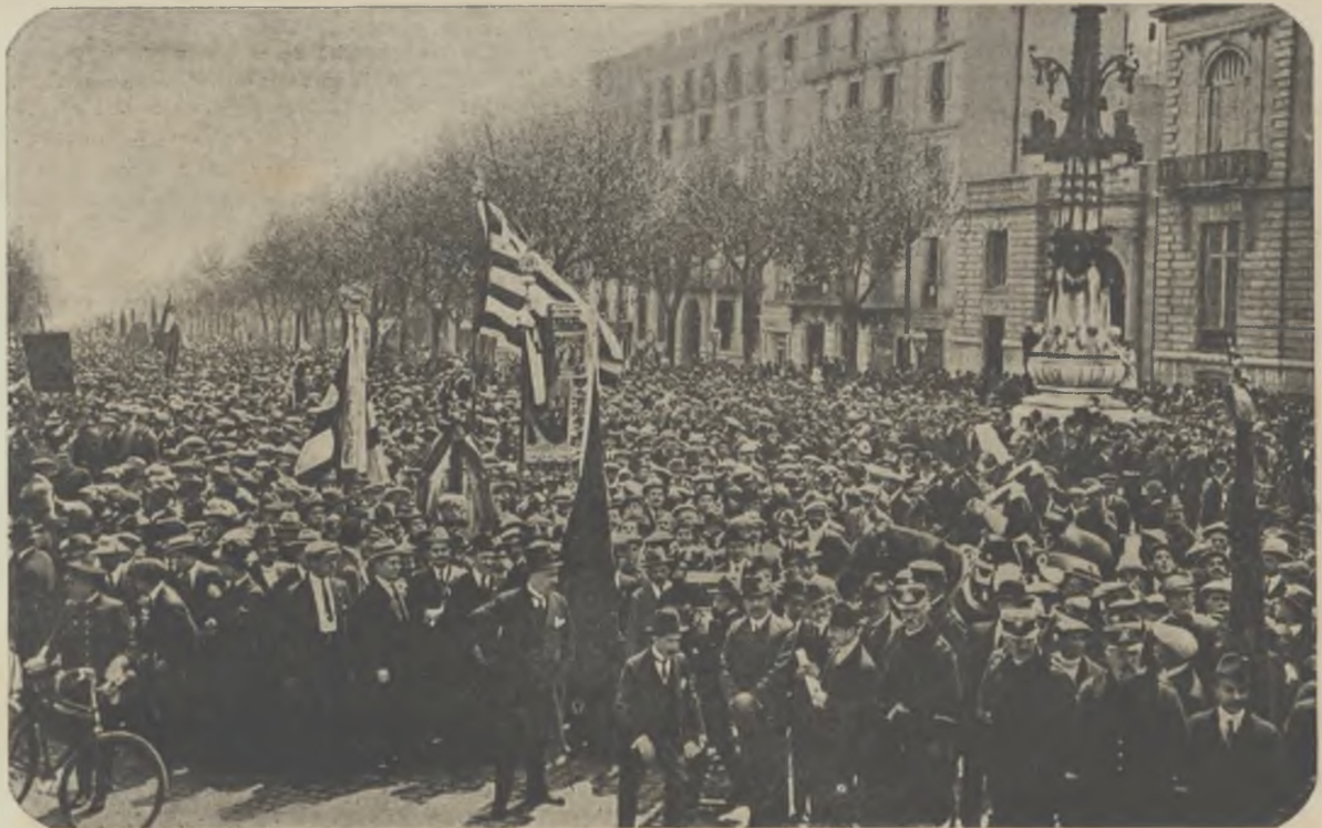
El poble de Barcelona, sense distinció de classes, doctrines ni estaments, veté homenatge al qui fou gran vident i patrici insigne i gloriós, Francisco Pi i Margall. La gran manifestació dirigit-se al lloc on ha d'emplaçar-se el monument que ha de fer inoblidable sa memoria.