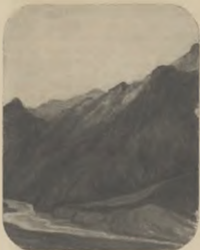
Sol de posta (pastell).

Fcia ja temps que tenia el desig de visitar l'estudi del pintor qui avui honora les pàgines de RESURGIMENT, més que per la pruija de descobrir un artista isolat, per imperiosa comanda de l'esperit freturós de gus-