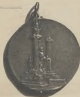
Revers de la Medalla

Mitjansant encàrrec s'en acunyarán en plata a $ 5.50