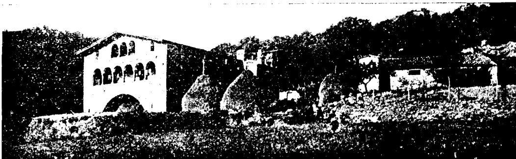
CASA PAIRAL «EL CALLÍS», VALL DE VIANYA