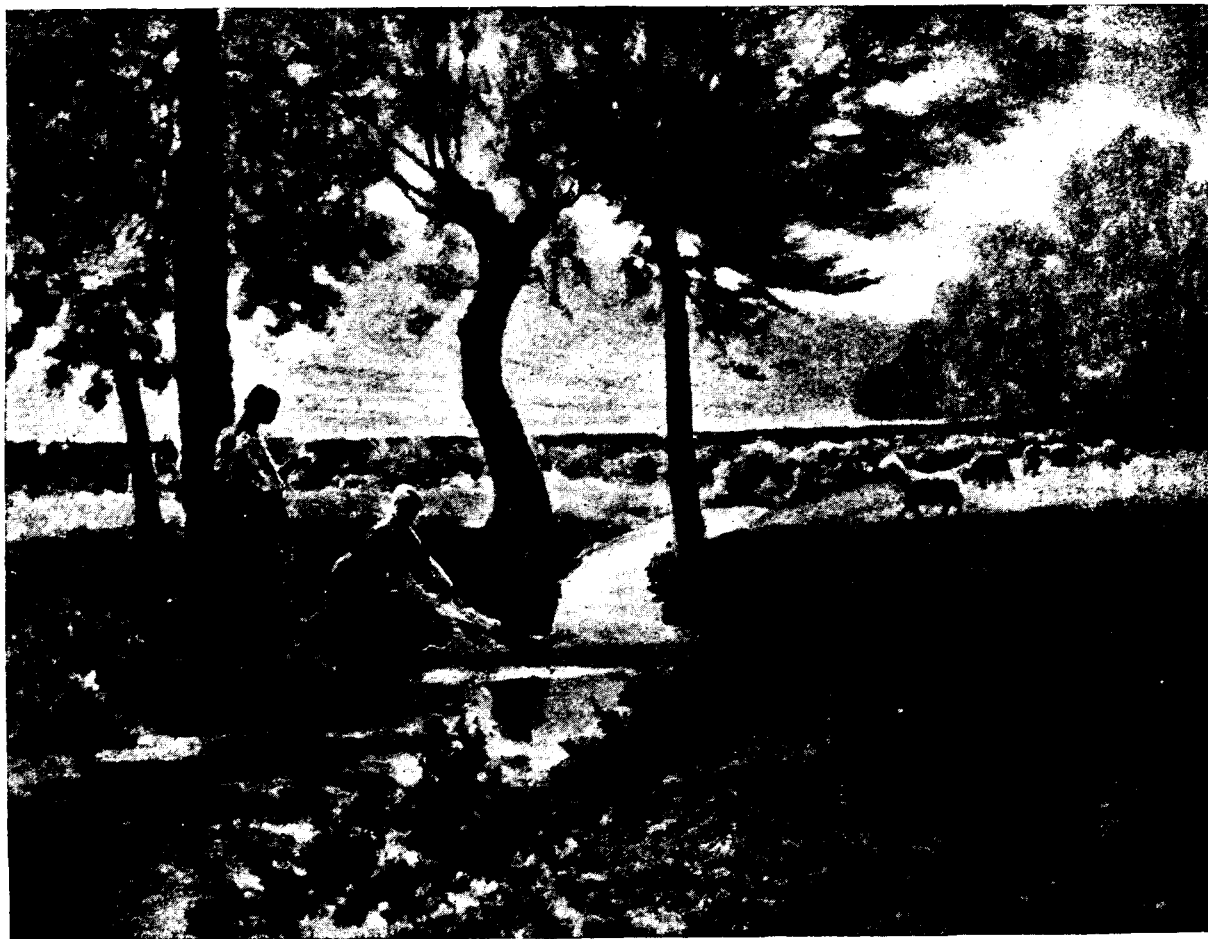
PRAT DE LES INDIANES