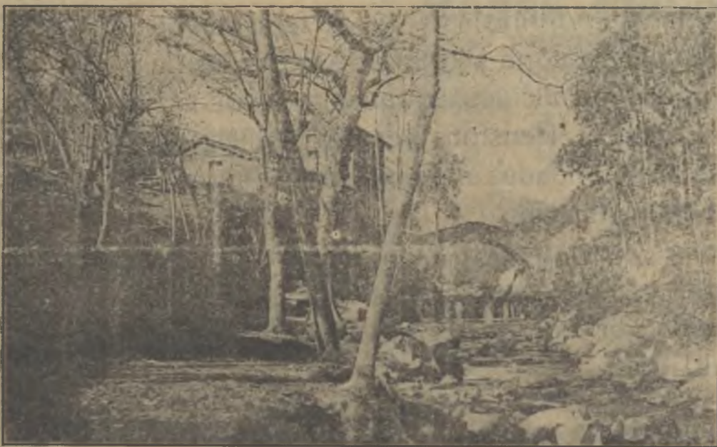
Font i Molí de les Pipes