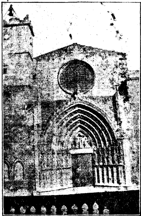
Belleses de l'Empordà Església de Castelló d'Empúries