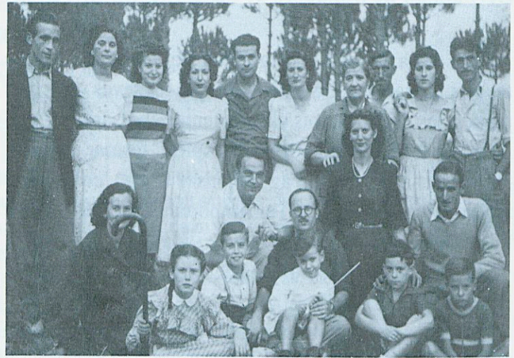
Tornaboda en família a Can Solei, 1948.

per això es retarda la seva incorporació al front. És enviat a Ripoll, Campdevàrol, Lleida (el Segre) i Reus. Essent al Priorat és fet presoner pels moros. Primer el tanquen al Vendrell i després a Tarragona. Els avals que es va buscar no li serviren perquè l'alliberessin. De Tarragona aconseguí que l'enviïn a Barcelona per formar part d'un batalló de treballadors (o de recuperació). Recorda que menjaven bé -tenint en compte les circumstàncies-. Era sagrat anar a missa els dies de festa. L'any 40 pot tornar a Besalú i novament es posa a fer de paleta, ofici que no deixarà fora d'un petit interval d'un any durant el qual va treballar a Can Xeric i a Can Surós.