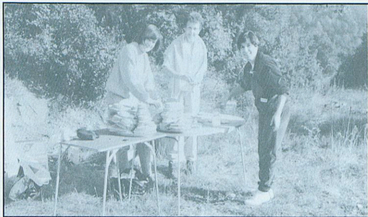
L'esmorzar ja és a punt.

Aquest any, la VIII Marxa de la Bona Petja, als voltants de Besalú, tirarà cap al terme de Sant Ferriol.