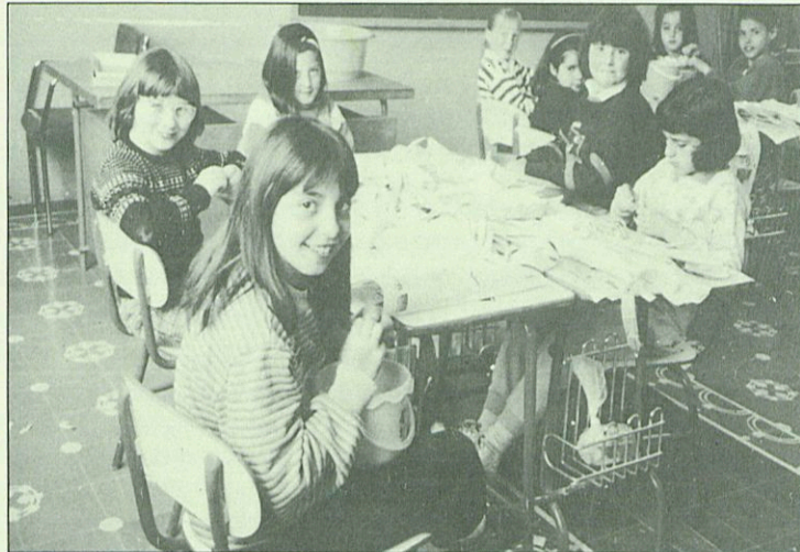
Treballant el paper