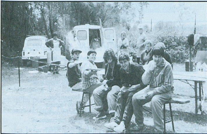
L'arrossada de la Setmana Cultural. Els coneixeu?