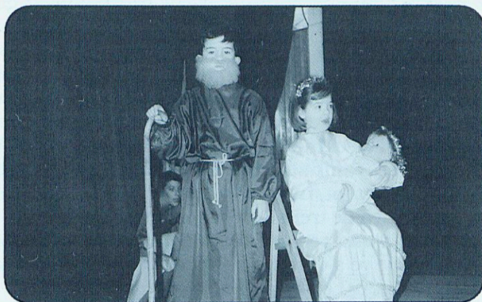
ELS PETITS DE L'ESCOLA TAMBÉ FAN ELS SEUS PASTORETS.