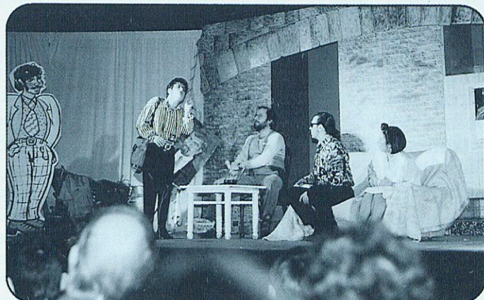
TREIEU-VOS EL BARRET. ÉS LA MILLOR AGRUPACIÓ TEATRAL DE... BESALÚ.