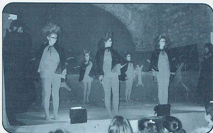
ELS DIMONIS DE 8è. INTENTANT FER CALERONS.