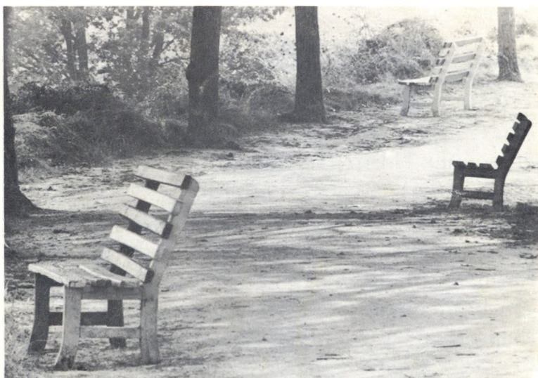
... i bancs.