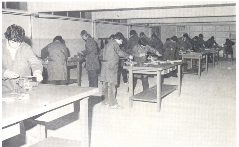
El taller del metall d'Arbúcies, treballant.