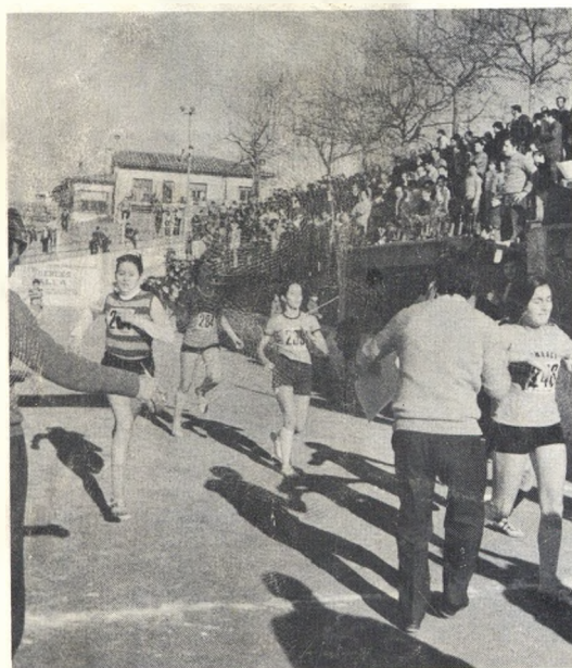
Un esport noble que cal fomentar.