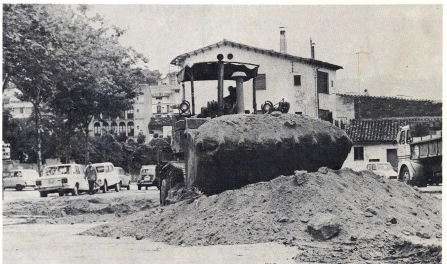
L'enterrament del Turó d'en Rovira