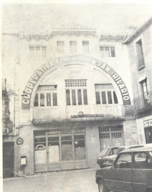
"Hi ha Cooperativa sense cooperadors, com hi ha democràcia sense democràtes."