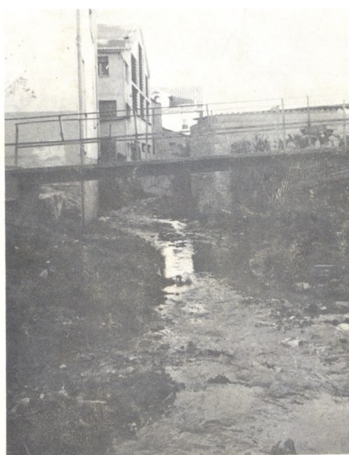
Fins quan la riera de Vallicrosa tindrà el veïnat "parfumat".