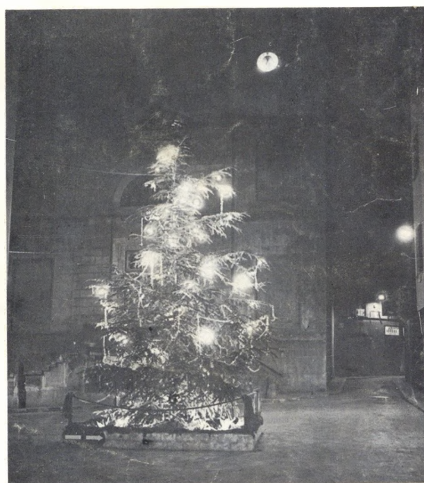
Arbre de Nadal.