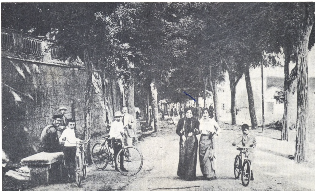
Passeig de la Font Vella.