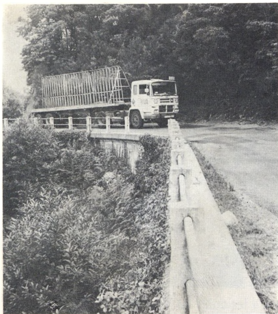
La carretera d'Arbúcies encara és perillosa i en mal estat. Fins quan?