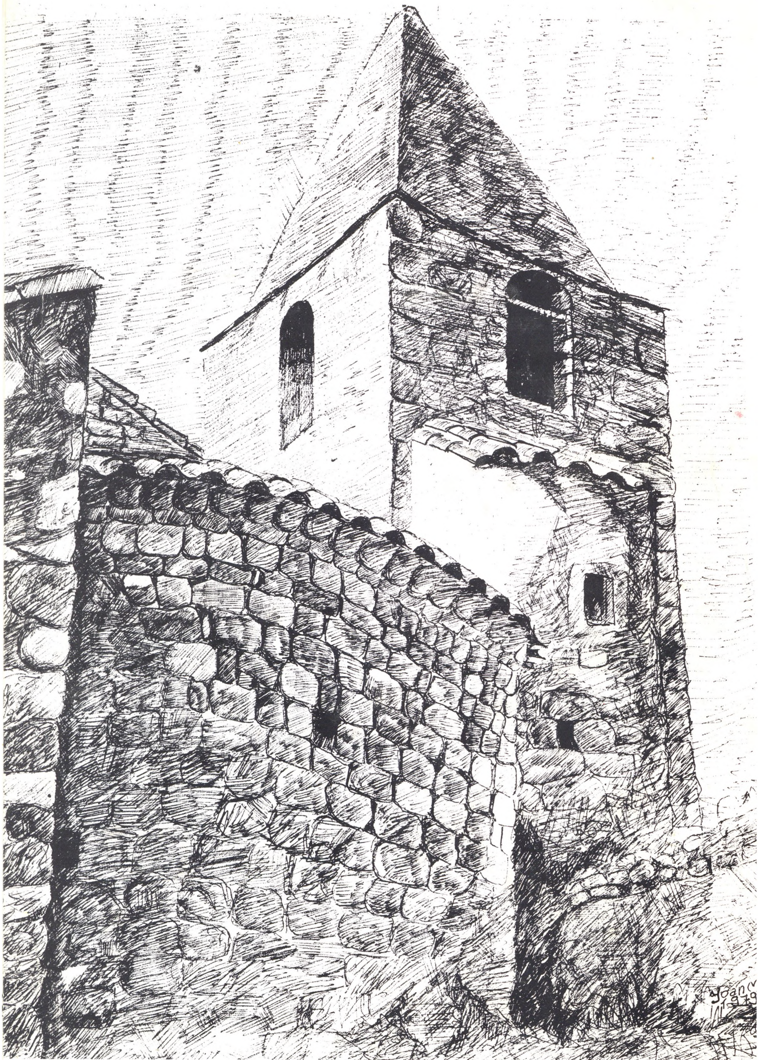
SANT MIQUEL DE CLADELLS